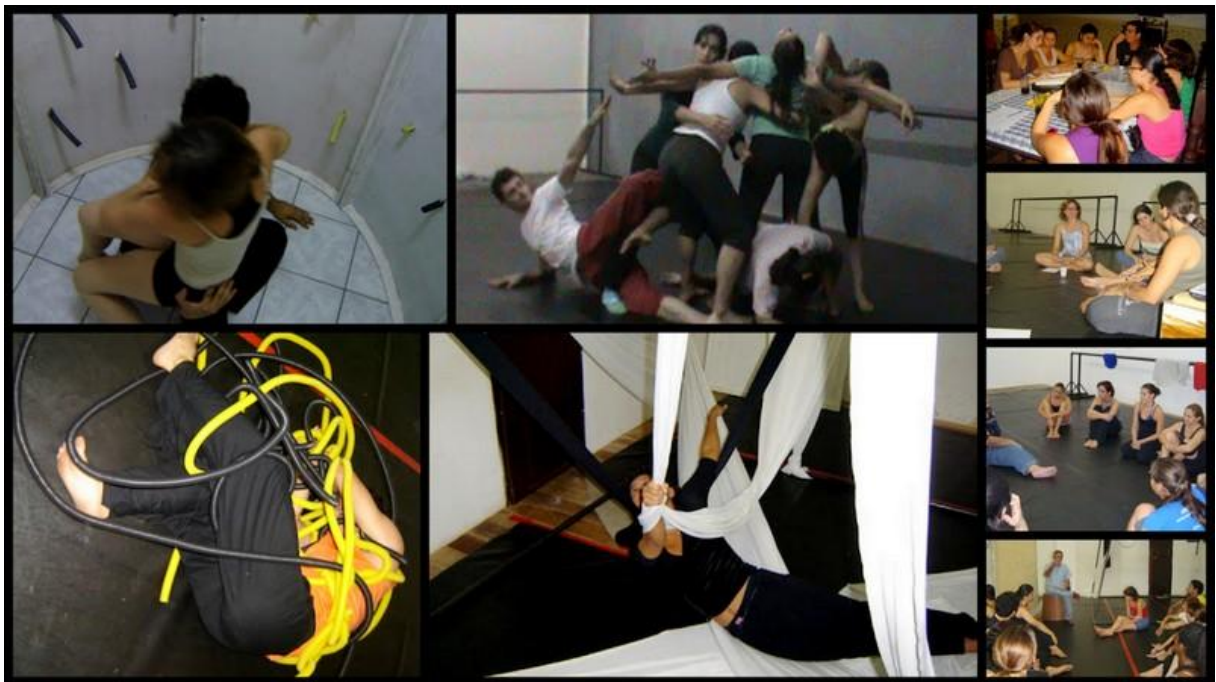
Figura 7: Processos Criativos, experimentações cênicas da Companhia

As suas produções cênicas são materializadas através de um planejamento com base na estética e na criatividade. A improvisação, a personalidade dos intérpretes e o acaso são fatores importantes para a experimentação, renovação de pesquisas de movimentos e criação dos espetáculos. Os temas são variáveis, desde o temático até o mais abstrato e usam diversas estratégias como pesquisa musical, pesquisa de campo, leituras sobre os temas, leitura de poemas, laboratórios teatrais, laboratórios de contato-improvisação, experimentação do material cênico para que, enfim, tenham um resultado cênico quebrando os padrões de estéticas das movimentações que já são pré-estabelecidas por uma determinada técnica. A figura a seguir apresenta algumas dessas estratégias de pesquisa de movimentos, que são laboratórios de criação cênica.