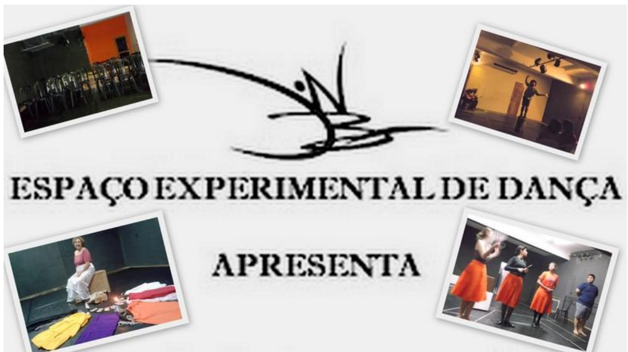
Figura 8: Algumas apresentações de artistas independentes de Belém no Espaço Experimental.

auxiliar os artistas. Além disso, o espaço funciona para reuniões, encontros ou até mesmo ensaios para grupos independentes que não possuem sede própria para realizar suas criações cênicas. A companhia recebeu elogios de vários grupos independentes de Belém que já apresentaram suas produções no Espaço Experimental, os quais aprovaram a iniciativa de abrir suas portas para esta finalidade. A figura a seguir mostra alguns dos espetáculos apresentados neste espaço alternativo.