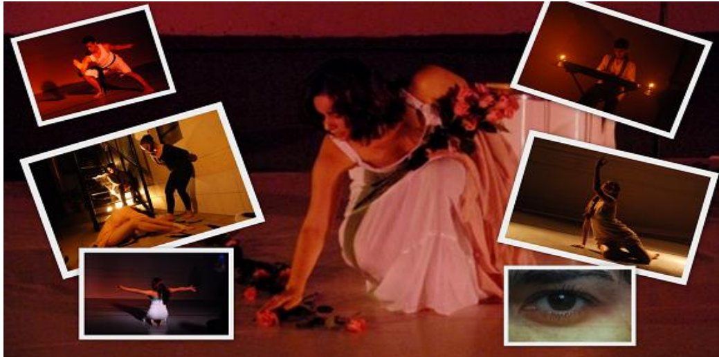
Figura 4: Alguns dos trabalhos Cênicos do Repertório Paralelo: Versos Modestos , Fuga , Nunca Mais , Suceder-se a ti , A ver , Através do Espelhos , Casa do Zé Cotinha .

resultados tem-se coreografias, performances, cenas, vídeodança, improvisações, entre outros, conforme revelam as imagens a seguir.