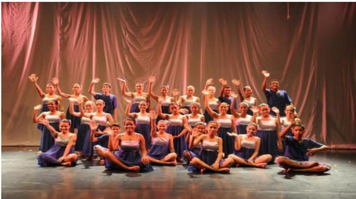
Figura3: Grupo de jovens do projeto ABC no espetáculo Desanuvio.

Durante esses anos, com esse trabalho voluntário, surgiram vários espetáculos como: Identidade Aberta (2006); Sentimentos do Mundo (2007); Feminino Plural (2008); Feito D'água (2009); Por Entre Olhares (2010); Desanuvio (2011). A figura a seguir apresenta o grupo de jovens do Projeto ABC em um dos seus espetáculos.