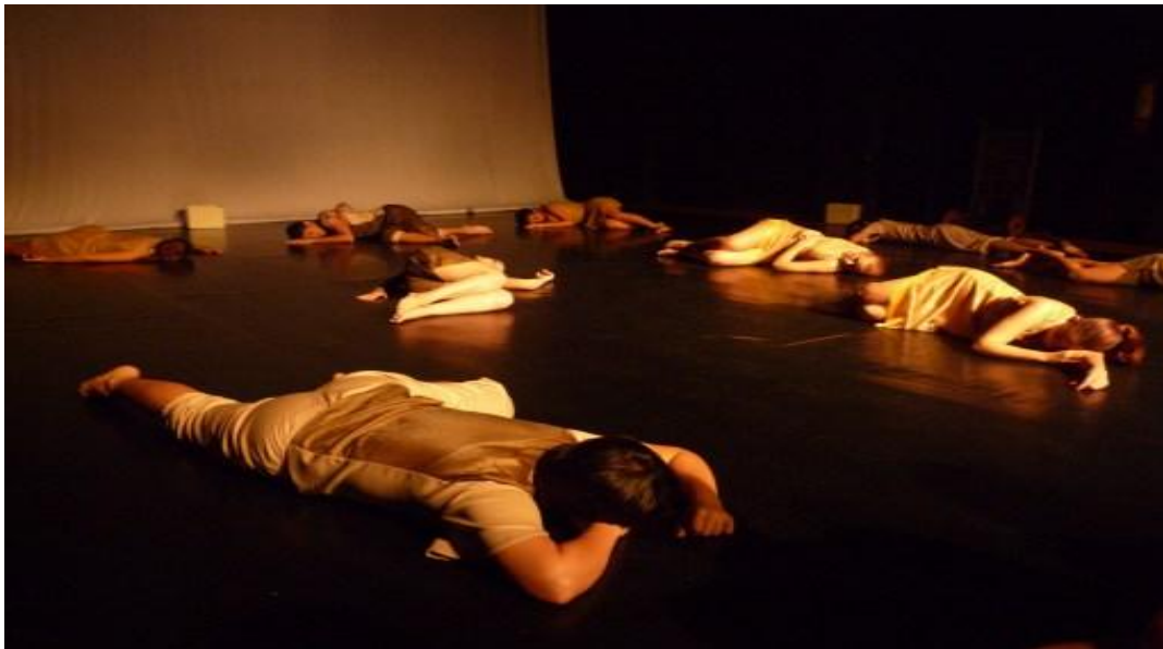
Figura 2: Grupo Moderno em cena no Espetáculo Vem-de-som (2009).

Ao longo de 5 anos de realização de seus trabalhos, eles foram premiados com o Prêmio Secult em 2008 e também foram contemplados duas vezes com a bolsa de pesquisa e experimentação artística do Instituto de Artes do Pará (IAP). Em 2007, que resultou no espetáculo Aconteceu Contorcido , e em 2009, que resultou no espetáculo Vem-de-som . A imagem a seguir apresenta o Grupo de Dança Moderno em Cena em um dos seus trabalhos coreográficos.