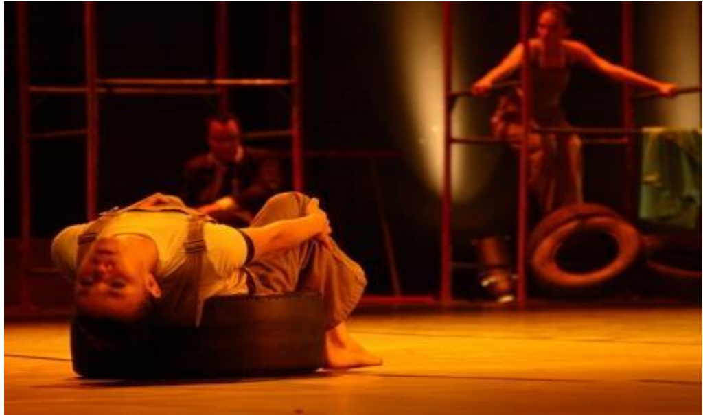
Figura 1: Companhia Moderna de Dança no Espetáculo Metrópole (2003).