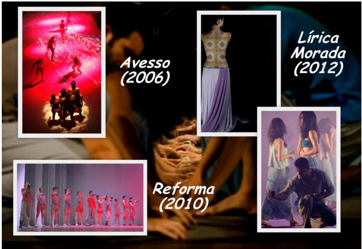
Figura 5: Espetáculos contemplados pelo Prêmio Funarte Klauss Vianna