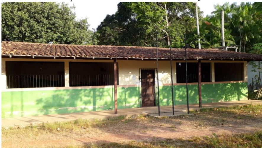
Figura 2: Escola Municipal de Ensino Infantil Fundamental Quilombola do Rosário.

O tema da pesquisa é sobre a construção do projeto político pedagógico da Escola Municipal de Ensino Infantil Fundamental Quilombola de Rosário, a escolha do mesmo ocorreu de forma coletiva juntamente com a comunidade, pois durante o tempo comunidade os moradores observaram uma deficiência na comunidade a respeito de como poderia ser trabalhado a educação escolar quilombola.