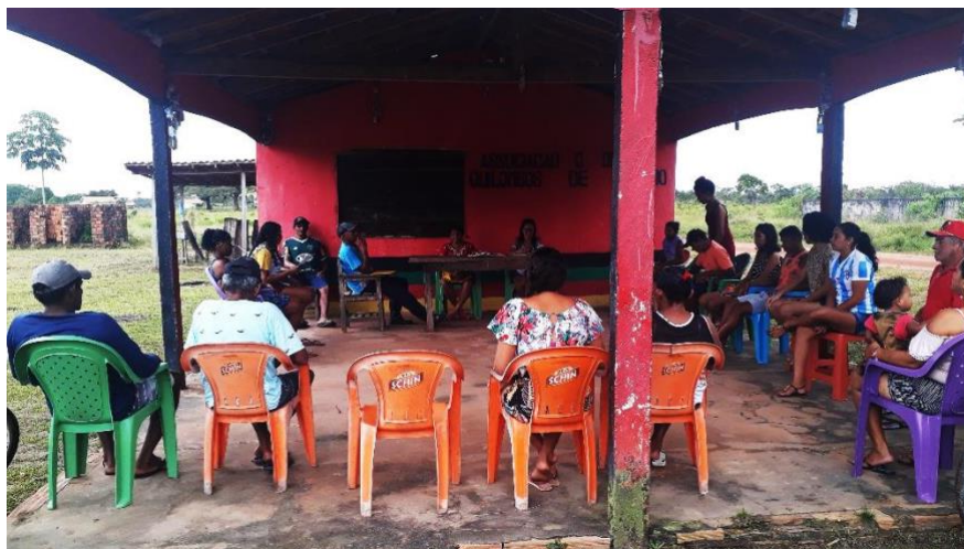
Figura 3: Reunião na Associação para a escolha do tema do pré-projeto.

A ideia de se trabalhar essa problemática se deu a partir de uma consulta prévia ocorrida no dia 22 de setembro 2018 na sede da Associação comunitária de Remanescente de Quilombo de Rosário com os moradores onde chegamos à conclusão de que o presente trabalho poderá realizar-se como projeto de intervenção contribuindo na elaboração do Projeto Político Pedagógico da escola dentro da perspectiva da educação quilombola.