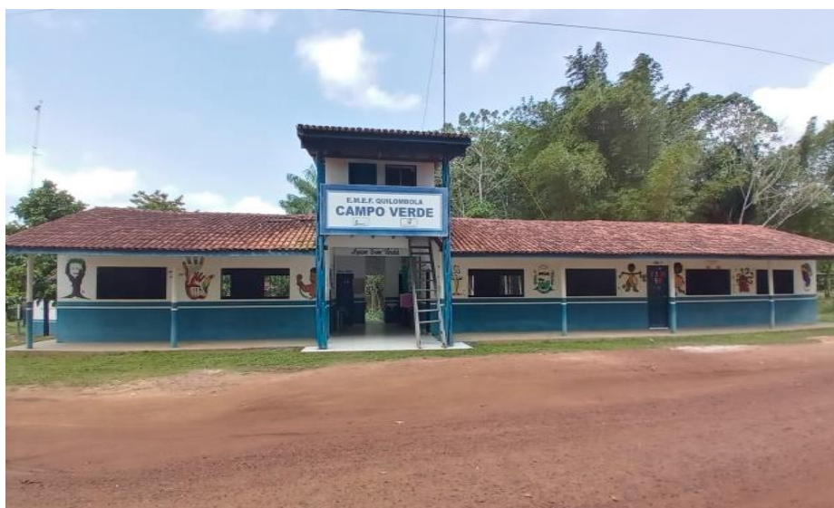
Figura 2 - Escola Quilombola Municipal de ensino fundamental de Campo Verde