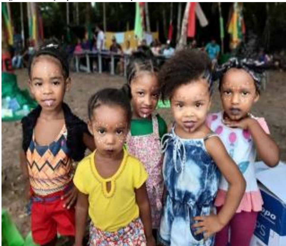
Figura 6- Crianças quilombolas do Campo Verde