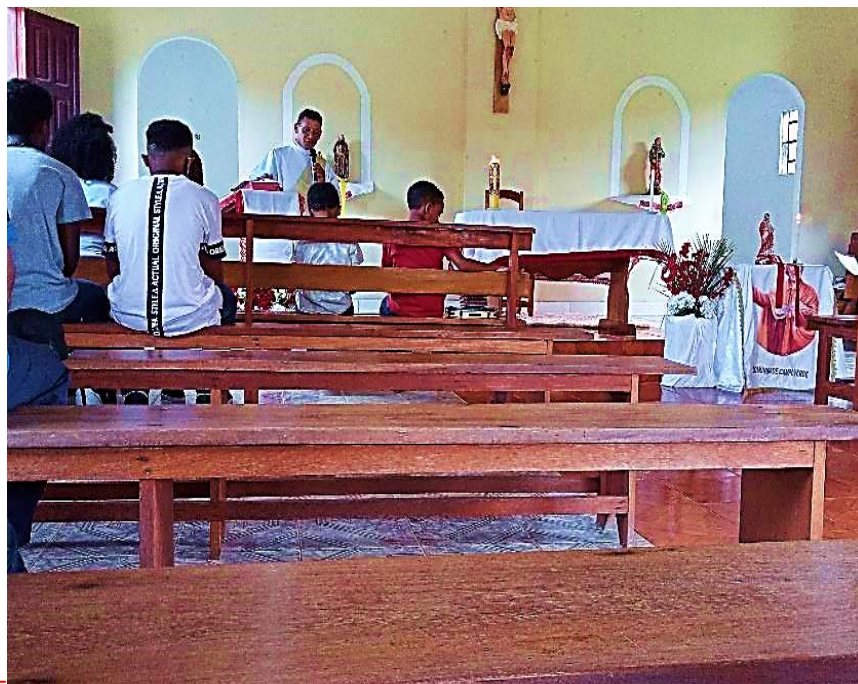
Figura 5 - Festividade do padroeiro São Tomé.