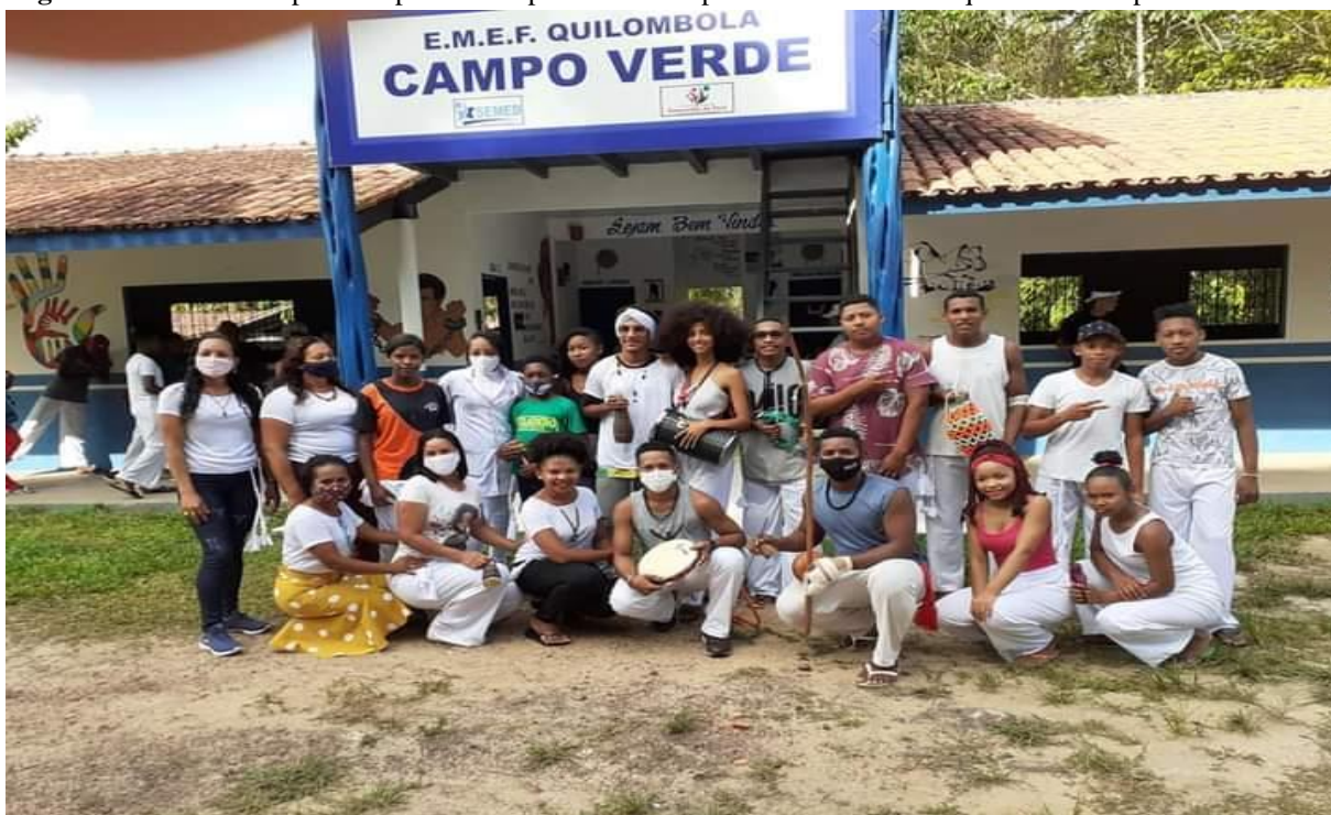
Figura 7- Oficina de capoeira representada pelos alunos e professores da escola quilombo Campo Verde.