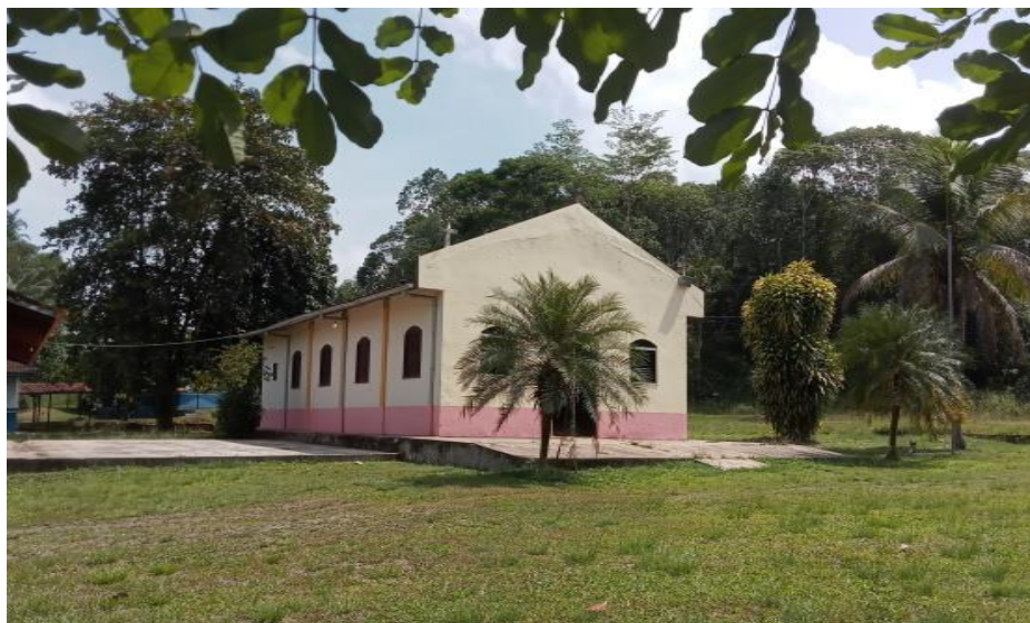
Figura 1 - Igreja Católica na comunidade