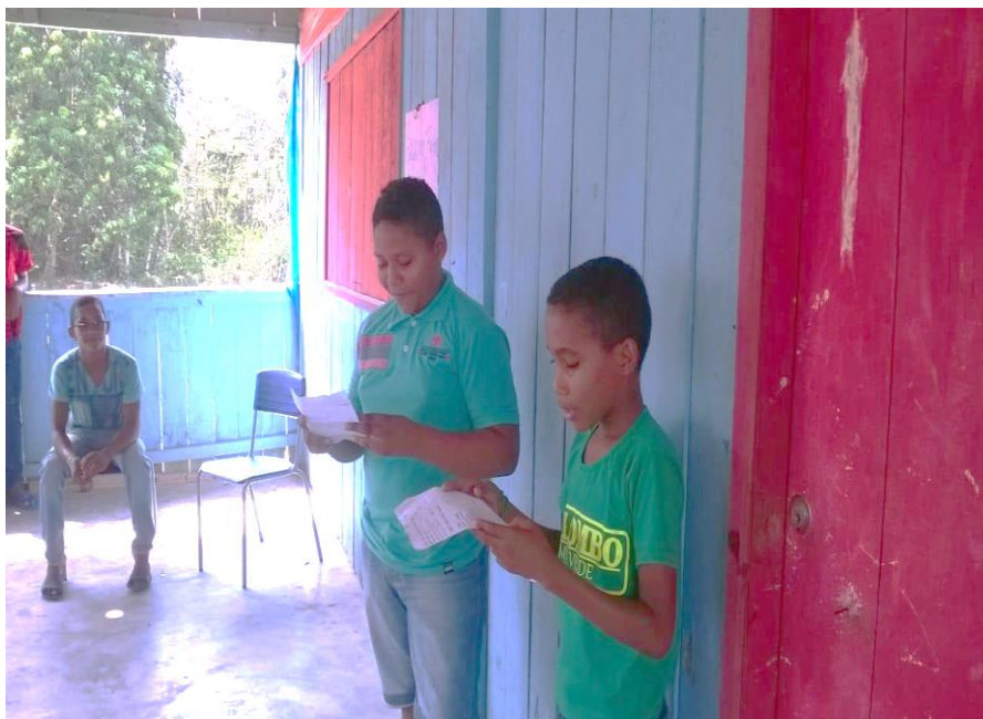
Figura 8 - Alunos apresentando a música “Negro ostentação”

Alunos apresentando trabalho, em paródia “negro ostentação” e “igualdade racial é possível”: