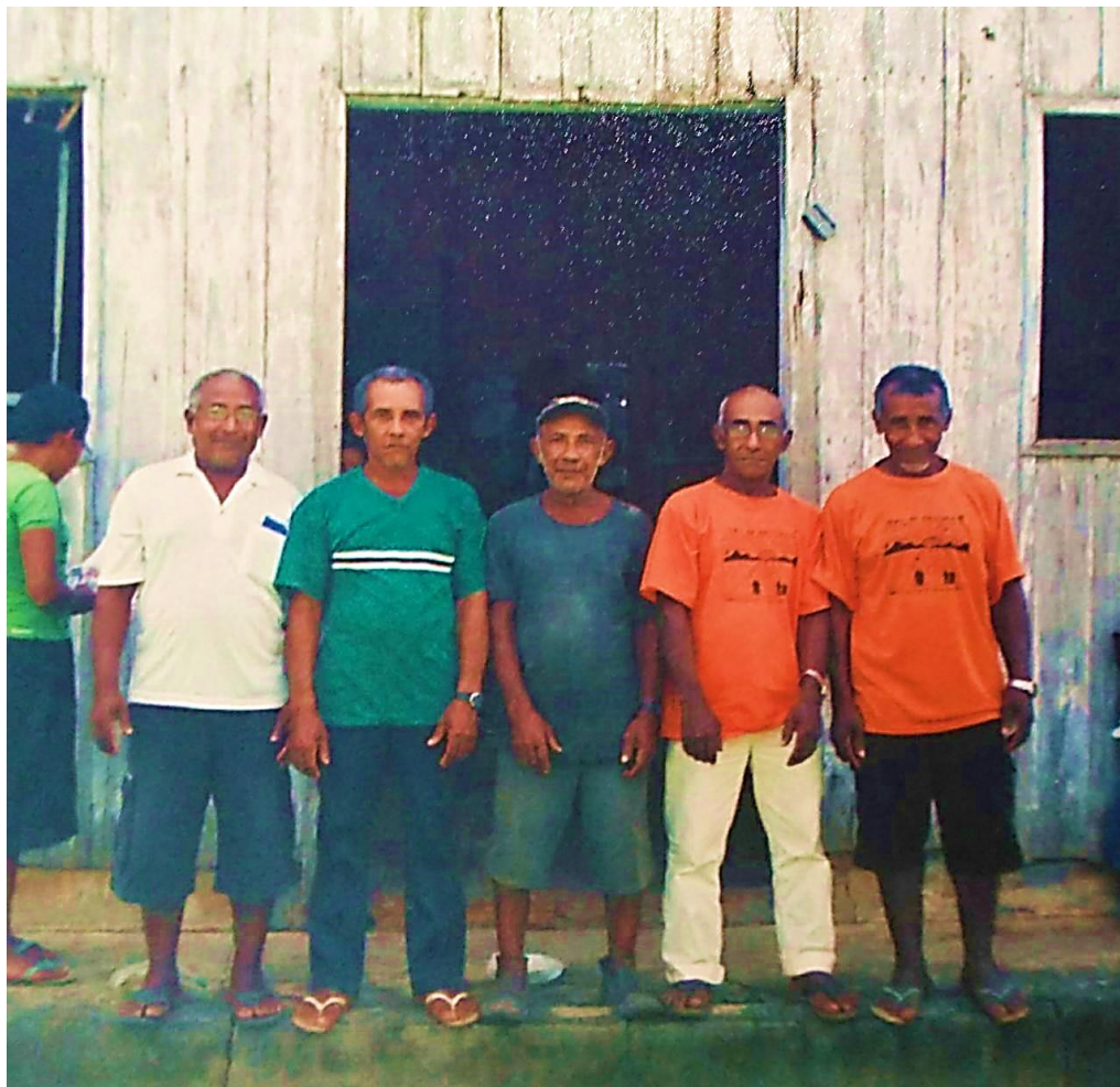
Figura 4 – Pioneiros do Quilombo Campo Verde.

Fonte: arquivo pessoal de Jose Francisco Maciel da Silva (2003).