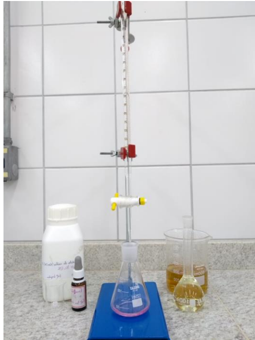
Figura 3 – Análise de ATT realizada nas bebidas.