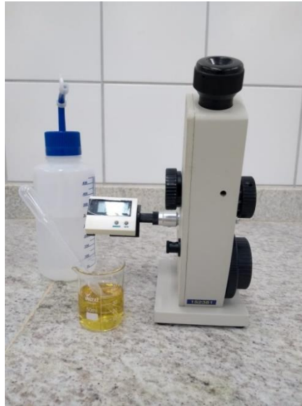
Figura 2 –Análise de sólidos solúveis totais realizada nas bebidas.