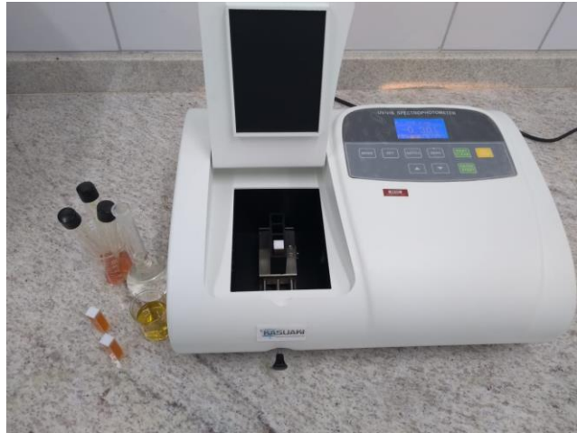
Figura 5 – Análise de açúcares redutores.