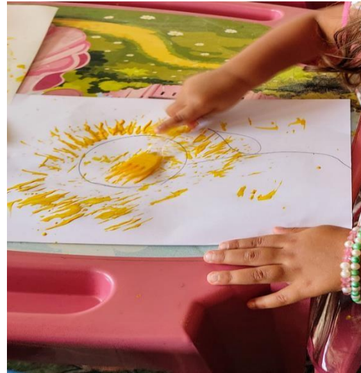
Figura 02 - Pintura com garfos