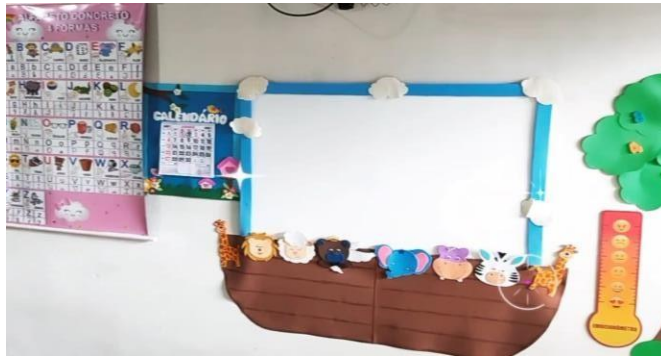
Figura 17 - Sala de apoio, “Pimpolhos da Lari”