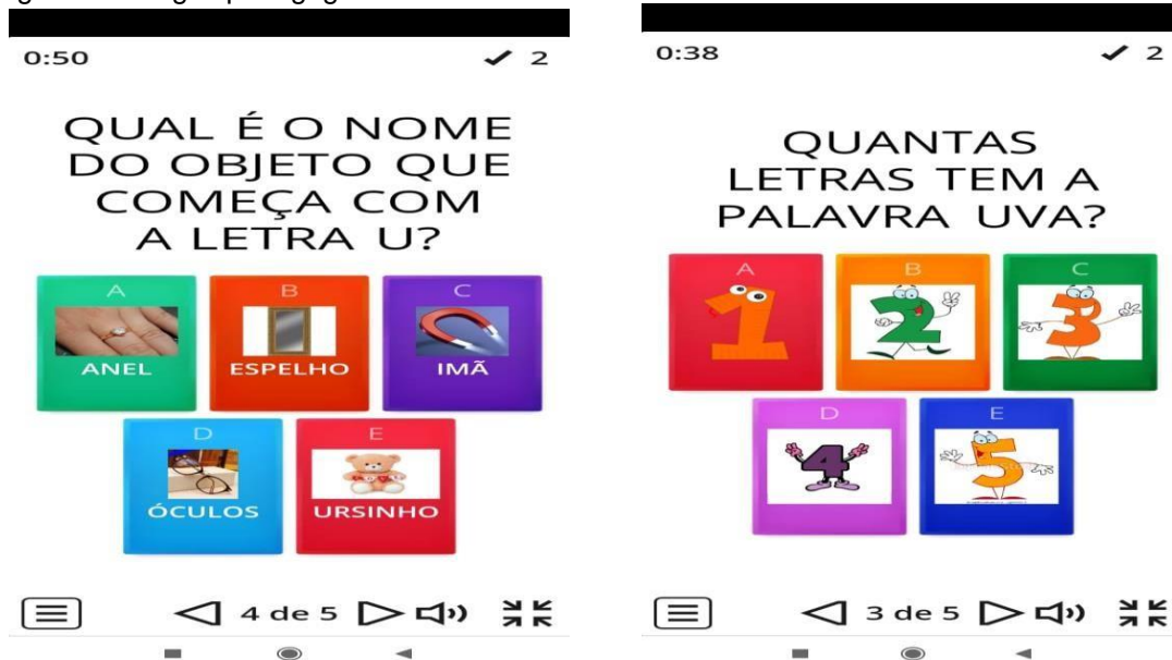
Figura 19 - Jogos pedagógicos virtuais