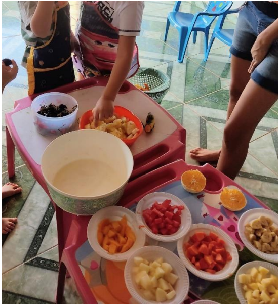
Figura 11 - Receita salada de frutas