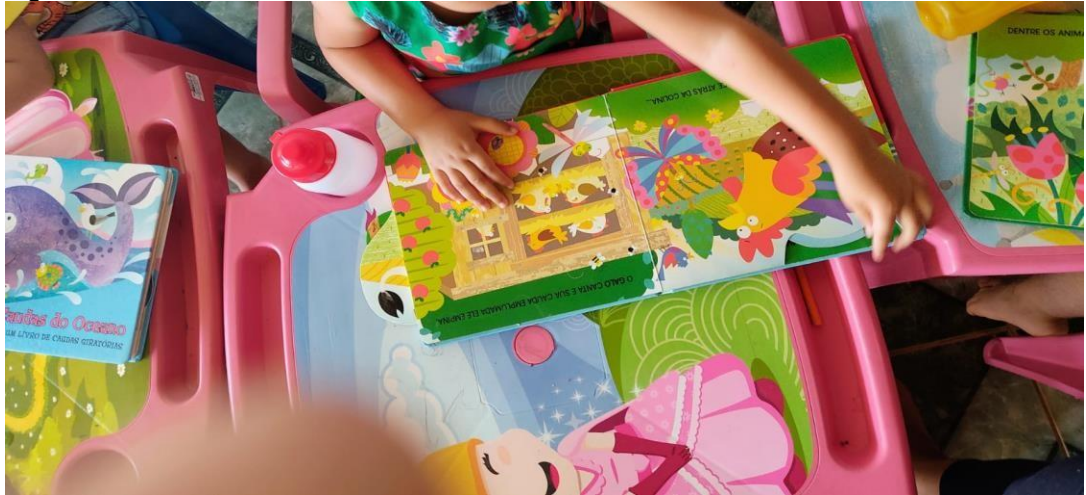
Figura 06 - Uso do livro, mostrando as letras