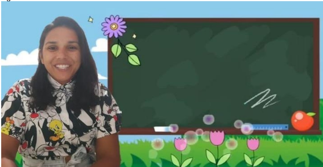
Figura 18 - Sala virtual

As atividades direcionadas sem o uso das cartilhas, peço lhes que explorem o ambiente familiar, quais materiais temos em casa? Podemos fazer cartazes, fichas com o alfabeto, procuramos objetos pela casa que iniciam com determinado som fonético e nomes dos familiares, não tem nada melhor do que ajudar a mãe na cozinha, vamos fazer uma sopa, observar os ingredientes através de uma receita cantada, "Sopa de lelê" do grupo palavra cantada, compreendendo a estrutura da escrita musical, rimas.