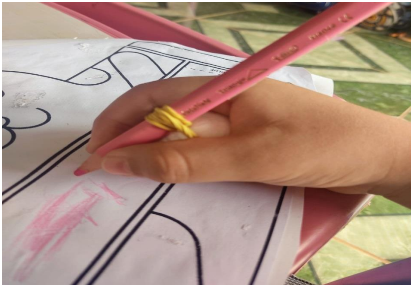
Figura 05 - Uso do lápis com liga e bolinha

É importante frisar que muitas crianças já vêm de casa, com alguma base, já tendo noção de letras e fazendo uso de lápis, porém, para se trabalhar a forma correta do pegar no lápis, de preferência inicialmente utiliza-se o giz de cera, lápis grossos, mas mesmo assim, temos crianças que não desenvolvem essa simples habilidade sozinhas, para isso, uso uma bolinha de isopor e liga, amarro na proximidade da ponta do lápis e a criança pega posicionando na mão onde a bolinha fica em sua palma como mostra a imagem a seguir.