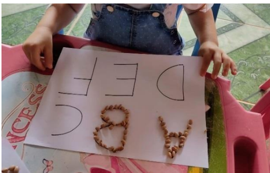
Figura 13 - Cobrindo letras