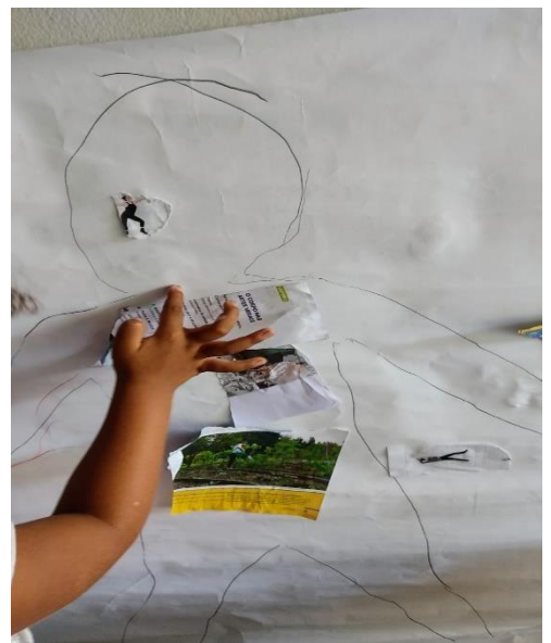
Figura 07 - Construindo meu

O desenho do meu corpo: com uma cartolina ou papel madeira, deita-se a criança no chão e vai desenhando o seu molde, depois cole em um espaço na parede na altura da criança, e peça para observar as partes desenhadas, depois vão preencher com pedaços de revistas e livros.