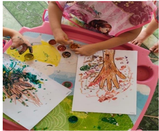
Figura 08 - Pintura árvore

Utilizando, folha A4 com a gramatura mais grossa, tinta guache, canetinha, giz de cera e cotonete.