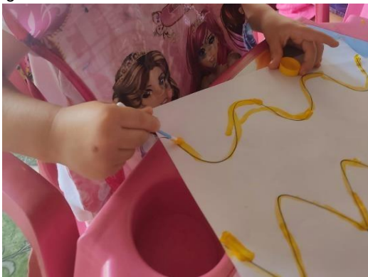
Figura 03 - Pintura com cotonete