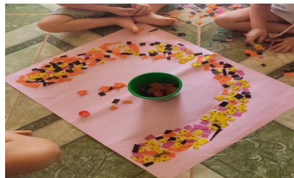
Figura 14 - Decorando letras através de colagens