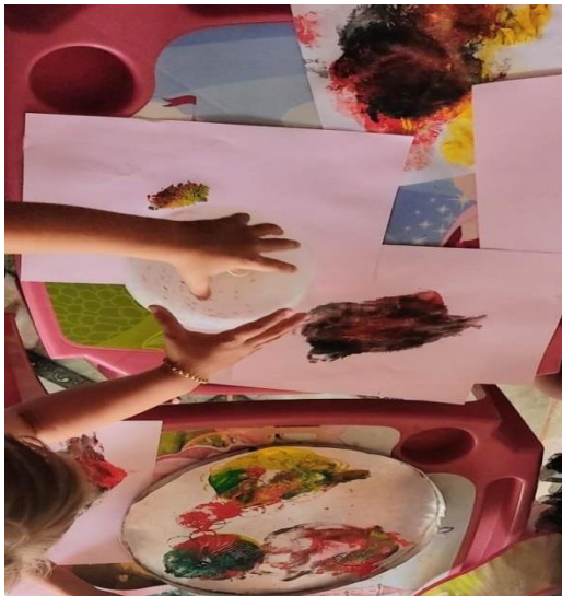
Figura 01 - Pintura com balões