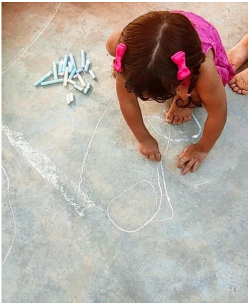
Figura 09 - Expressão de escrita no chão

Ao se falar de um mundo magnífico, cheio de informações, não podemos omitir ao negar o contato com o letramento para as crianças, disponibilizando informações relacionadas a esse tema construindo um espaço em que poderão ser apresentados, atividades como rótulos, nomes das crianças, letras do alfabeto, músicas, receitas, listas. O campo é amplo, depende da criatividade de fazer algo e inovar, nunca perdendo o foco de uma aprendizagem com significado.