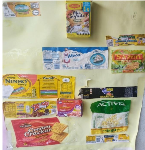
Figura 12 - Cartaz rótulos