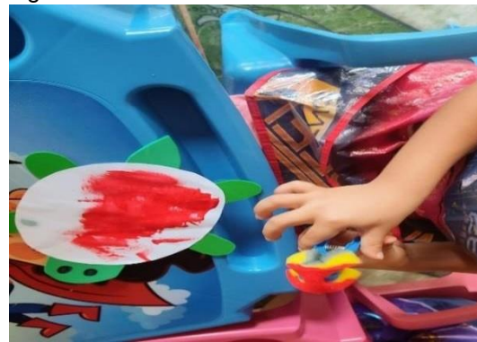
Figura 04 - Pintura com bucha