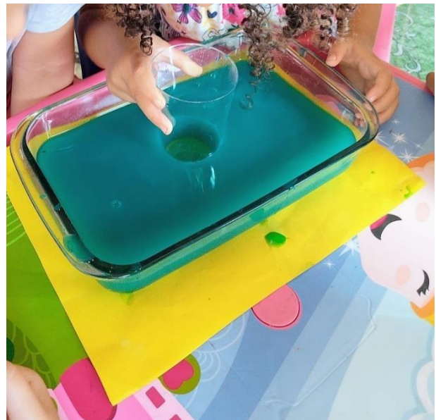
Figura 10 - Caça as vogais