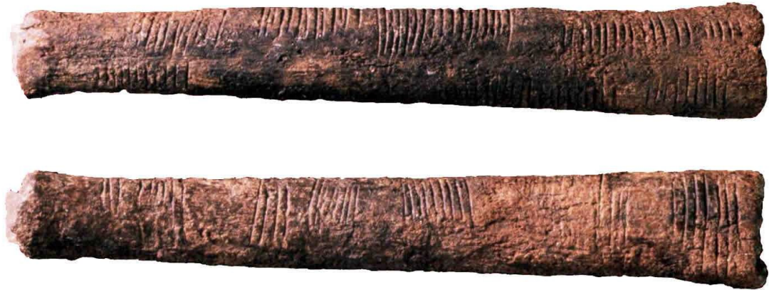
Figura 1.1: Faces frontal e posterior do Osso de Ishango — Institutroyaldessciencesnaturelles de Belgique . SANTOS 2013.

Registros primitivos demonstram ensaios humanos que comprovam a contagem de outras formas, enfatizando, que, embora tenhamos conhecimentos de alguns modos de contagem, a história pode revelar modos diversos. Observemos a figura 01.