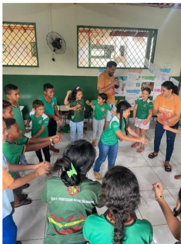
Figura 04 - Brincadeira educativa realizada na oficina

Mestre mandou". Na brincadeira, as crianças passam a imitar comandos do/a agricultor/a, com expressões e representações corporais das ações na roça (capinar, plantar, roçar, cavar, colher, encoivarar, torrar farinha). A ideia da brincadeira é fortalecer a interação entre as crianças e o fazer dos/as agricultores/as, estimulando o trabalho em grupo e a concepção da roça como vida, aprendizado, vivência e pertencimento.