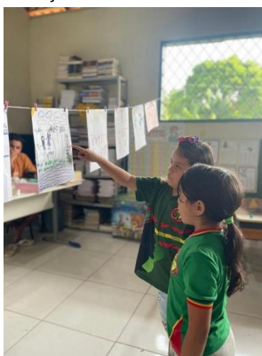
Figura 03: Varal da Roça construído na oficina com as crianças

Nessa etapa, ao final da atividade as crianças construíam o “Varal da Roça” (Figura 03) com os seus desenhos formando um espaço coletivo e de compartilhamento de saberes e opiniões da temática. Neste ponto, novamente Santos (2023), é requerido na discussão ao afirmar que é somente quando alguém se torna compartilhante da terra, da vida, das sementes que passa a existir uma verdadeira roça. Assim, a roça não é somente técnica, é também relação, roça não é só plantio, é também convivência, roça não é só produção, é também compartilhamento. Roça é também garantir bem viver no território.