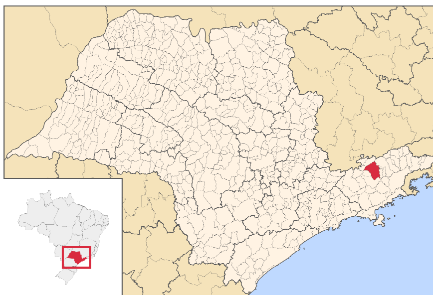
Figura 2: Localização da cidade de Pindamonhangaba no Estado de São Paulo