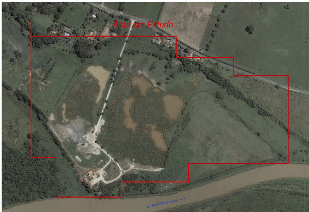
Figura 3: Vista aérea da localização da área à margem esquerda do Rio Paraíba do Sul.