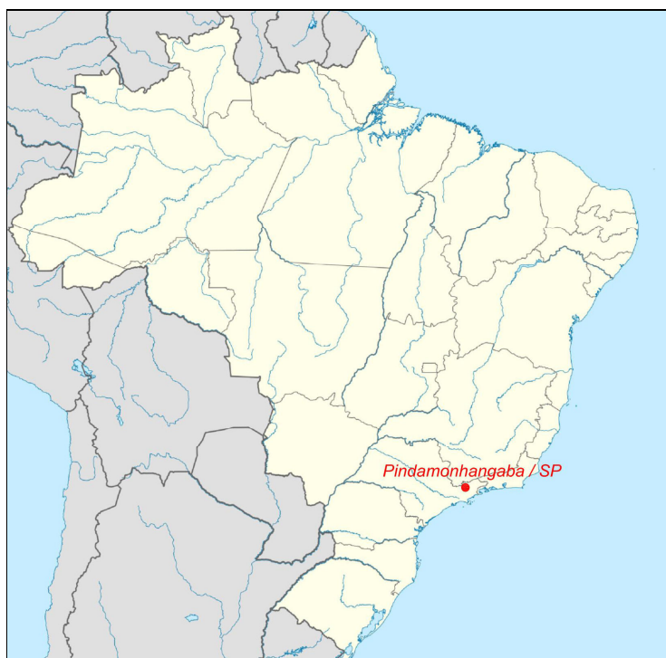
Figura 1: Localização da cidade de Pindamonhangaba no Brasil