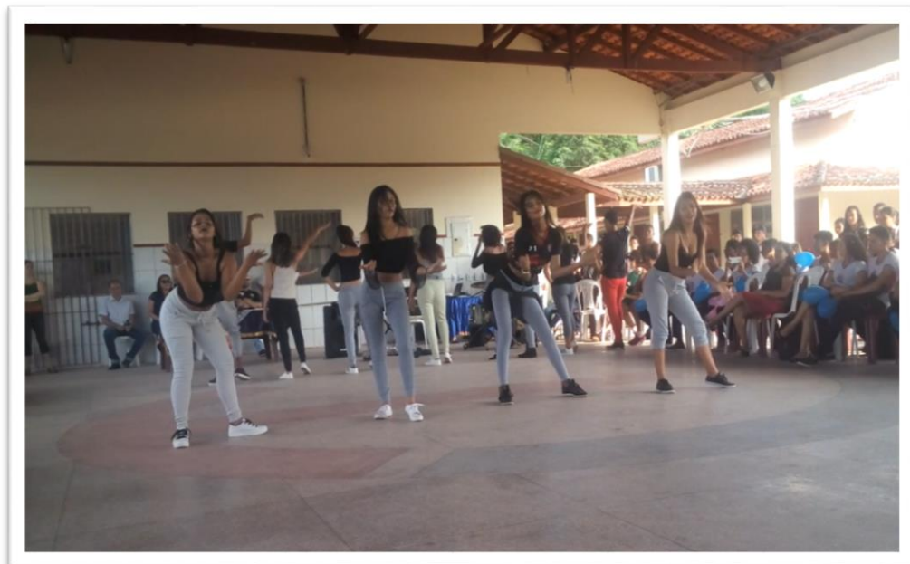
Fotografia 09 – Meninas da equipe fúria