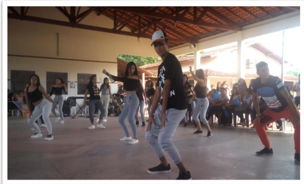
Fotografia 11 – Show de rebolados