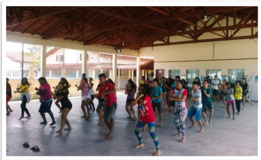
Fotografia 03 - Ensaio no Salão do Grupo educar pela pesquisa

O conteúdo programático a que se refere este artigo incluirá diversos aspectos da história e da cultura que caracterizam a formação da população brasileira, a partir desses dois grupos étnicos, tais como o estudo da história da África e dos africanos, a luta dos negros e dos povos indígenas no Brasil, a cultura negra e indígena brasileira e o negro e o índio na formação da sociedade nacional, resgatando as suas contribuições nas áreas social, econômica e política, pertinentes à história do Brasil. (Lei 10.639/03, art. 26, § 1º e 2º)