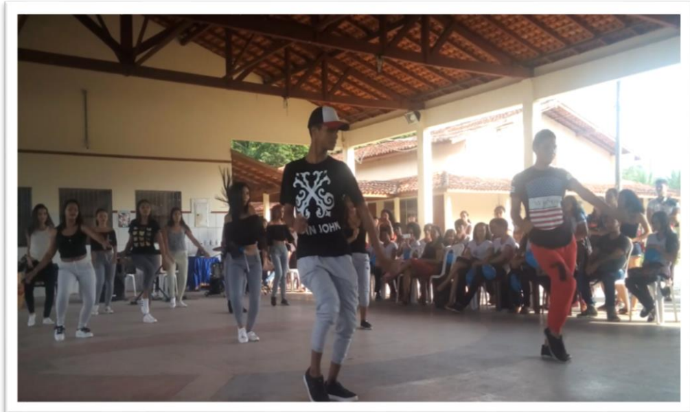
Fotografia 08 – Equipe Fúria

acompanhada de muitos gritos e aplausos; a equipe fúria foi anunciada, seguida por um medley de músicas, incluindo Run the world (girls) de Beyoncé; Entra na roda e ginga de Iza, copa do bumbum de Léo Santana, entre outras. As meninas enfileiraram-se para iniciar as apresentações, e ao começaram a dançar, o público vibrava; quando os dois alunos gays posicionaram-se em frente das meninas, aí que os gritos e aplauso se acentuaram.