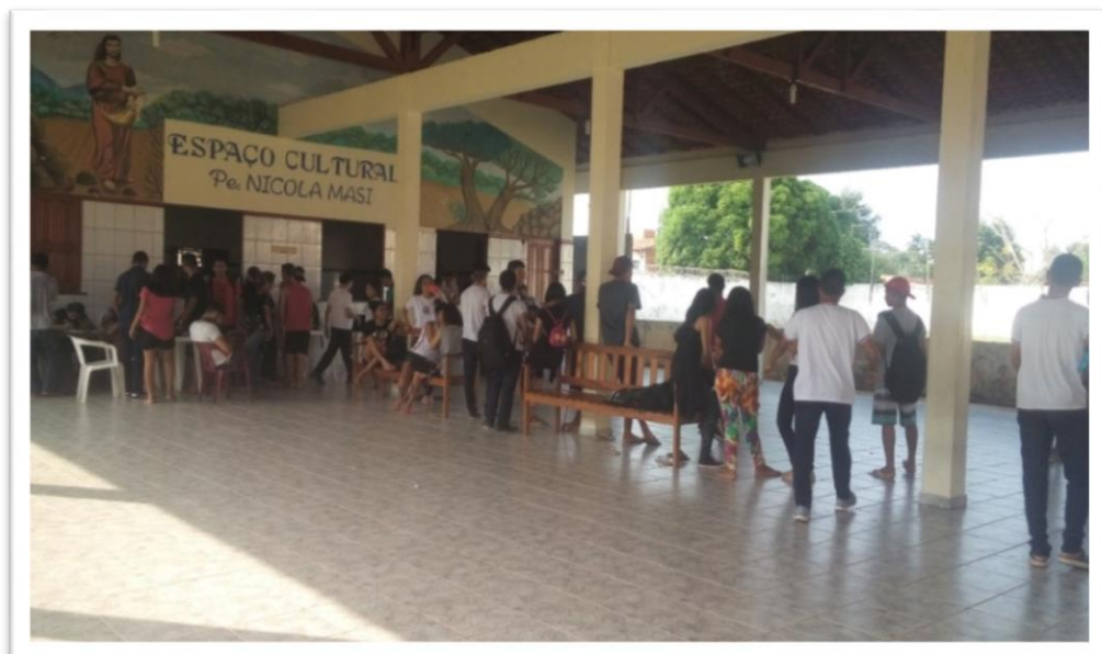
Fotografia 02 – O grande salão

A parte de dentro da instituição contém um grande salão que é como uma via de passagem para todos os outros espaços da escola; neste espaço haviam grupos que se dividiam entre os que estavam nas laterais sentados no chão e outros no centro que ocupavam alguns bancos, algo que me chamou atenção, por isso, meu olhar direcionou-se a esse amplo espaço.