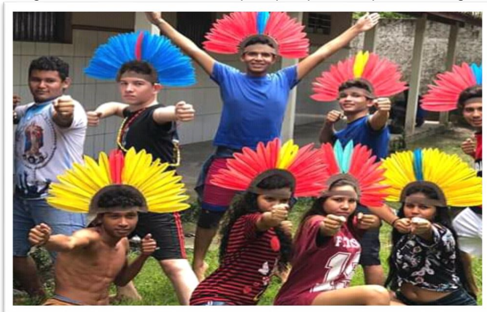
Fotografia 04 - Alunos do educar pela pesquisa em postura indígena

No início o projeto foi pensado somente para o trabalho com teatro e dança, mas com o passar do tempo foi acrescentada a música, a poesia e o artesanato e, hoje, conta com a participação em média de 75 alunos da escola, sendo 44 Moças e 31 rapazes. Os ensaios ocorrem nos turnos matutino e vespertino, oportunizando aos alunos participarem sem interferir os horários de aula já que eles são direcionados a ensaiarem no contra turno ao que estudam. Os ensaios normalmente ocorrem nos dias de terça-feira, quinta-feira e sexta-feira, e cada dia da semana se direciona a atividades específicas.