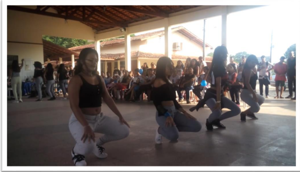
Fotografia 10 – Ousadia das meninas da equipe fúria