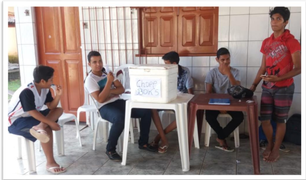
Fotografia 07– Venda do chopp bok's