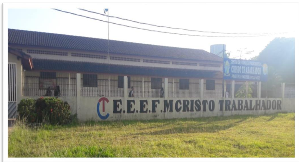
Fotografia 01 – Fachada da Escola Cristo Trabalhador