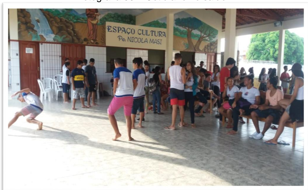
Fotografia 05 – Cotidiano no salão