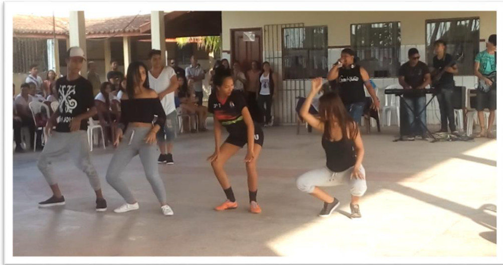
Fotografia 12 - dançando ao som da banda