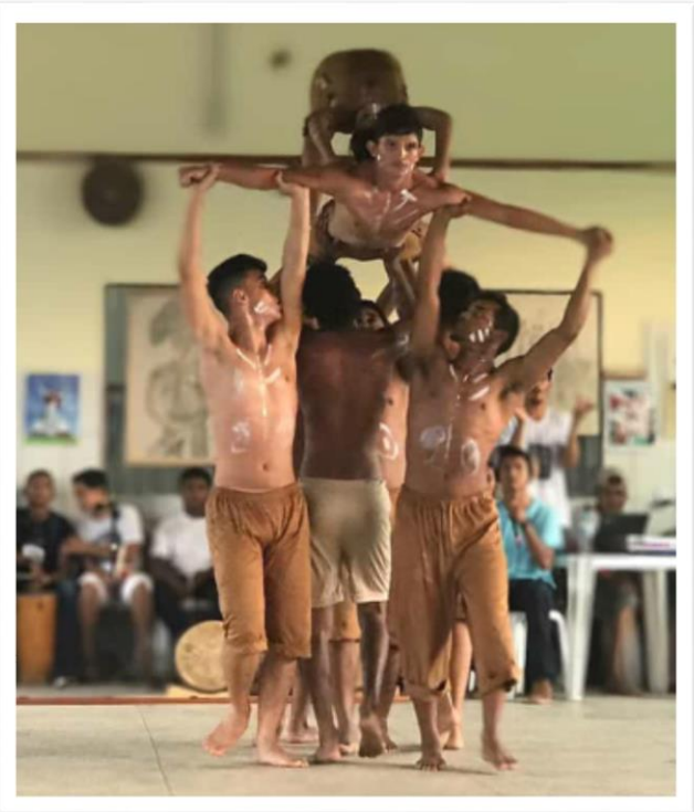
Foto 14 - Guerreiros africanos