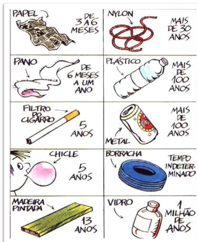
Figura 01 - Tempo de Decomposição de Alguns Materiais Disponível em: http://www.ufrj.br

Do ponto de vista histórico, segundo Dias (2002), o lixo surgiu no dia em que os homens passaram a viver em grupos, fixando-se em determinados lugares e abandonando os hábitos de andar de lugar em lugar à procura de alimentos ou pastoreando rebanhos. A partir daí, processos visando à eliminação do lixo passaram a ser motivo de preocupação, embora as soluções visassem unicamente transferir os resíduos produzidos para locais afastados das aglomerações humanas primitivas.