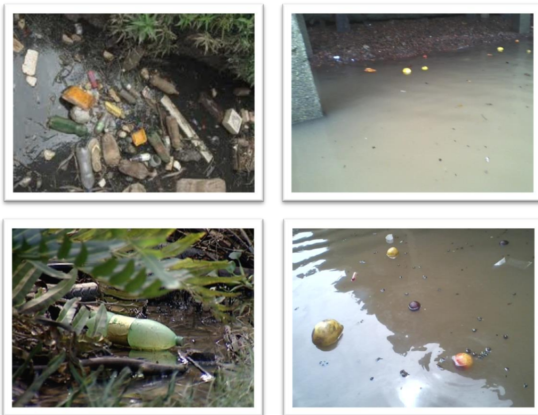
Figura 04 - Lixo Descartado na Frente da Cidade de Abaetetuba (Rio Maratauíra)

De forma genérica, a poluição das águas decorre da adição de substâncias ou de formas de energia que, diretamente ou indiretamente, alteram as características físicas e químicas do corpo d'água de uma maneira tal, que prejudique a utilização das suas águas para usos benéficos. Quanto aos fatores que causam a poluição dividem-se (Santos, 2002): naturais que são aqueles que têm causas nas forças da natureza, como tempestades de areia, queimadas provocadas por raios e as atividades vulcânicas; e artificiais que são aqueles causados pela atividade do homem, como a emissão de gases de automóveis, queima de combustíveis fósseis em geral, materiais radioativos, queimadas, etc.