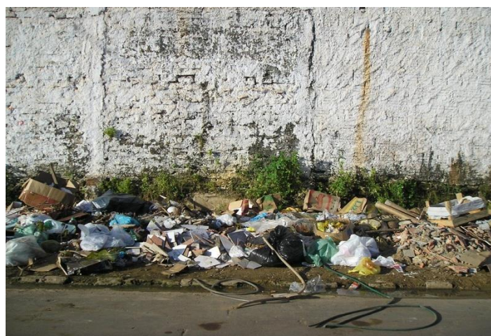
Figura 6: Entulhos depositados em uma esquina.

Os resíduos são acondicionados nas portas das residências, em contêiner colocados em pontos estratégicos ou nas esquinas das ruas. Em alguns bairros da periferia onde o sistema de coleta é deficiente ou em áreas de invasão, os resíduos são deixados em terrenos baldios ou na própria via pública, causando transtornos para os moradores desses locais (figuras 6 e 7 ).