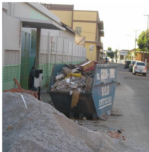
Figura 9: Resíduos da construção civil.