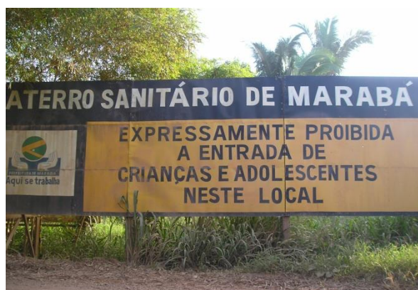
Figura 16: Entrada do aterro sanitário de Marabá.

Durante as visitas realizadas no aterro podem-se perceber que o aterro não possui balança para pesagem do resíduo que chegam, eles são pesados em um posto de gasolina na PA150 a caminho do aterro, na portaria tem um fiscal da SEVOP que regula a entrada de caminhões e de pessoas que vão ao local, no aterro não possui catadores de lixo, apenas os funcionários da secretaria. A estrada que dá acesso ao local é uma estrada de chão cortada pelo igarapé do limão, que dá o nome da vicinal conhecida vicinal do limão (figura 16 e 17).