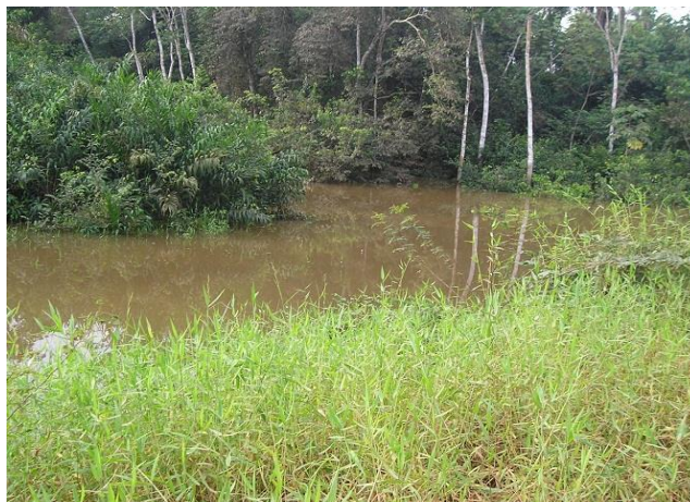
Figura 15: Igarapé do Limão.

na estrada que dá acesso ao local, porque o igarapé limão (figura 15), que é um afluente do rio Itacaiúnas, transborda deixando o aterro parado por cerca de duas semanas.