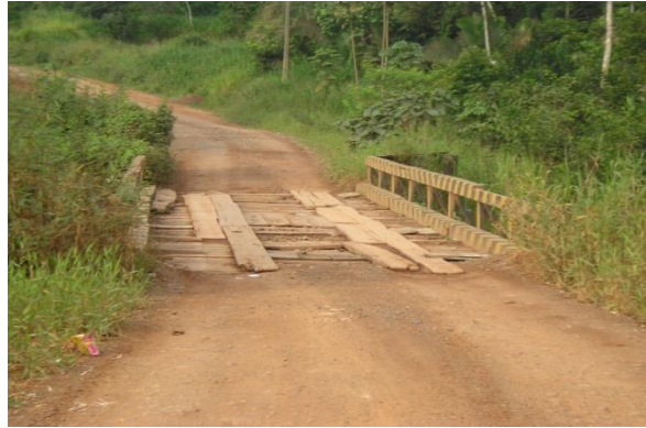
Figura 17: Ponte sobre o igarapé do limão

A aproximação de aves durante a operação de aterros sanitários apresenta-se como um aspecto comum a ser enfrentado, mesmo quando se emprega a pronta e eficiente cobertura dos resíduos dispostos. Na prática, durante o processo de descarga dos resíduos, pode ocorrer a aproximação de urubus, gaivotas, garças e outros pássaros.