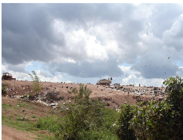
Figura12: Caminhão descarregando rodeado de urubu.

Segundo o prefeito municipal este problema está perto de ser solucionado, no dia 20 de abril de 2010, em uma reunião na câmara municipal de Marabá a empresa Sempre Vivos, contratada pela Fundação Vale, apresentou o “Diagnóstico do Sistema de Limpeza Urbana de Marabá”, realizado em parceria com a PMM, dentro do projeto “Cidade Limpa Vale Saúde” da mineradora Vale. O documento define as diretrizes para o “Plano de Coleta de Resíduos Domiciliares e Mobilização Social de Marabá”, que a partir dessa data deverá ficar pronto em 30 dias.