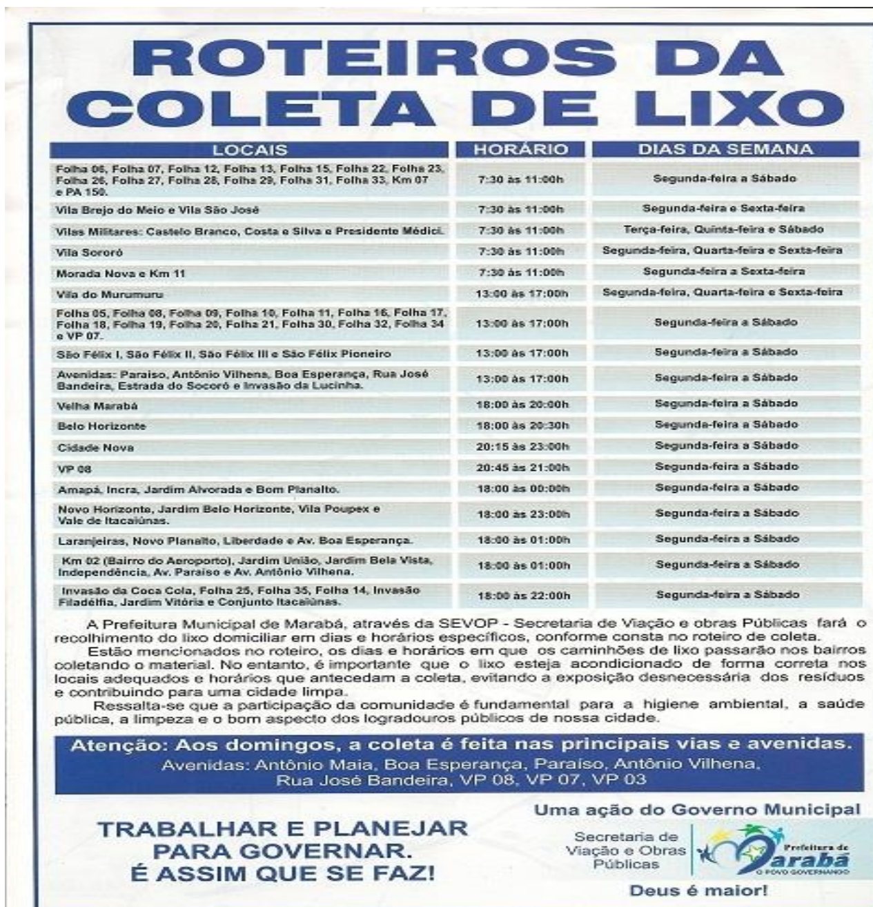
Figura 10: Roteiro de coleta do Município de Marabá.

No final do mês de março de 2010, a coleta de resíduos de Marabá ficou comprometida em virtude do embargo do aterro sanitário pelo Ministério Público Federal em denúncia feita pelo COMAR (Comando Regional da Aeronáutica). O motivo é que o aterro, na localização que está, pode causar problemas para o pouso e decolagem de aviões. A decisão da Justiça Federal se baseia no fato de que o aterro sanitário não pode ficar a menos de 8Km do aeroporto em linha reta, mas o de Marabá está apenas 5,5Km, por isso o aterro