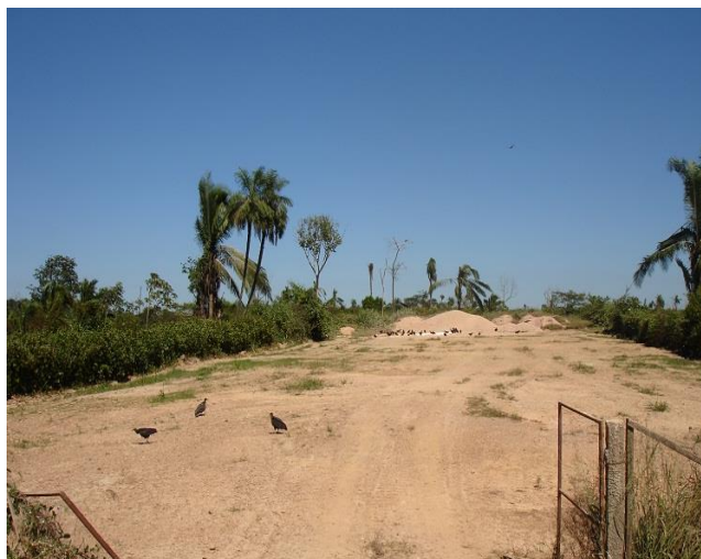
Figura 13: Entrada de acesso a vala séptica usada para os RSS.

Segundo a gestão do aterro, ele recebe por dia 180 toneladas de lixo por dia e cerca de 60 caminhões descarregam dia e noite, onde uma parte é oriunda de empresas particulares e outra da coleta realizada pela SEVOP de resíduos domiciliares, resíduos da construção civil, entulhos, podas e resíduos hospitalares de postos de saúde, laboratórios e hospitais tanto municipal, como particulares, mesmo não sendo de sua responsabilidade esse tipo de coleta, eles realizam em carros coletores especiais, pois a rede particular de saúde ainda não está preparada para dá um destino final aos seus resíduos. Estes quando chegam ao aterro não são compactados e são depositados em valas sépticas impermeabilizada com cal e depois com argila (figura13).