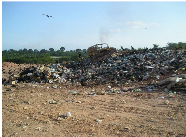
Figura18: Lixo sendo compactado por trator esteira.

Os resíduos quando chegam ao local são depositados nas proximidades da célula, e ficam ali aguardando para serem carregados até a célula para então serem compactados e enterrados (figura 18).