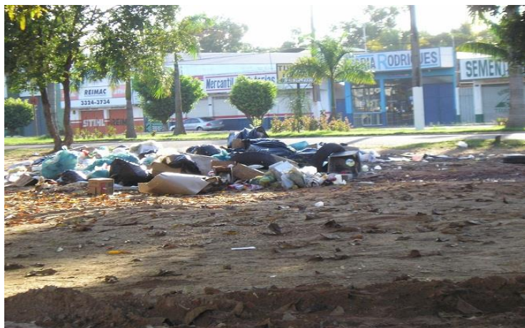
Figura 7: Sacos de lixo depositados em canteiro no trecho urbano da Rod. Transamazônica.

A prefeitura de Marabá através da SEVOP elaborou um roteiro da coleta de lixo com os locais, horários e dias da semana que serão realizadas as coletas nos respectivos bairros da cidade, tentando assim, reduzir a forma incorreta de acondicionamento do lixo, porém não divulgado corretamente para a população (figura 10). A SEVOP também realiza a coleta de resíduos da construção civil, podas e resíduos hospitalares (figura 8 e 9).