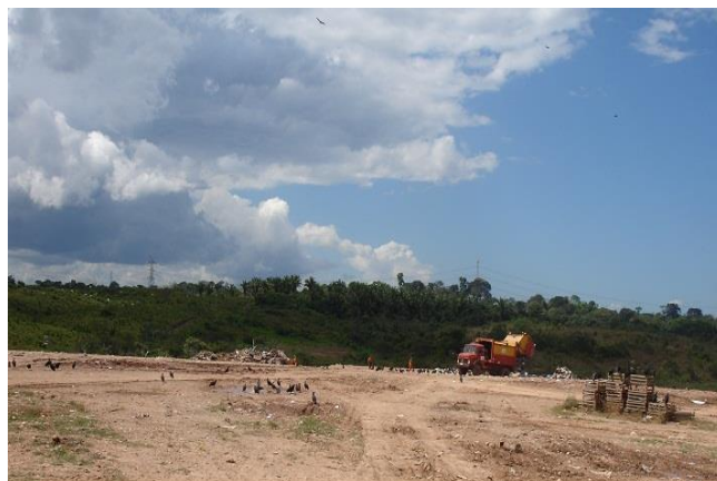
Figura 14: Caminhão da prefeitura descarrega no aterro.

Atualmente o aterro contém quatro células, sendo que três já estão fechadas e uma ainda está sendo utilizada, a argila usada para fechar as células é retirada da própria área. O aterro é considerado controlado e de médio porte, pois segundo a administração ainda falta alguns parâmetros para ele ser considerado como aterro sanitário (figura 14).