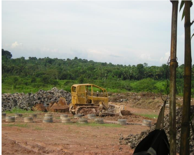
Figura 19: Pneus sendo empilhados no aterro de Marabá.

No aterro não possui sistema de coletor do chorume e nem da água da chuva, também não é realizada a compostagem do lixo orgânico.