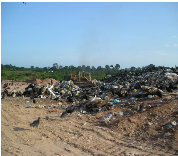
Figura 11: Lixo sendo compactado e grande quantidade de urubus.

precisa ser transferido para outra área. A medida serve para prevenir a concentração de urubus no local, porque a presença dessas aves perto do aeroporto pode causar acidentes (figuras 11 e 12).