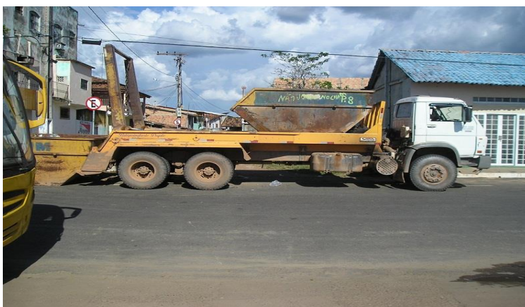
Figura 5: Caminhão coletor poliguindaste duplo.

A coleta de lixo do município é feita pela SEVOP (Secretaria de Obras) de segunda a sábado realizada no período diurno e noturno. No período diurno a coleta conta com sete caminhões coletores compactadores, dois caminhões basculantes de 12m 3 , quatro caminhões poliguindastes duplo (figura 5). A coleta noturna é realizada com seis caminhões coletores compactadores e quatro caminhões poliguindastes duplo.