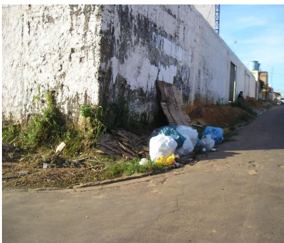
Figura 8: Entulhos depositados na esquina.

A prefeitura de Marabá através da SEVOP elaborou um roteiro da coleta de lixo com os locais, horários e dias da semana que serão realizadas as coletas nos respectivos bairros da cidade, tentando assim, reduzir a forma incorreta de acondicionamento do lixo, porém não divulgado corretamente para a população (figura 10). A SEVOP também realiza a coleta de resíduos da construção civil, podas e resíduos hospitalares (figura 8 e 9).