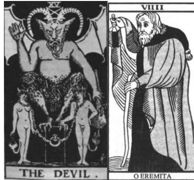
Figura 1 - O Diabo Figura 2 - O Eremita

Fonte: Jung e o tarô: uma jornada arquetípica (Nichols, 2007).