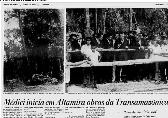
Figura 1 – Matéria no Jornal Brasil – Abertura da Transamazônica

Influenciado pelo período da década de 70, momento este em que ocorreu um forte movimento migratório no Brasil de camponeses para os estados do Pará, Rondônia e Mato Grosso, atraídos pelos projetos públicos de colonização agrícola que ocorria no país.