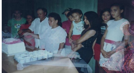
Figuras 5 – Fotografia da família Almeida de Sousa. Casa dos meus pais.2002.