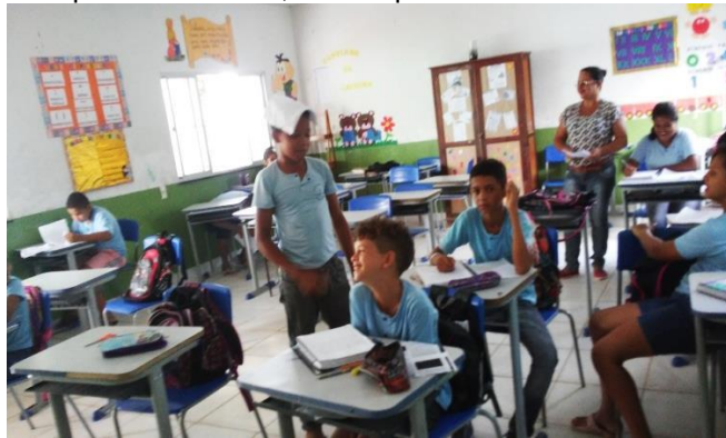
Figura 12 – Fotografia dos alunos do 8ª ano da E.M.E.F. Padre Léo Sheneider, no estágio do IV Tempo Comunidade.

Esses são saberes, segundo Paulo Freire (1999); que vêm das inquietudes e curiosidade intuitiva do saber domesticado, pois essa domesticação pode somente alcançar memorização mecânica do perfil deste ou daquele objeto, mas não o aprendizado real deste objeto. Para este autor, o saber curioso move, inquieta e faz com que o indivíduo seja inserido na busca de novos conhecimentos.