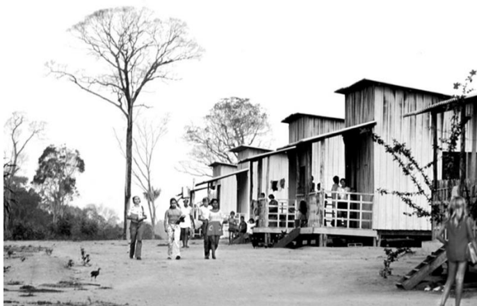
Figura 3 – Fotografia da primeira Agrovila construída na Transamazônica, Km 90, Medicilândia 1