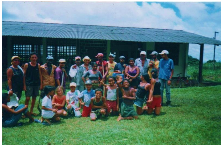
Figura 9 - Fotografia digitalizada - Pais e alunos no mutirão de limpeza da E.M.E.F. Planaltina, vicinal 15. Brasil Novo – PA ano 2001.

Em 2002, eu assumi uma turma de multisséries de 6º e 7º ano no sistema de módulo. Foi um período complicado, porque trabalhar as multisséries com as series fundamentais finais requer do professor conhecimento profundo e domínio do conteúdo a ser ensinado.