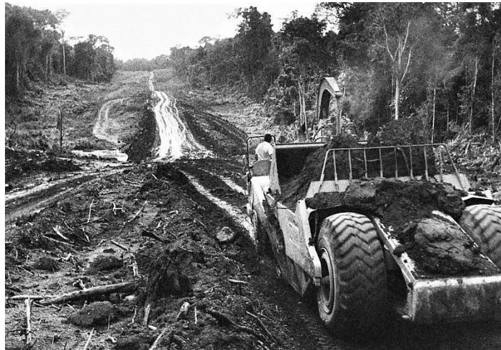
Figura 2 – Fotografia de uma máquina derrubando a floresta na abertura da Rodovia Transamazônica - BR 230.

Com o intuito de obter terras atraídos pela propaganda da época do regime militar, que se instaurou em 1 de abril de 1964, permanecendo até 15 de março de 1985 comandado por governos militares, com caráter autoritário e nacionalista, usando o islogo “Terras sem homens para homens sem terras” ou “Integrar para não entregar” ( acadêmicos: Silva, Storch, Roberto, Danielle, Andreane, Sodré e Oliveira) neste contexto de propagandas, muitas famílias vieram para esta região, sabendo da facilidade em ter acesso à terra e acompanhados pela motivação de uma tentativa de melhores condições de vida. Que era ter uma área maior de terra para a criação de animais e do cultivo de lavouras definitivas que gerassem rendas maiores do que as conquistadas no seu lugar de origem em Linhares ES, porque a terra era muito pequena e não dava para assegurar todos os filhos. Nessa vinda do meu pai e meu avô, eles compraram terras no km 70, no município de Medicilândia. Nesta época se dava a abertura e a colonização da Rodovia Transamazônica.