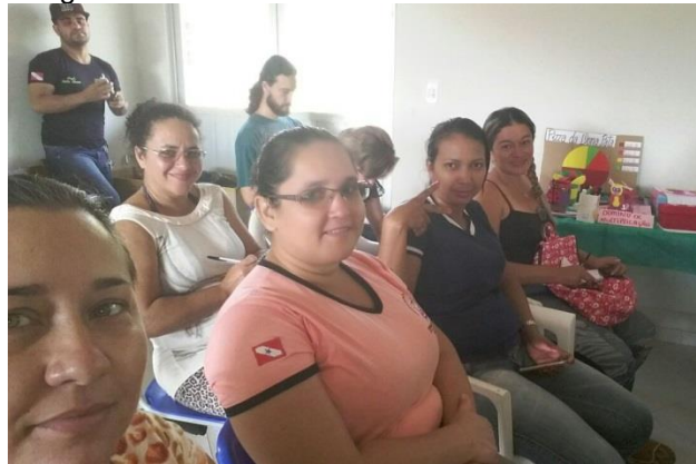
Figura 11 – Fotografia da turma de Brasil Novo do Curso de Educação do Campo: Linguagens e Códigos da UFPA.

Em 2014 fiz o processo seletivo para o curso de licenciatura em Educação do Campo da Faculdade de Etnodiversidade na UFPA, e em 2015 comecei a estudar em Brasil Novo, Linguagens e Códigos do qual tem este memorial por Trabalho de Conclusão de Curso. Esta foi mais uma vez onde eu percebi o grande esforço dos meus filhos, esposo e demais pessoas dos quais me ajudaram. Mas esta também teve reflexo nos meus filhos pois quase não tenho tempo para me dedicar a eles, principalmente nesta fase tão importante da adolescência.