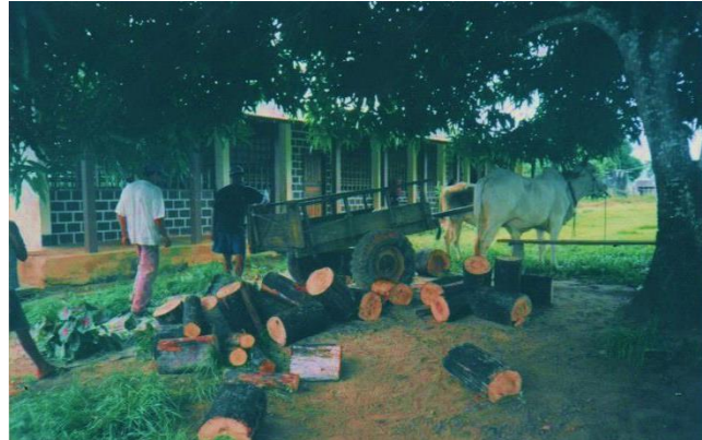
Figura 10 – Fotografia digitalizada - Pais e alunos no mutirão de limpeza da E.M.E.F. Planaltina, vicinal 15. Brasil Novo – PA, ano 2001.