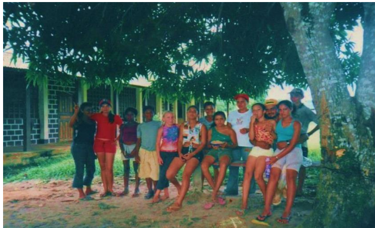
Figura 8 - Fotografia digitalizada - Alunos da E.M.E.F Planaltina, turma do 6ª ano, município de Brasil Novo – PA, ano 2001.

período de 2001 a 2004. Em 2001 eu trabalhei somente com o 6º ano, no sistema de modulo. Foi um ano de muitas experiências pois eu tive que assumir todas as 10 disciplinas do currículo, mais diante das dificuldades esforcei-me bastante para ensinar esses alunos e ganhar credibilidade para dar continuidade nos anos seguintes. E durante este ano, onde tive mais dificuldade foi na disciplina de inglês, porque eu não tive aulas de inglês durante o magistério.