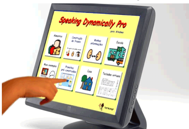
Figura 6 – MONITOR LCD COM TELA DE TOQUE 15 OU 17 POLEGADAS

O MONITOR LCD COM TELA DE TOQUE 15 OU 17 POLEGADAS, é um monitor com tela sensível ao toque. A localização do cursor e o clique acontecerá na área do monitor que for tocada diretamente pelo dedo do usuário ou por uma ponteira emborrachada. Este recurso deve ser utilizado por crianças pequenas, pessoas com limitações físicas ou cognitivas que possuem dificuldade de utilizar o mouse convencional. O acesso por meio do toque de um dedo ou de uma ponteira no monitor permitirá interação direta do usuário com qualquer atividade em seu computador. O monitor com tela de toque tem a vantagem de oferecer uma interação natural. Os usuários podem mover objetos, abrir menus e desenhar ou pintar diretamente. No processo de ensino possibilita o uso do computador com todas as funções que ele oferece.