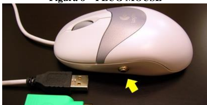
Figura 8 – PLUG MOUSE

PLUG MOUSE é um recurso adaptado com entrada tipo minijaque (apontada pela seta na figura abaixo) para encaixe do plugue tipo P2 de um ou dois acionador(es), simula o clique da(s) tecla(s) do mouse permitindo comandar, através de um ou dois acionadores externos. Deve ser utilizado por pessoas com deficiência motora e que não conseguem utilizar mouse convencional. Exige habilidade de ativar 1 ou 2 acionadores (clique esquerdo e direito do mouse). Utilizado com sistema da varredura. No uso pedagógico esse recurso permite utilizar o acionador para acesso ao computador e produção de escrita em teclados virtuais com varredura.