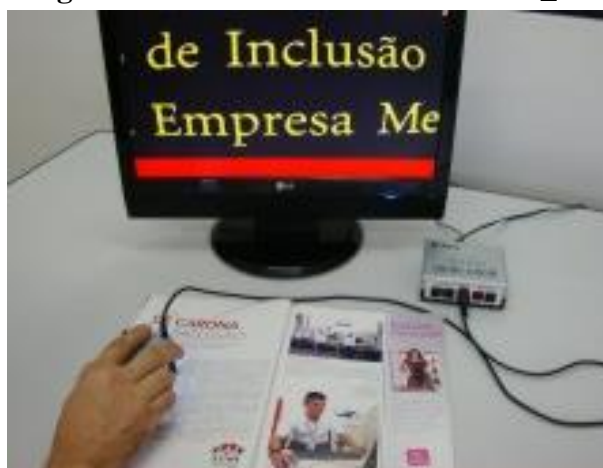
Figura 12 – LUPA MANUAL IMIRA_10