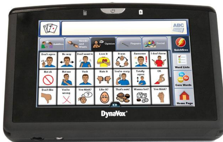
Figura 7 – DYNAVOX – VMAX + EYEMAX