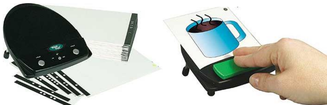
Figura 10 – VOCALIZADOR VOICEPOD