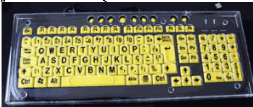
Figura 4 – TECLADO PEQUENO COM ADESIVOS E COLMEIA