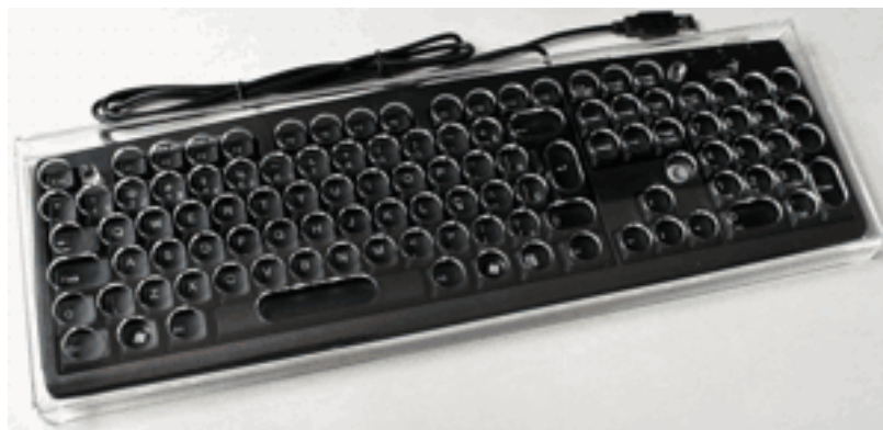
Figura 2 – TECLADO COM COLMEIA