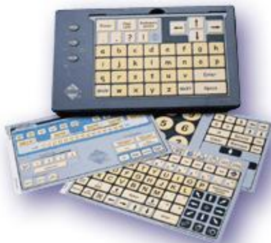
Figura 1 – TECLADO INTELLIKEYS

O TECLADO INTELLIKEYS é expandido com letras grandes e pretas em fundo amarelo. Possui 6 diferentes lâminas que alteram a área de trabalho (teclado, mouse e calculadora). Possui uma lâmina para configuração do teclado. Deve ser utilizado por pessoas com baixa visão, também pode ser ajustado para pessoas com deficiência física (programando o ajuste do teclado de acordo com a deficiência do usuário), permitindo ao mesmo a produção da escrita e melhorando o processo de alfabetização, além de permitir a pesquisa em ambientes virtuais.