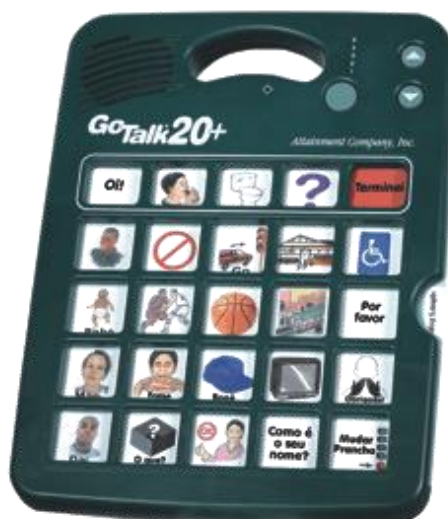
Figura 9 – GOLTALK 20

As pranchas de comunicação alternativa são recursos de TCA para auxiliar alunos com deficiência física que tem dificuldade em usar a fala como meio de comunicação. A comunicação alternativa pode ser realizada por meio de vários recursos de TCA. Pode ser denominada também por Comunicação Suplementar e Alternativa (CSA) 1 :