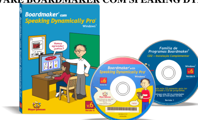
Figura 11 - SOFTWARE BOARDMAKER COM SPEAKING DYNAMICALLY PRO

SOFTWARE BOARDMAKER COM SPEAKING DYNAMICALLY PRO, é um software para construção de pranchas de comunicação alternativa e recursos educacionais acessíveis. Contém a biblioteca dos símbolos gráficos PCS com mais de 4.500 imagens. Possui uma grande variedade de atividades exemplos e teclados virtuais. Deverá ser utilizado por pessoas com as mais diferentes características cognitivas, sensoriais e motoras. Apresenta ferramentas para a construção de pranchas de comunicação personalizadas e interligadas. O recurso de escrita com símbolos e, os símbolos que associam imagem e escrita servirão consideravelmente para os processos de alfabetização de alunos com deficiência intelectual, surdez, dificuldades de comunicação oral e também para crianças sem deficiência. Pedagogicamente este recurso permite a comunicação ilimitada por meio de pranchas interligadas e teclados virtuais. Favorece alfabetização e produção escrita. Possibilita a construção de textos com símbolos. Permite a construção de atividades educativas acessíveis para qualquer disciplina ou nível de ensino.