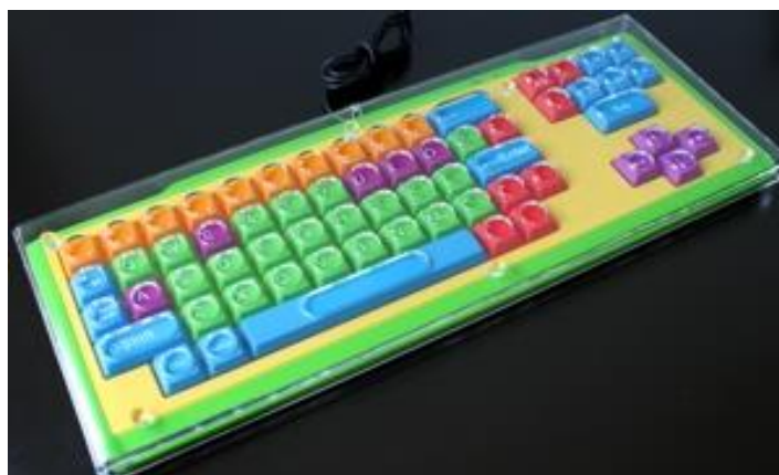
Figura 3 – TECLADO EXPANDIDO COM TECLAS GRANDES E COLORIDAS

O TECLADO EXPANDIDO COM TECLAS GRANDES E COLORIDAS que facilitam a rápida localização e digitação dos caracteres. As cores definem diferentes categorias de teclas como vogais, consoantes, números, pontuação e comandos pelo teclado, podendo ser utilizado por crianças pequenas; pessoas com dificuldades motoras, visuais e/ou cognitivas. No processo de aprendizagem deve viabilizar a produção de escrita e acesso à ambientes virtuais, além de auxiliar no processo de alfabetização.