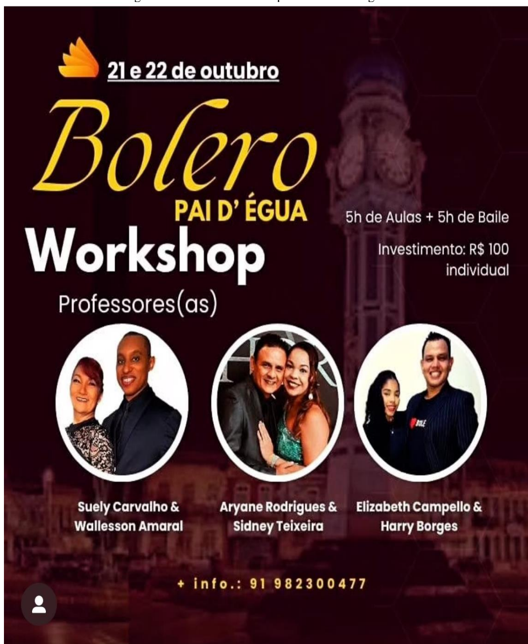
Figura 4: Cartaz do Workshop Bolero Pai D'Égua