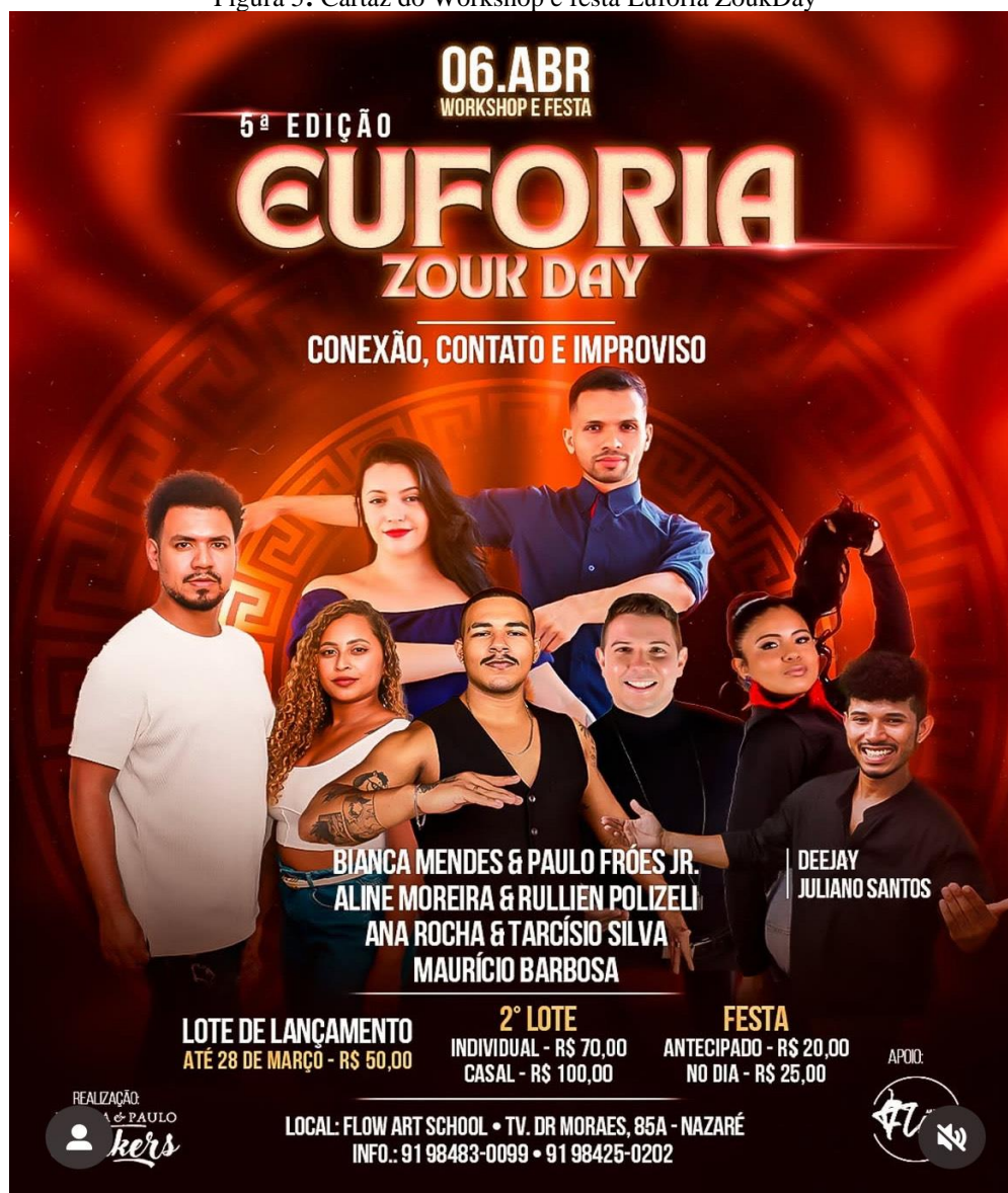
Figura 5: Cartaz do Workshop e festa Euforia ZoukDay