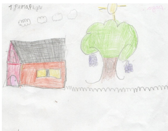
Desenho 02 - O espaço favorito para brincar

Fonte: Pesquisa de campo, 2020. Autor: Vinícius