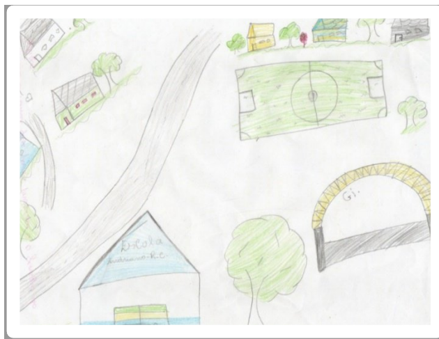
Desenho 1- O lugar.