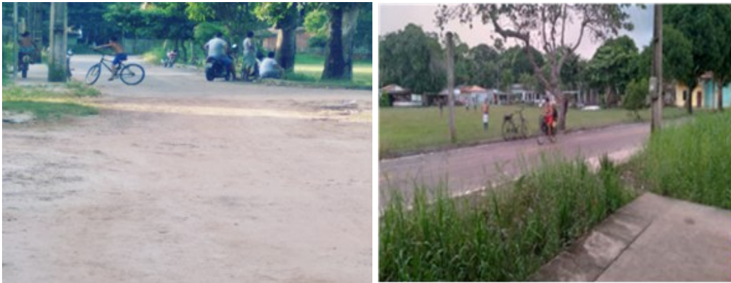
Fotos 9 e 10 - Crianças andando de bicicleta

momento, outras se sentam na beirada do campo para observar os adultos jogando, outras andam de bicicletas.