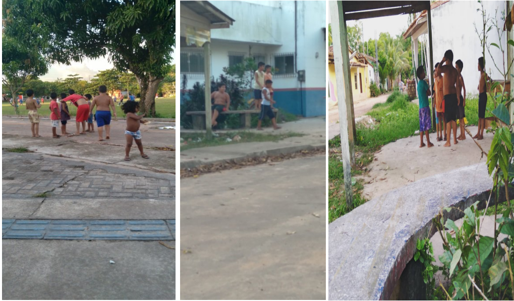
Foto 14, 15 e 16 - Momentos de interação das crianças.