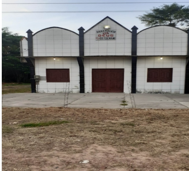
Foto 12 - Igreja Evangélica, Assembleia de Deus