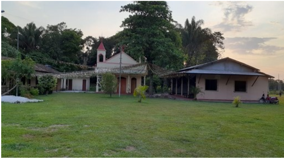
Foto 11 - Centro comunitário São Miguel Arcanjo