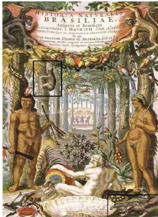
Figura 3 - PISO, W. e MARCGRAVE, G. Historia Naturalis Brasiliae . Leiden: Franciscus Hack. Amsterdam, Ludovicus Elzevier, 1648