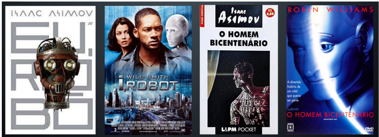
Figura 4 - “Famosas obras de Isaac Asimov”