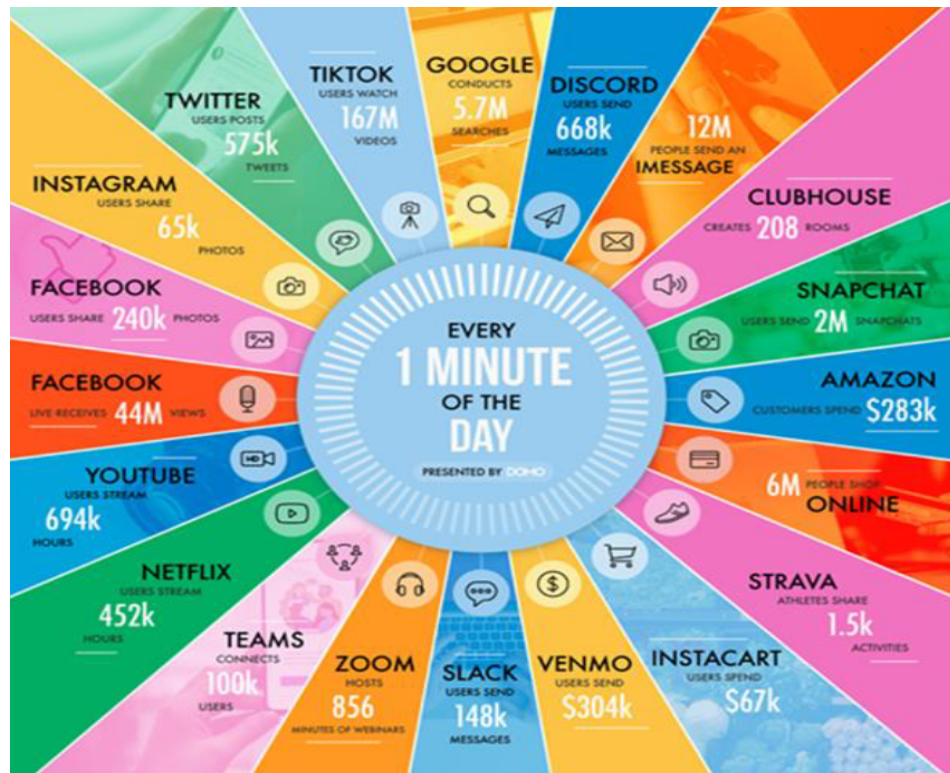
Figura 1 - “Contagem de dados por minuto”