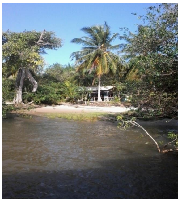
Figura 14. Imagem da vista panorâmica da chegada à Comunidade do Poção.

Segundo Britto e Silveira(2013, p. 839), a comunidade do Poção está situada no “extremo Leste da Ilha de Cotijuba, entre a comunidade de Pedra Branca e o Parque Seringal”, assim como a comunidade Fazendinha. Quando se chega direto pela praia do Poção, a vista que se tem é muito bonita, como é possível ver na imagem seguinte (Figura 14)