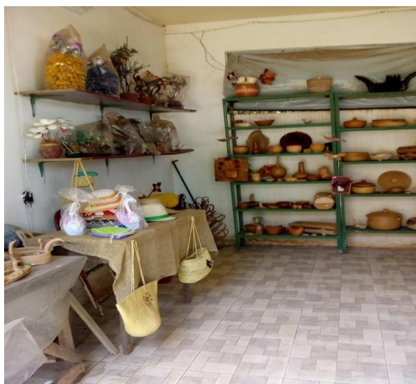
Figura 10. Imagem de peças de cerâmica

Entretanto o uso desse espaço por D. Antônia para expor a sua produção artesanal para possível venda,(Figuras 10 e 11) proporcionou um impulso à seus negócios e lhe assegurou a possibilidade de obtenção de renda.