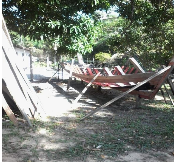
Figura 16. Imagem da produção artesanal de embarcação