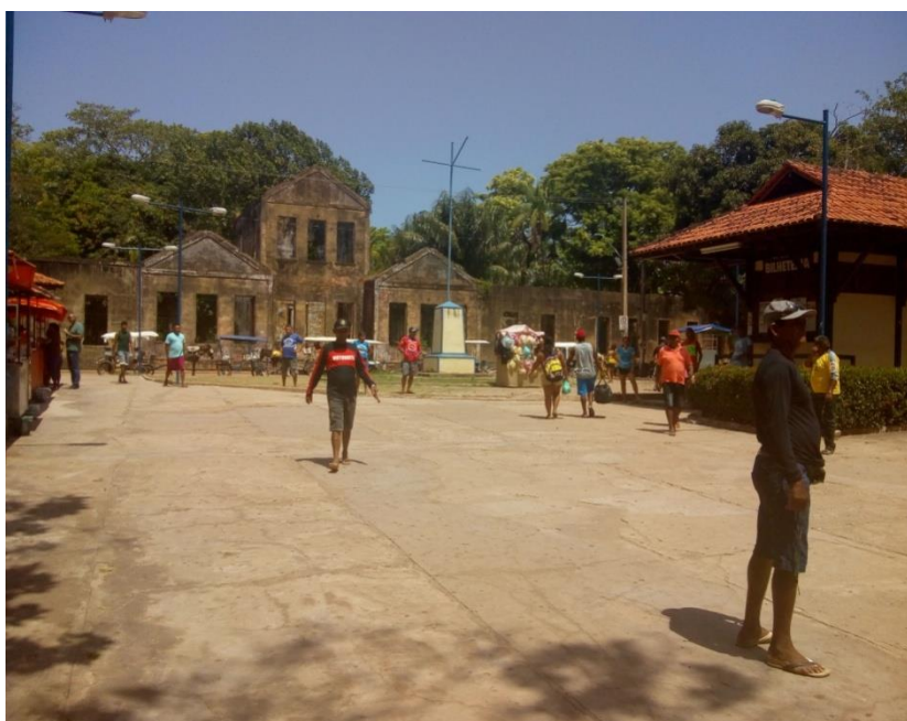
Figura 5. Imagem do antigo educandário e colônia penal.

O educandário foi inaugurado em 1933. Porém, em 1968 foi construída uma penitenciária na ilha e, por algum tempo, o educandário e o presídio coexistiram. O educandário foi extinto e a ilha se transformou em uma ilha-presídio até 1977, quando a Colônia Penal de Cotijuba foi destituída (BRITTO, SILVEIRA, 2014, p. 838)