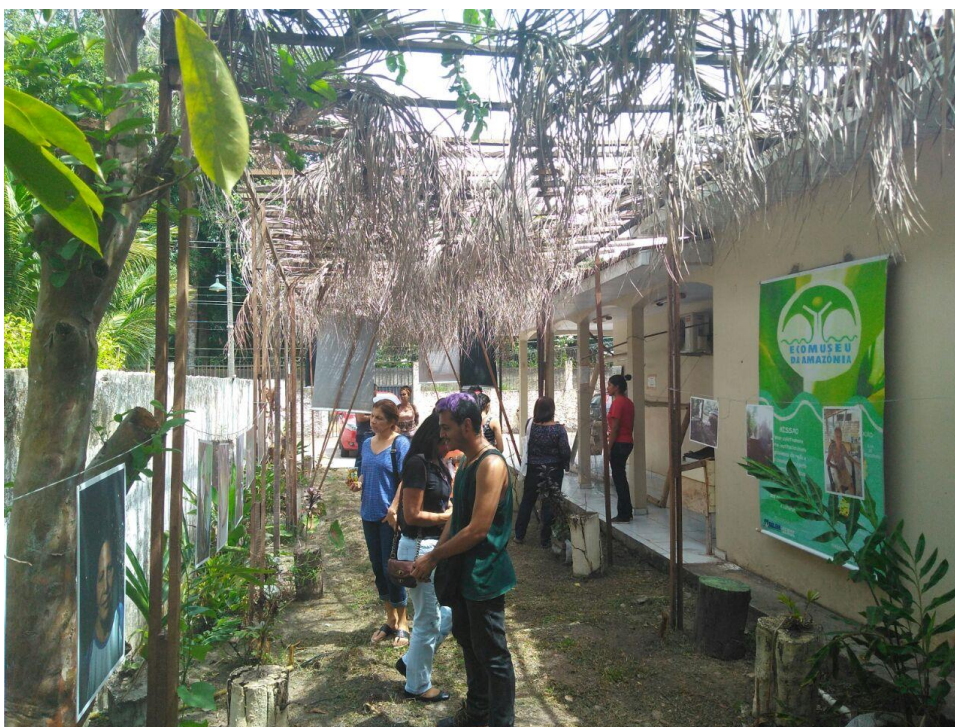
Figura 1. Imagem da sede síntese do Ecomuseu da Amazônia

Pois o Ecomuseu da Amazônia se apresenta como uma instituição museal que se dispõe a trabalhar, em parceria com as comunidades presentes em seu campo de atuação, a valorização de suas referências patrimoniais e culturais.