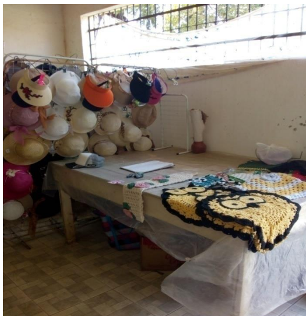
Figura 11. Imagem de peças confeccionadas em palha e tapeçaria