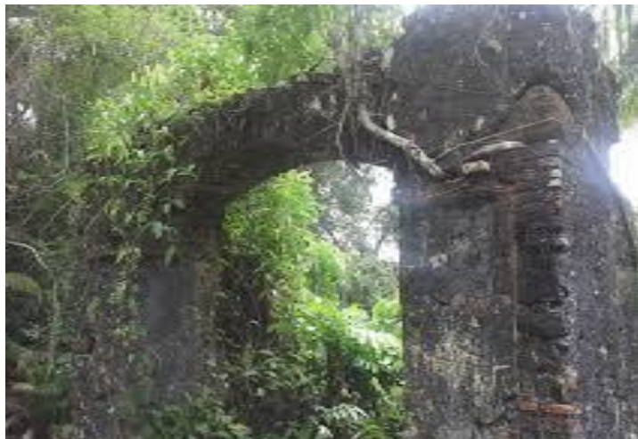
Figura 15. Imagem das ruínas do antigo engenho conhecido como Fazendinha