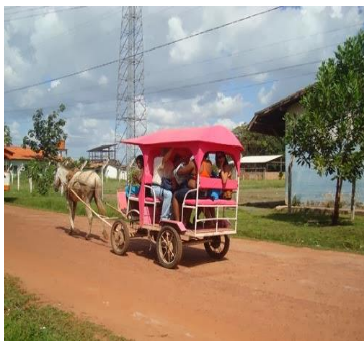
Figura 20. Charrete.