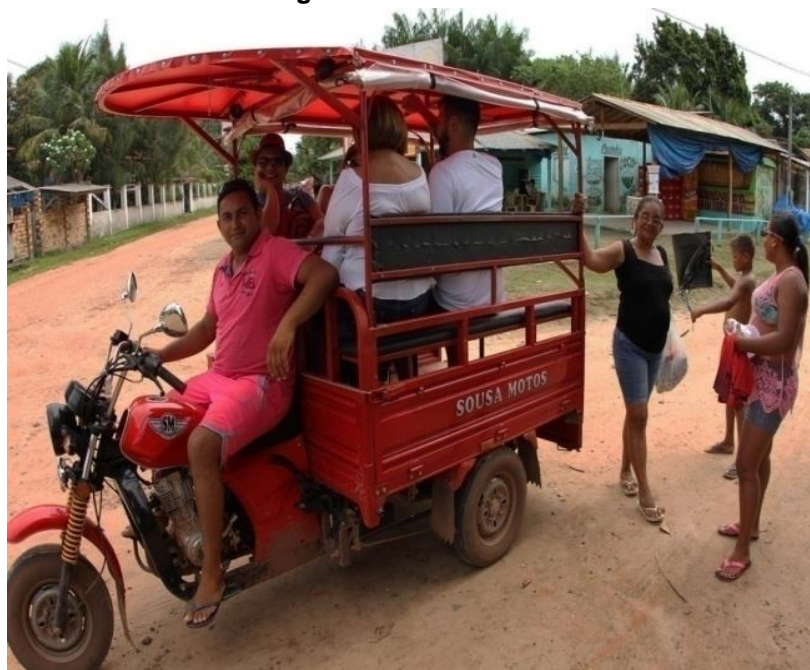
Figura 19. Motorrete.