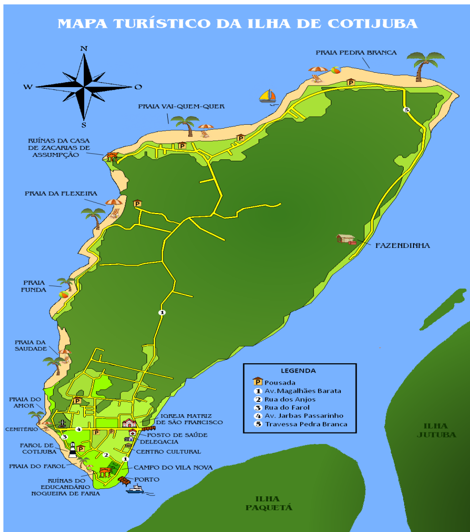
Figura 8. Mapa turístico ilustrativo da ilha de cotijuba e de suas principais praias.

O mapa a seguir (Figura 8), destaca a localização das principais praias existentes em Cotijuba, e Segundo Renan são “coisas da Natureza” que devem ser preservadas