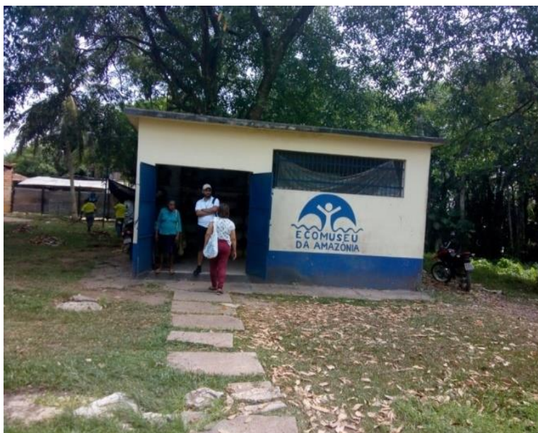
Figura 9. Posto de referência do Ecomuseu da Amazônia em Cotijuba

Considerando-se que a Ilha de Cotijuba que é composta aproximadamente por 12 praias (Figura 8), as bases de atuação do Ecomuseu da Amazônia na Ilha de Cotijuba se restringem às comunidades do Poção e Faveira. Na comunidade da Faveira, principal porto de embarque e desembarque, o Ecomuseu possui um posto de referência (Figura 9), uma pequena construção que está localizada a direita quando se chega à ilha, próximo ao trapiche do porto de embarque e desembarque.