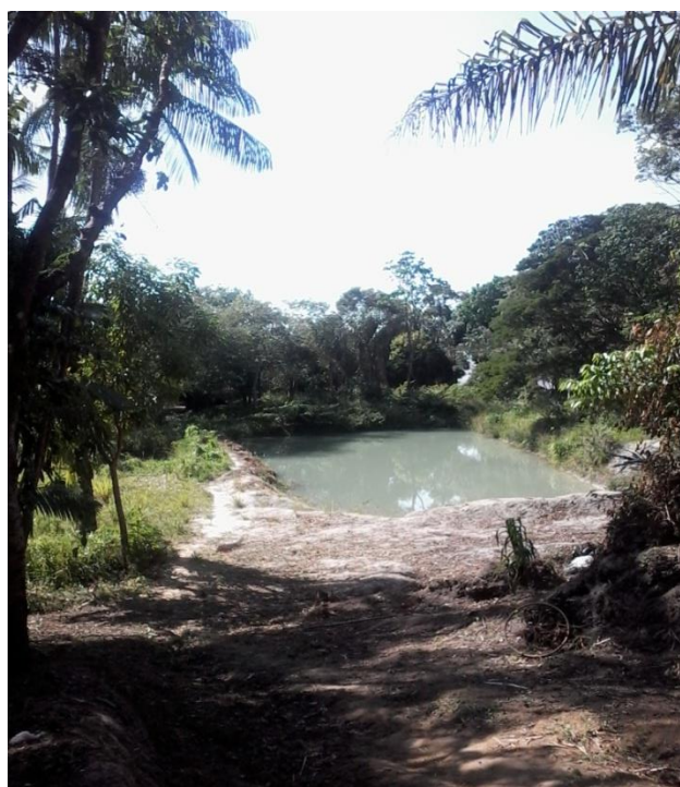
Figura 18. Tanque de Criação de peixes.