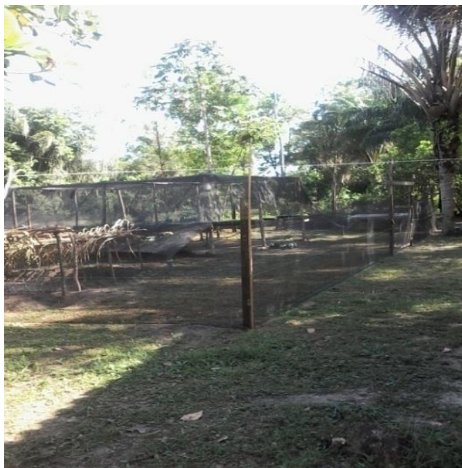
Figura 17. imagem do viveiro de mudas