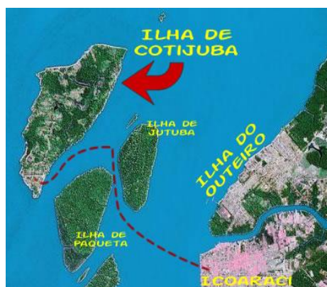
Figura 3. Mapa ilustrativo da localização da Ilha de Cotijuba.

O território municipal de Belém é composto por 43 ilhas, esse quantitativo de área insular equivale a 2/3 de sua área total (GUERRA, 2015), e corresponde a 332.0367km 2 , obedecendo a seguinte distribuição físico-espacial: Ilhas do Norte área composta por 15 ilhas; Ilhas do Centro Leste, área composta por 3 ilhas; Ilhas do Extremo Oeste, área composta por 17 ilhas; e Ilhas do Sul, cuja área é composta por 8 ilhas (MELO, 2008). Na Figura 3, um fragmento de representação da Belém insular.