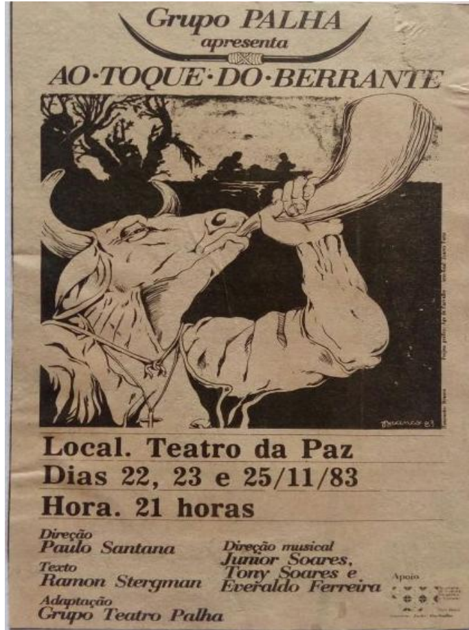
Imagem 06. Cartaz ao Toque do Berrante - Divulgação no Jornal a Província do Pará 12 .