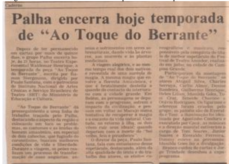
Imagem 05 - Encerramento da temporada "Ao toque do Berrante".