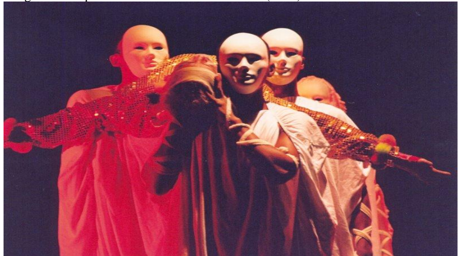
Imagem 17. Espetáculo A Mercadora De Almas (2006).