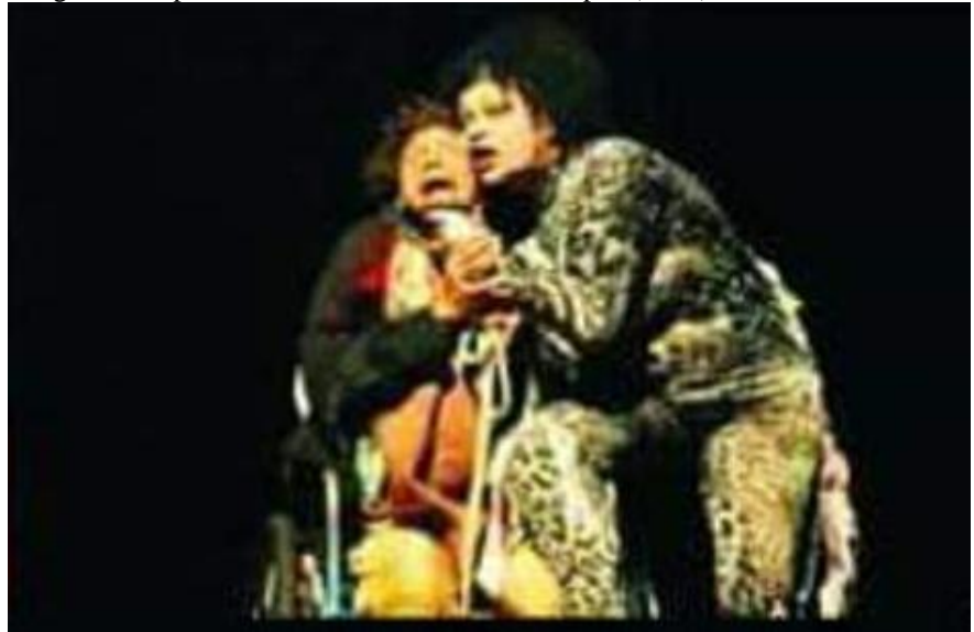
Imagem 21. Epheméris – A Moralidade dos Tempos (2012).