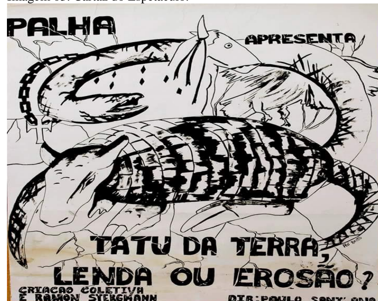
Imagem 03. Cartaz do Espetáculo.

O texto jornalístico acima fala de uma apresentação do espetáculo Tatu da Terra feita em Manaus. Apresenta de forma geral o trabalho, além do grupo Palha e do elenco da peça. Abaixo têm-se o cartaz e o certificado da censura proibindo a apresentação da obra por expor atores nus em cena.