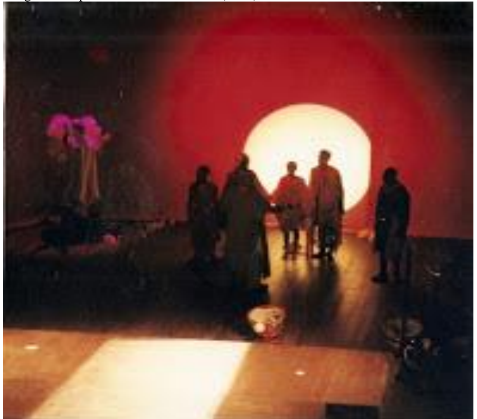
Imagem 2. Espetáculo Cristos da Terra (2000).