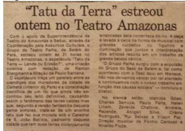
Imagem 02. Estreia de Tatu da Terra no Teatro Amazonas.

O espetáculo Tatu da Terra, lenda ou erosão (1982) girava em torno de uma lenda, a de que um grande tatu que fuça a terra de Cametá, fazendo com que rio, ao penetrar nos buracos, vá levando parte dessas terras. Além de mostrar a explicação lendária para o grave problema da erosão, o grupo Palha mostra no espetáculo cenas dos aspectos da cultura regional, abordando seriamente um problema de ordem econômica e social. A criação foi coletiva com o texto final de Ramon Stergman. A primeira apresentação se deu no próprio município de Cametá. Na reportagem abaixo se fala da estreia do espetáculo no Teatro Amazonas, percebe-se também que ao mesmo tempo a reportagem e um desabafo quanto à expulsão do grupo das dependências do SESC. Daí se deu a criação do grupo de teatro Palha como forma de resistência. Na dissertação do professor Paulo Santana, ele fala que não foi a expulsão do grupo, mas uma censura à montagem do espetáculo “Jurupari, a Guerra dos sexos” já que os atores ficariam seminus no palco.