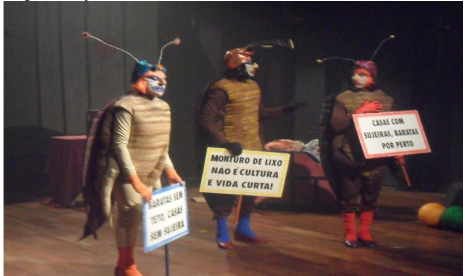
Imagem 19. Espetáculo Três baratas tontas.