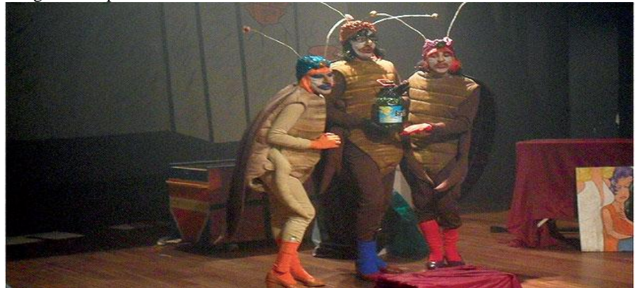
Imagem 4. Espetáculo três baratas tontas 2008.