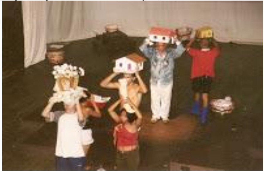
Imagem 3. Espetáculo Efemérides de Andrógino (2001).