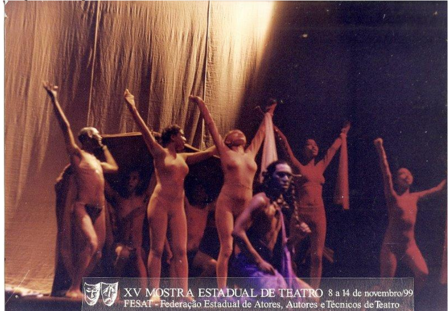
Imagem 12. Espetáculo Arcano do Senhor.