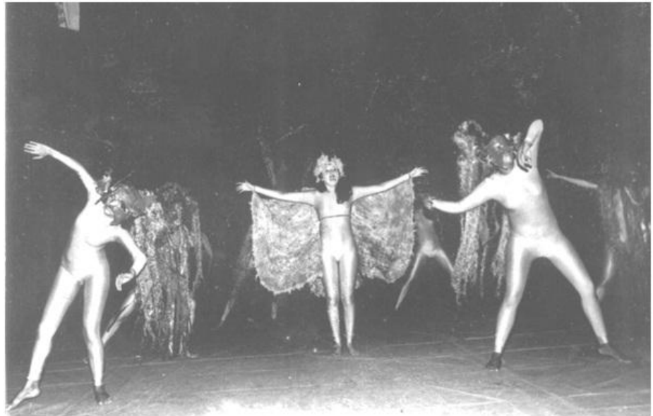
Imagem 08. Cena do ao Toque do Berrante.