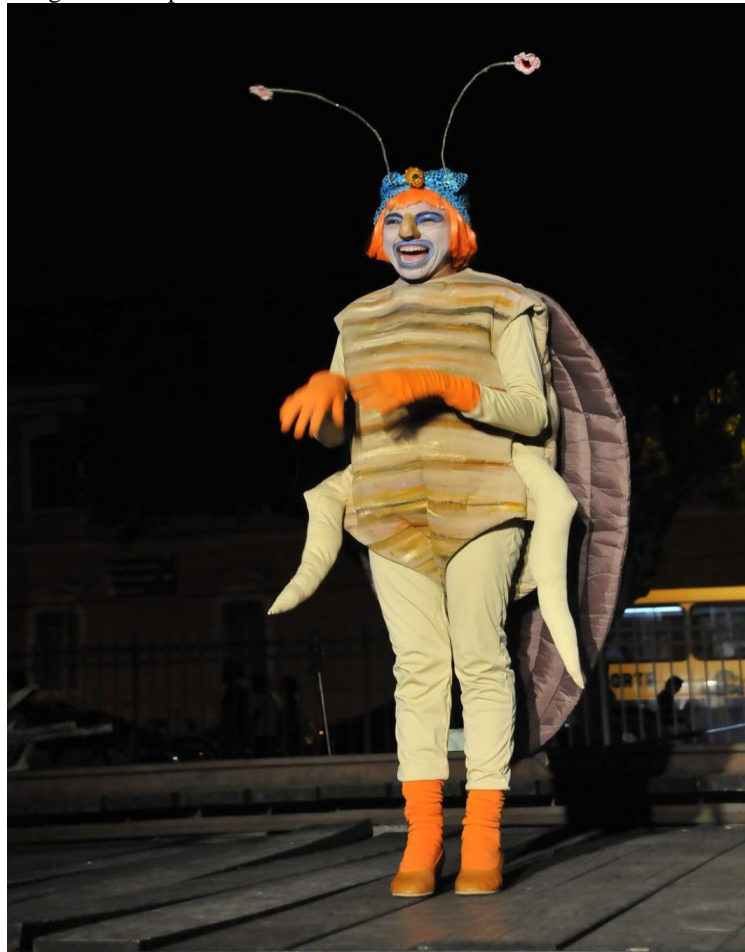
Imagem 20. Espetáculo três baratas tontas 2008.