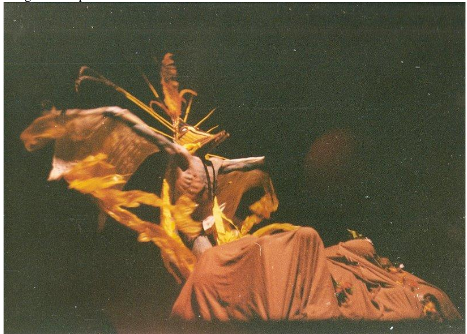
Imagem 1. Espetáculo Arcano do Senhor.