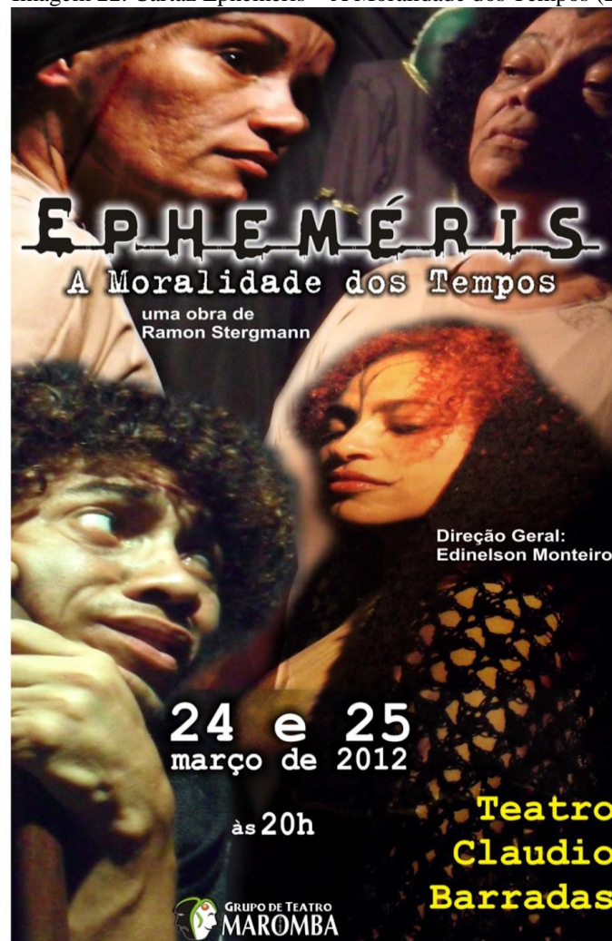
Imagem 22. Cartaz Epheméris – A Moralidade dos Tempos (2012).