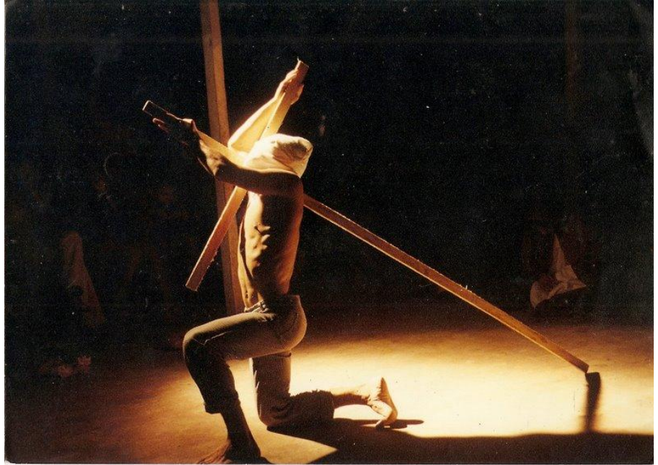
Imagem 14. Espetáculo Cristos da Terra. 2000.