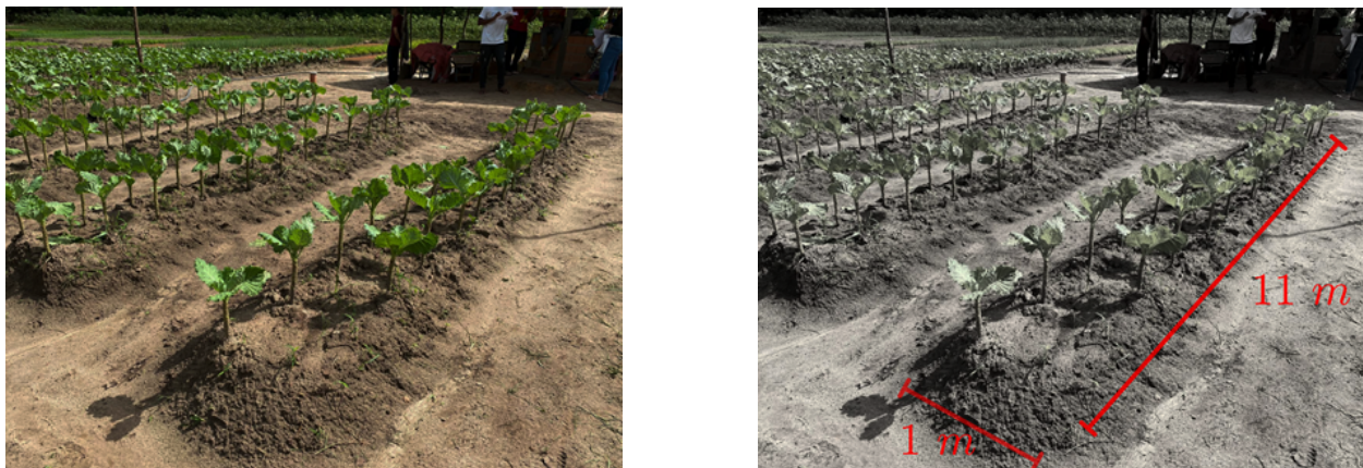
Imagem 3.5: Representação das medidas de comprimento e largura

da largura. Isso ajudará a entender a quantidade de espaço disponível para o cultivo das hortaliças. Na análise feita (Imagem 3.5), foi apresentada a visão ética na perspectiva do modelador, trazendo o modelo da montagem da leira.