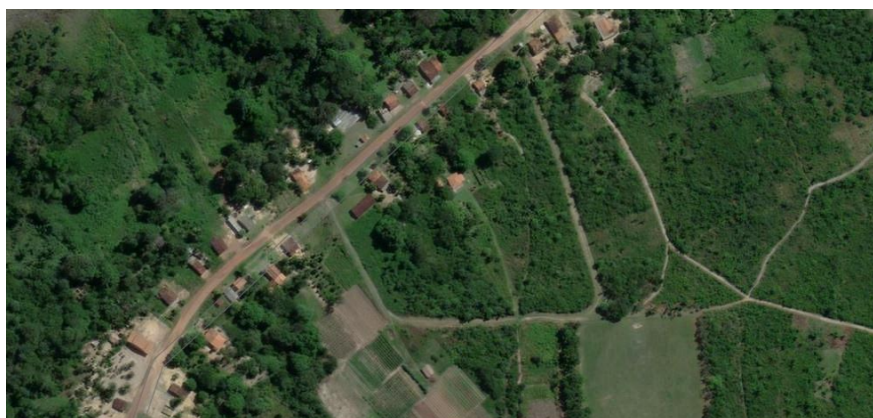
Imagem 2.1: Mapa da região de Tamaquara