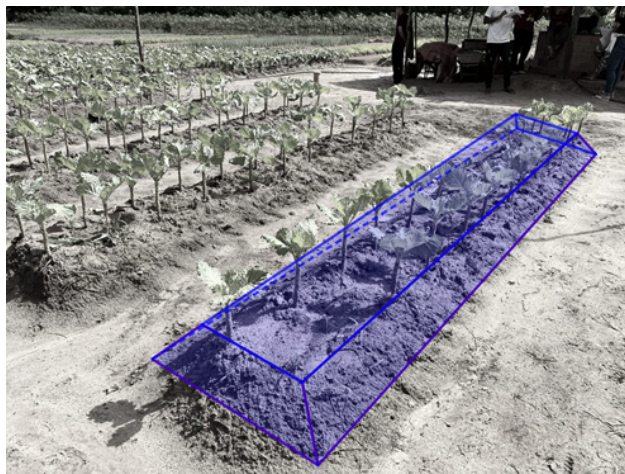
Imagem 3.6: Representação da leira no modelo em que se reconhece a figura do prisma com face trapezoidal

Ao explorar as características do prisma, é possível aprender a calcular a quantidade de insumos para aquela área, aplicar esse conhecimento em situações práticas, como calcular a área de um terreno ou de uma superfície em um projeto de arquitetura.