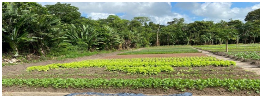
Imagem 3.4: Mudanças dos pés de couve com mais ou menos 24 dias