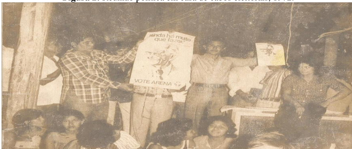
Figura 2: Reunião política em casa de cabos eleitorais, 1972.

A campanha do ARENA I na eleição de 1971, tinha em sua articulação um comício que era organizado com antecedência onde geralmente levavam uma banda musical para o local do comício em grandes embarcações junto da comitiva política do Grupo, e depois das falas dos candidatos acontecia uma festança ao som de determinada banda que ia até o amanhecer. No local eram distribuídas comida e bebida, uma estrutura boa para deixar seus eleitores felizes, para que mais tarde essa felicidade fosse refletida em votos.