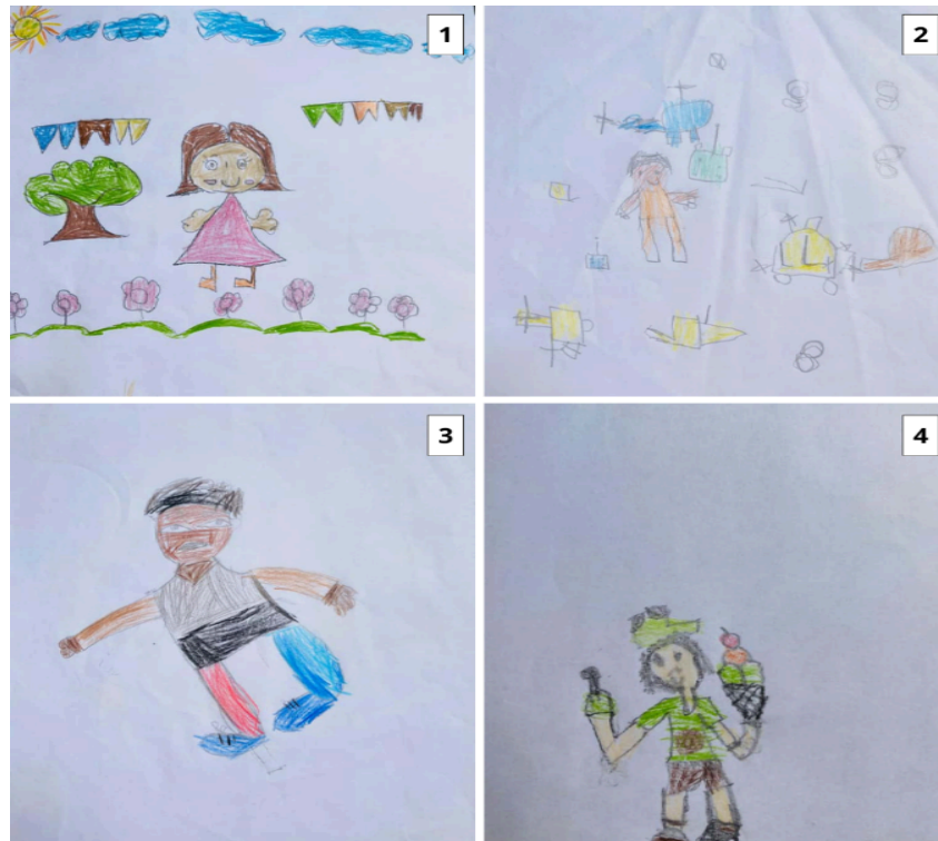
Figura 2: mosaico com desenhos produzidos pelas crianças negras.