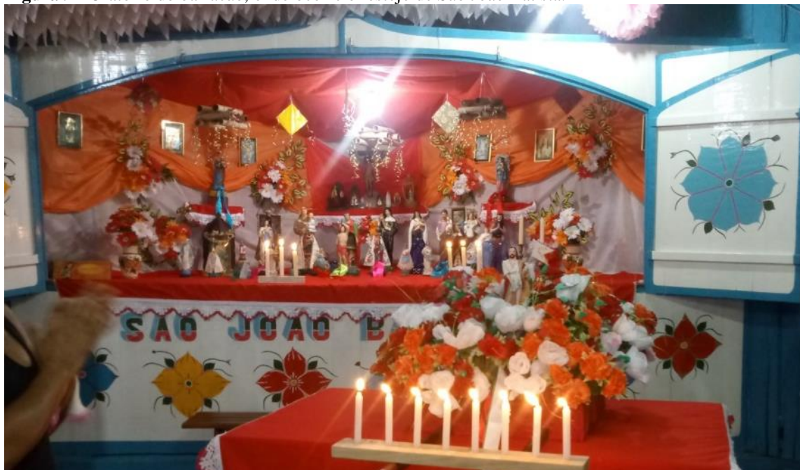
Figura 9 - Oratório do barracão, onde ocorre o festejo de São João Batista.

Fonte: Nezilú Gonçalves Santos, 13 de junho de 2018, acervo pessoal.