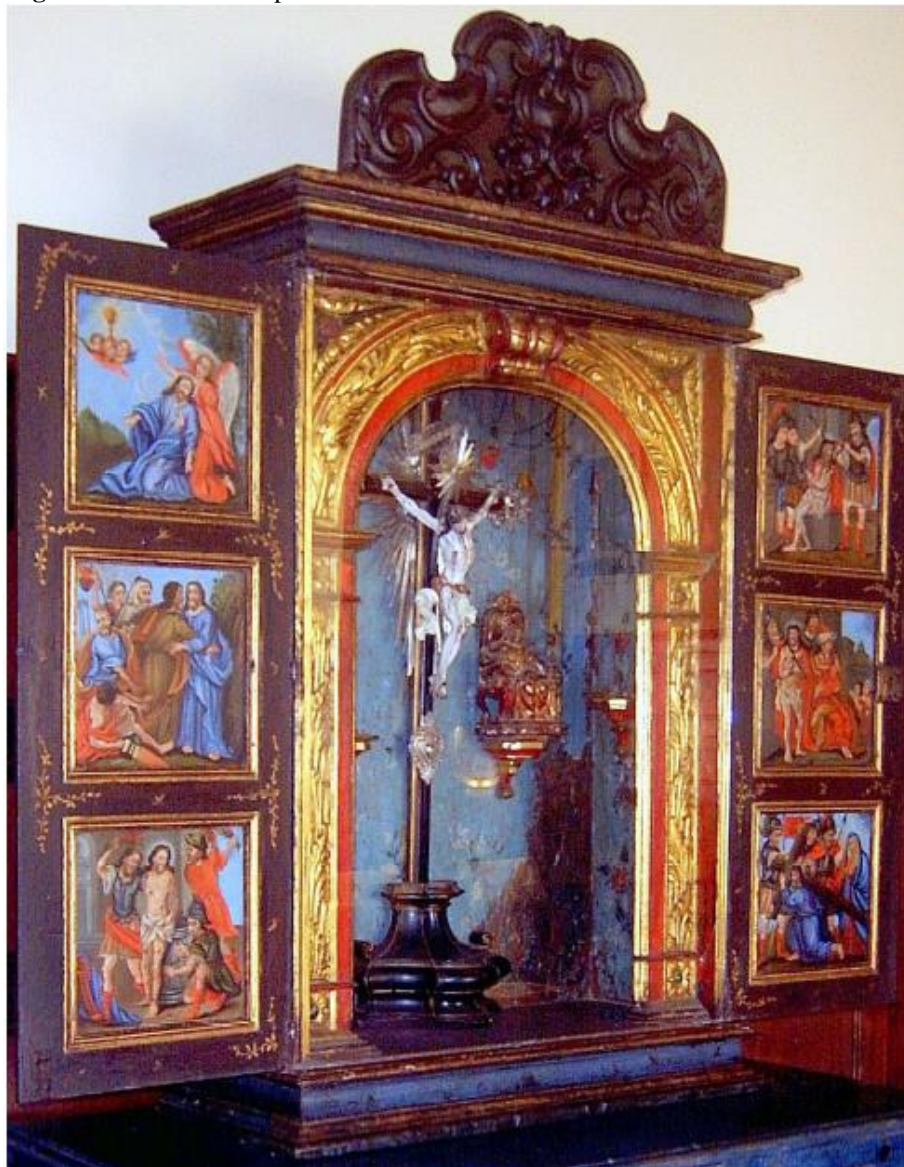
Figura 2 - Oratório sem pedra d'ara