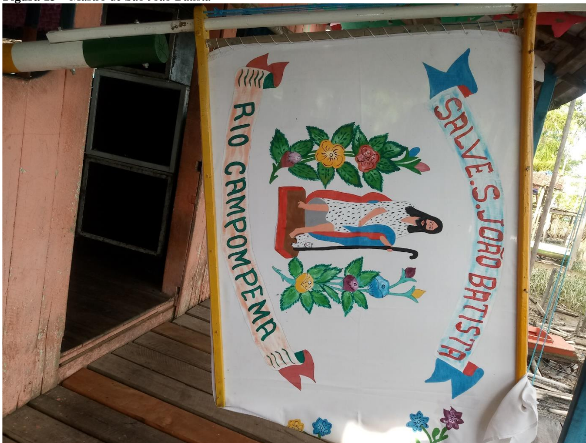
Figura 13 – Mastro de São João Batista