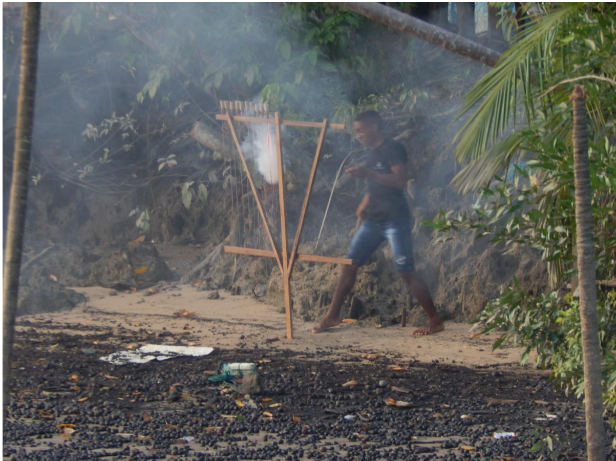
Figura 1, 2, 3, 4, 5 e 6 – imagens registradas no Círio de São João Batista, acervo pessoal.

Fonte: Antonio Grazianne, 13 de jun. de 2018.