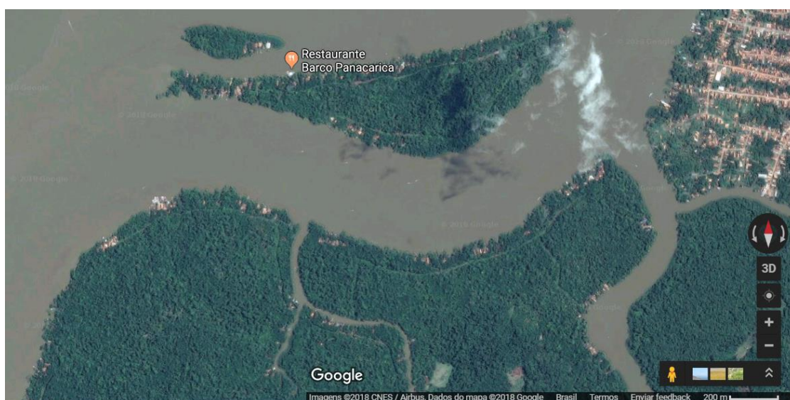
Figura 5 - Localização do rio Campompema