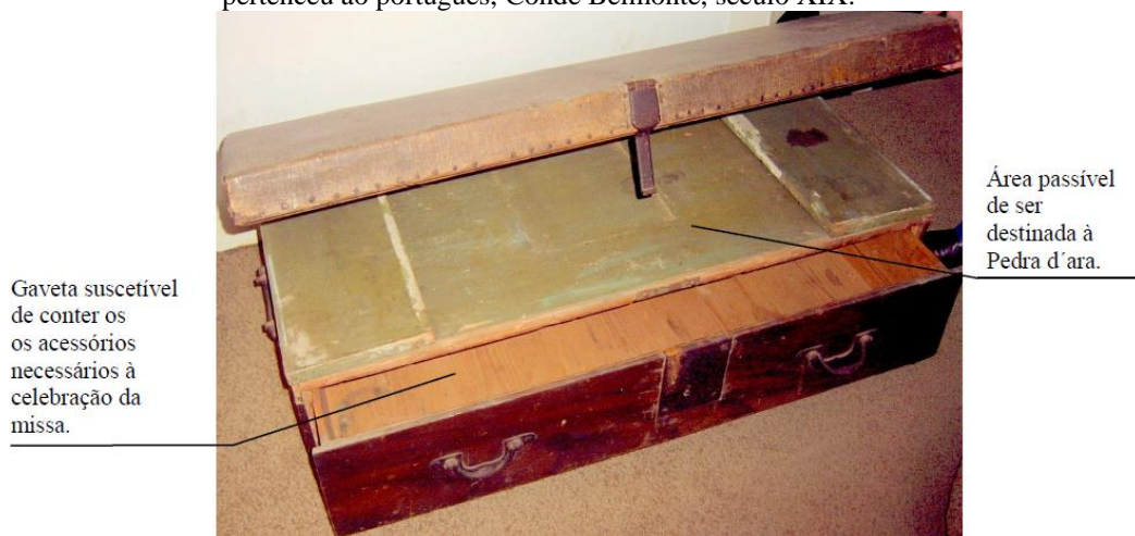
Figura 1- Oratório portátil com função de altar que pertenceu ao português, Conde Belmonte, século XIX.