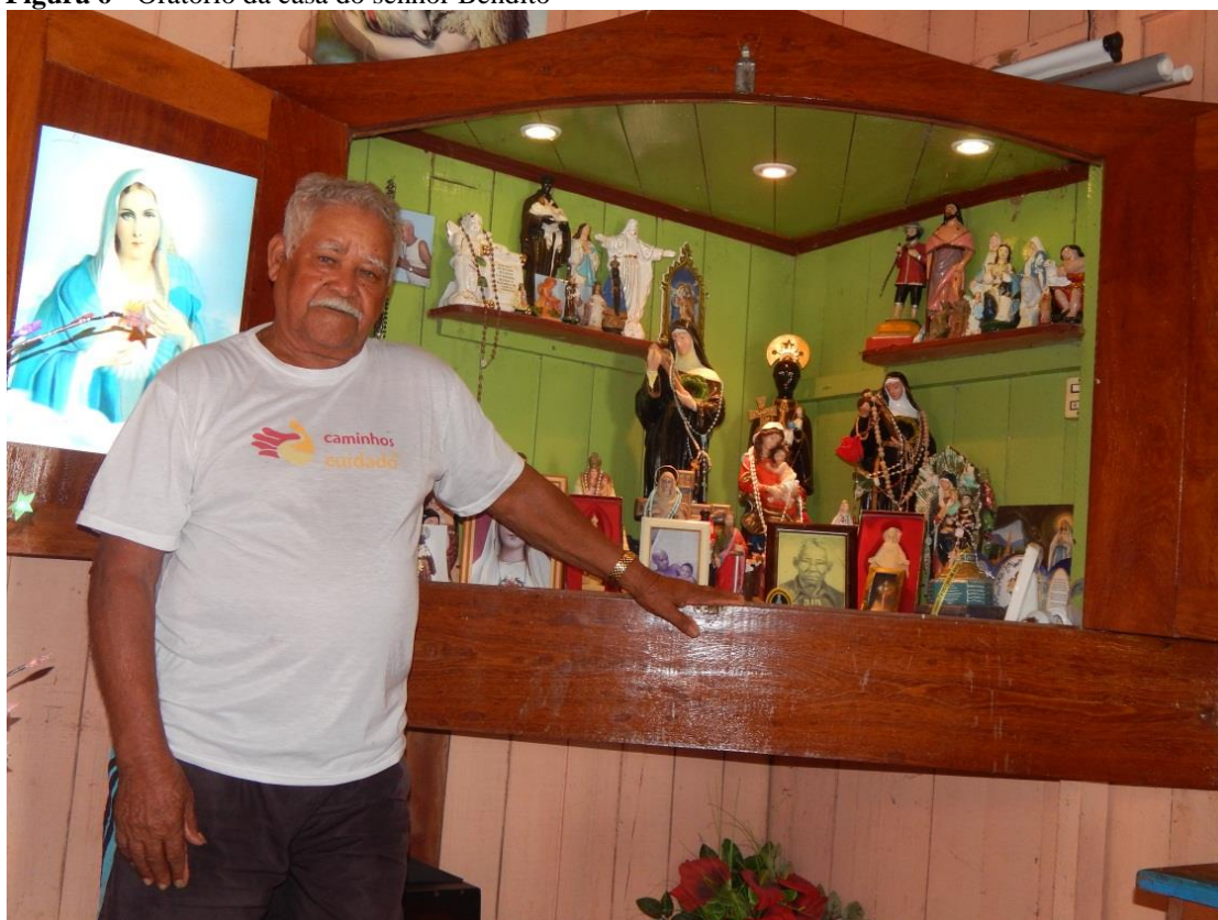
Figura 6 - Oratório da casa do senhor Bendito