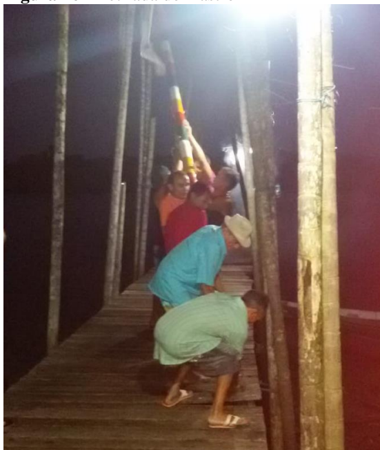
Figura 16 - Retirada do mastro