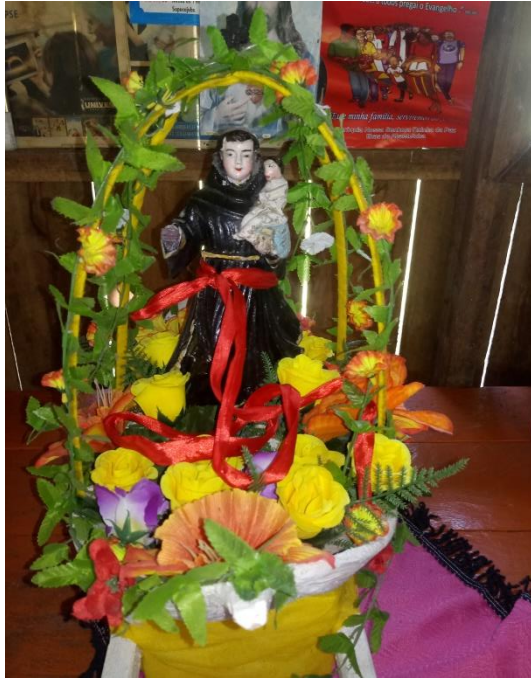
Figura 1, 2, 3 e 4 - Imagens de Santo Antônio.