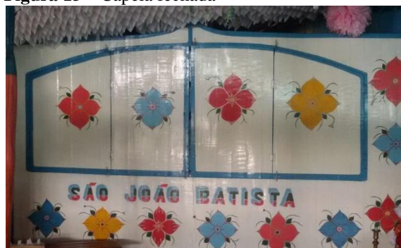
Figura 15 – Capela fechada