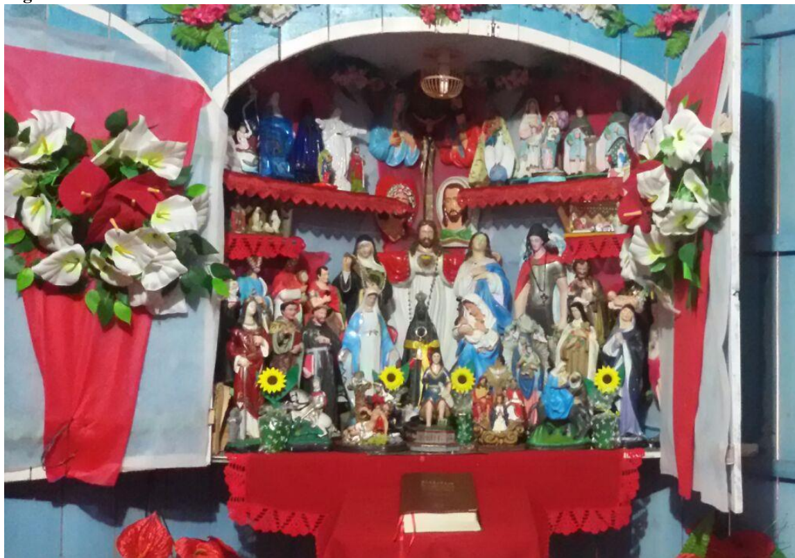
Figura 8 - Oratório da casa do seu Antônio