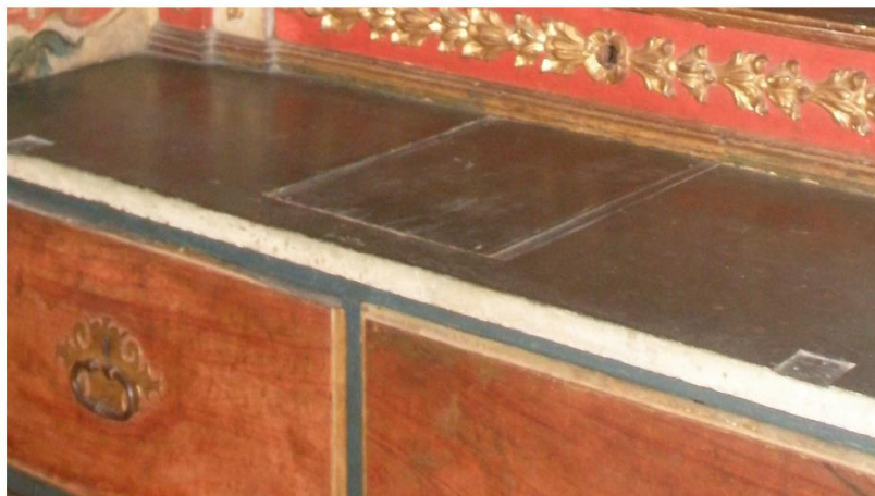
Figura 4 – Detalhes da cavidade onde se coloca a pedra d'ara