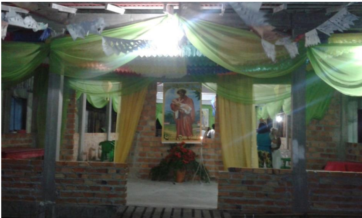
Figura 7 - Centro Comunitário São Benedito