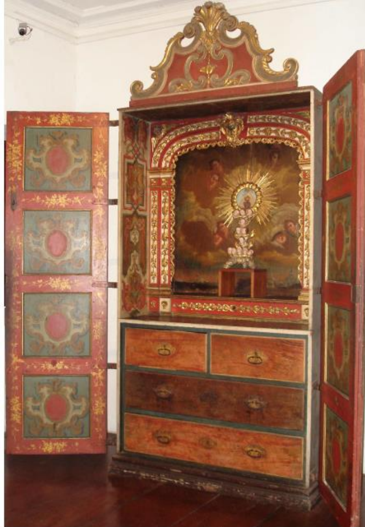
Figura 3 - Oratório armário com função de altar, séc. XVIII.