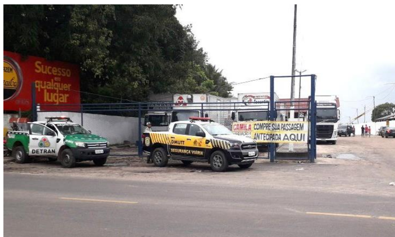
Figura 3: Porto de embarque e desembarque de veículos e viaturas de órgãos de segurança viária estadual (DETRAN) e municipal (DMUTT), no período do carnaval 2019.

Verificamos o esforço realizado pelo poder público na estruturação da cidade para o atendimento aos turistas no período do carnaval (Figura 3). Assim, a atividade turística se instala aproveitando principalmente as infraestruturas (formas espaciais urbanas) para se desenvolver, já que segundo Cruz (2000, p. 24) os “espaços urbanos constituem suporte e, ao mesmo tempo atrativo para o turismo”.