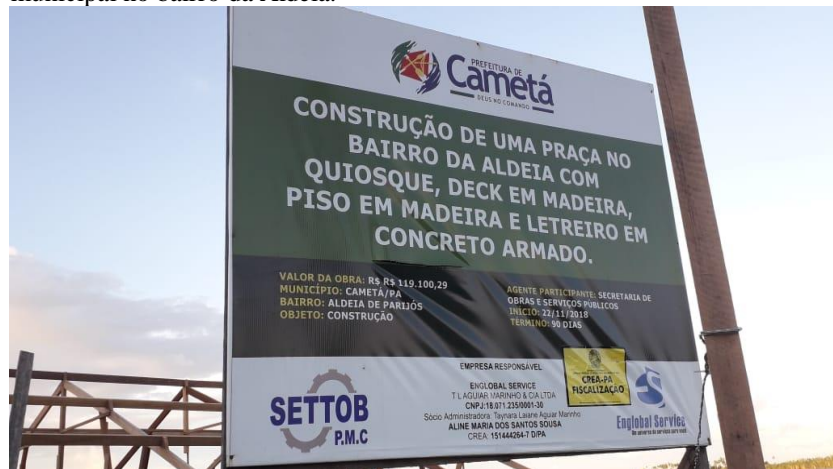
Figura 2: Placa em alusão às obras de infraestrutura do poder público municipal no bairro da Aldeia.

Assim, na prática, verificam-se apenas ações pontuais do poder público municipal com a implementação de obras como: asfaltamento de vias urbanas, instalação de semáforos em vias no centro da cidade, revitalização de praças, revitalização e reforma na orla da cidade e no bairro da Aldeia (Figura 2).