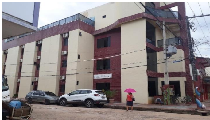
Figura 5: Vista do hotel Cametá Palace localizado no centro de Cametá.

Como é notoriamente perceptível, os números somados da capacidade da rede hoteleira, a exemplo o Hotel Cametá Palace (figura 5), e a capacidade da rede de restaurantes possivelmente não condizem com a realidade dos dados e informações divulgadas sobre os quantitativos de visitantes que fazem turismo em Cametá, mas é certo que esta cidade é bastante visitada, por ter um dos mais conhecidos carnavais do Estado, além, de atrativos naturais, como praias de rio e igarapés.