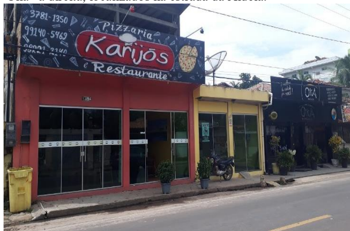
Figura 6: Restaurante “Karijós” à esquerda e restaurante “Oka” à direita, localizados na estrada da Aldeia.

É preciso destacar também outros serviços e equipamentos de alimentação e bebidas que fazem parte da infraestrutura turística. Oferecendo opções de lazer e comodidade para os turistas, esses estabelecimentos se configuram espacialmente em toda a cidade sendo essenciais no suporte e apoio da demanda turística nos períodos de maior visitação, tais como: Bar e Churrascaria do Batista, Bar e Lanchonete Aquarius, Caldo e Cia, Restô e Pub Faleiros Beer House, Pizzaria e restaurante Karijós e Oka resto e Pub (figura 6), que possuem somados capacidade de atendimento para 262 pessoas, entre outros.