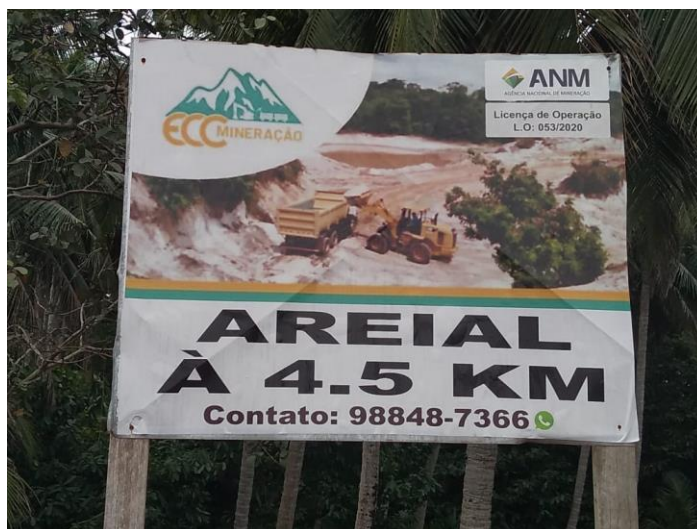
Figura 4: Placa de empresa sobre a atividade extração do areial próximo ao igarapé Maubinha.

Após a pressão de um empresário ocorreu a venda do terreno e com isso se deu a comercialização e a extração do minério por meio de maquinário. As consequências logo começaram a surgir, o que trouxe dano ambiental a todo o Ramal velho de Beja, afetando principalmente um igarapé que perpassa a localidade. Atualmente, a empresa ECC Mineração (Figura 4) realiza a extração do areial, em cuja área encontra-se a nascente do igarapé Maubinha