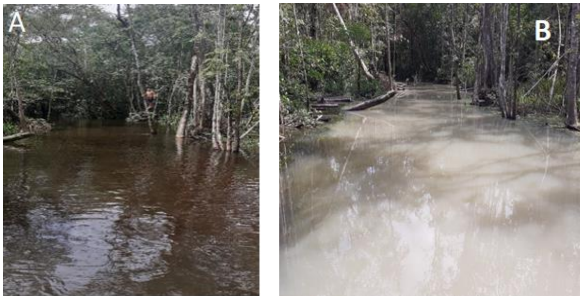
Figura 9: Imagens rio Arapiranga ante e depois da manutenção do mineroduto, em outubro de 2021