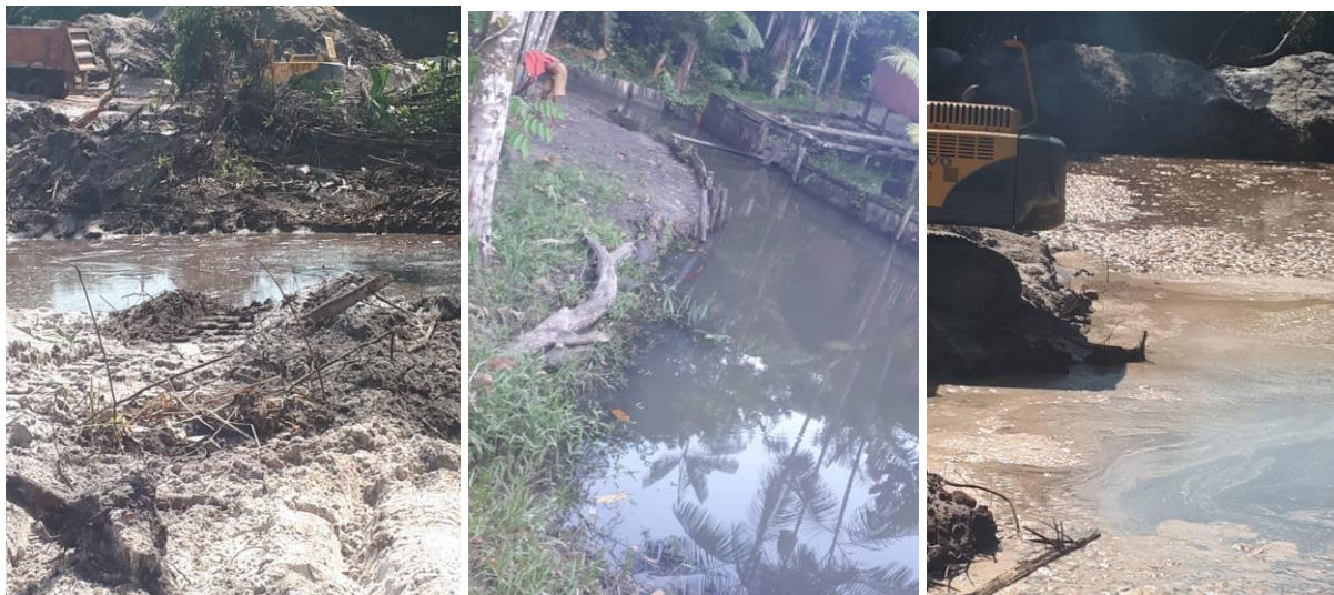
Figura 5: Situação do igarapé Maubinha, após a extração de areia.

Fotografia feita no final de setembro de 2021.