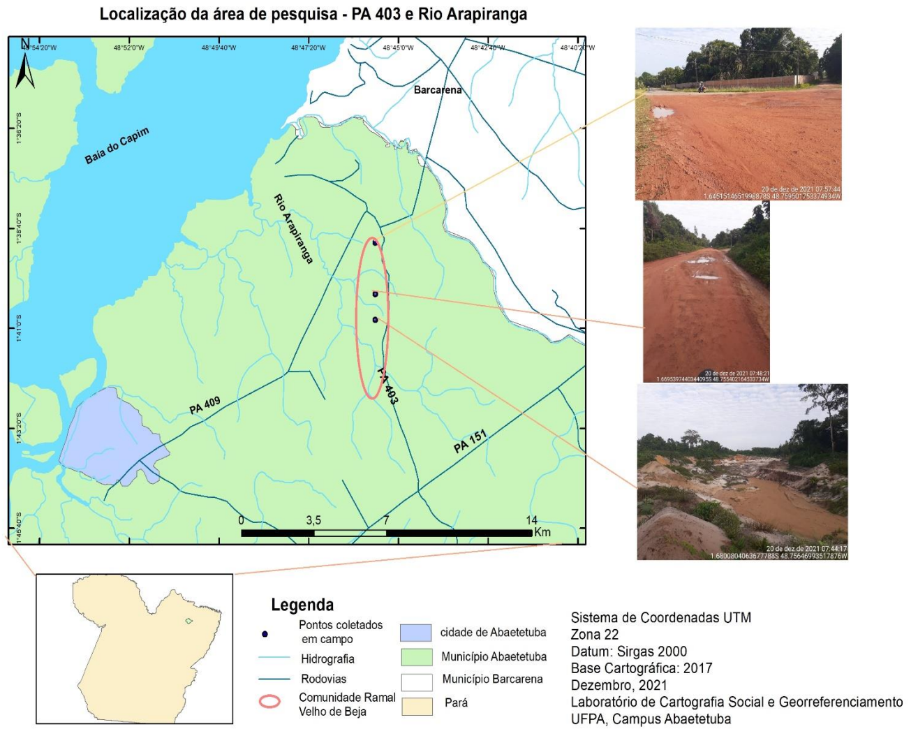
Figura 7: Situação e os impactos gerados por empreendimentos na comunidade