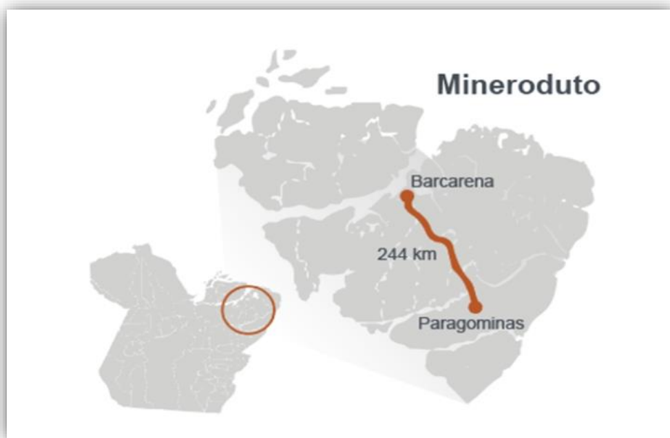
Figura 8: Extensão do mineroduto que passa nas imediações do Ramal Velho de Beja

Nos últimos meses, mais precisamente a partir do mês de agosto de 2021, ocorreu a manutenção do mineroduto em toda a região perpassando diversas localidades do município de Abaetetuba e demais municípios 1 . O mineroduto possui 244 km de extensão e passa por sete municípios do estado: Paragominas, Ipixuna do Pará, Tomé-Açu, Acará, Moju, Abaetetuba e Barcarena. Além disso, o sistema de transporte cruza os rios Capim, Acará Mirim e Moju 2 . Todavia, essas informações, disponíveis no sitio da empresa “apaga” as centenas de igarapés e rios menores como o Arapiranga, que sofre com os efeitos da atividade mineradora.