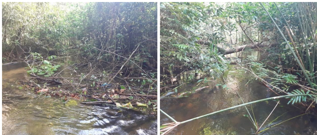
Figura 1 Trecho do rio Arapiranga atualmente.

Mas ao contrário do que já foi antes, atualmente o rio está tomado por lixo, árvores caídas dentro de seu leito, os quais contribuíram para seu abandono e quase desaparecimento. As imagens abaixo refletem essa realidade.