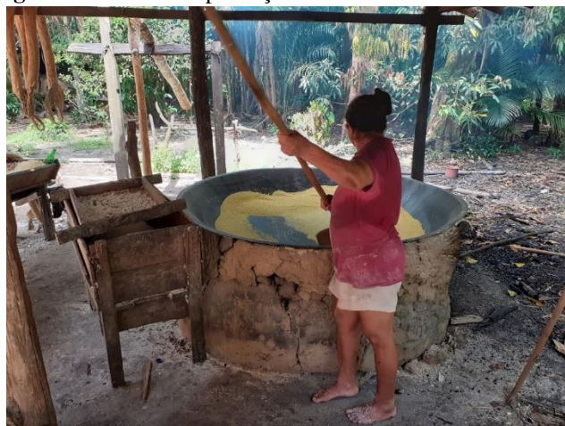
Figura 6: Feirante na produção da farinha de mandioca.