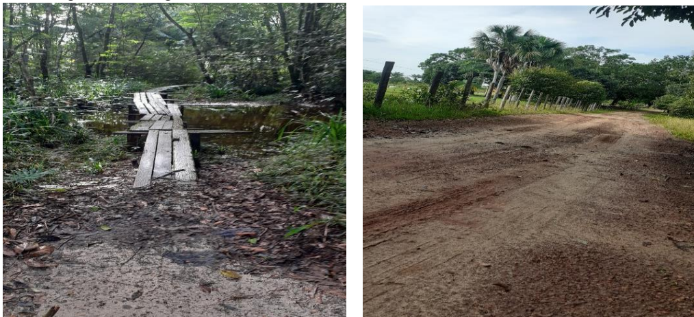
Figura 2: Antigo caminho de acesso a localidade Abelheira e o novo ramal das fazendas

Esses novos elementos na paisagem cobrem vasta porção de terras levando ao desaparecimento do que antes foi a Abelheira e encobrindo quase por completo o antigo caminho que dava acesso a ela. Não mais se vê a circulação de pessoas pelo mesmo, pois a circulação se dá pelo ramal que foi aberto por esses novos ocupantes da terra. O antigo morador, agora se tornou “estranho” e não podem passar, sem receber autorização, tal como ocorreu ao autor deste trabalho, durante a pesquisa de campo.