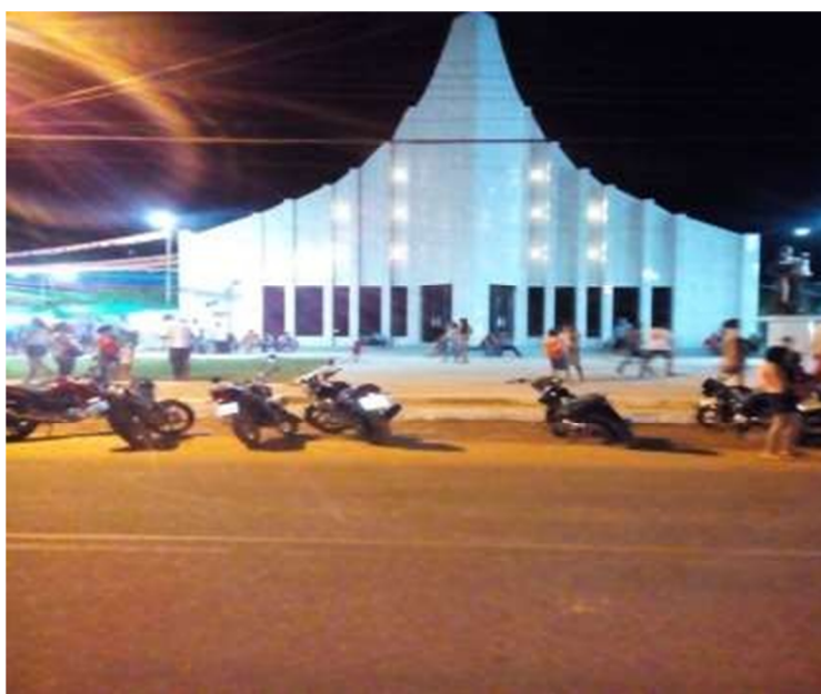
Imagem da cidade de Santo Antônio do Tauá 1 .

É um lugar que sobrevive da agricultura familiar, do comércio de confecções, funcionalismo público e empresas de produções granjeiros e dendê. Seu nome se dá por conta do rio Tauá, que banha grande parte do município, de nome indígena, que significa “barro amarelo”; e a devoção a Santo Antônio, unindo-se um ao outro ficou Santo Antônio do Tauá. Abaixo, temos a ilustração da cidade, mais precisamente em frente á paróquia de Santo Antônio de Lisboa.