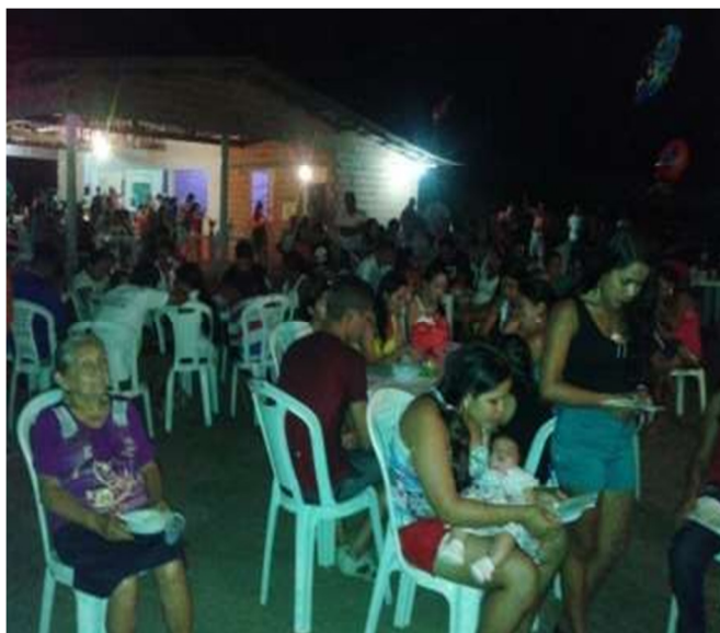
Marcação do bingo na festividade.

A data que ocorre o bingo é a noite que se espera o maior público na festividade, porque existe uma troca de valores, ou seja, todas as comunidades se responsabilizam com um número de cartelas da festa, quando acontece a festa das outras comunidades vai o mesmo tanto de bingo para ter um retorno tanto de pessoas como o financeiro.