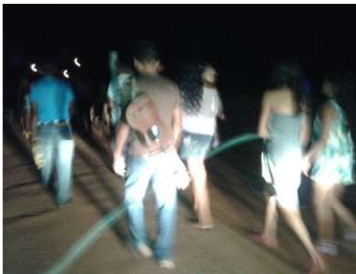
Procissão de São Sebastião na abertura da festividade 2016.

Essa é uma figura que representa a caminhada que deu abertura às festas, seguiam nela crianças, idosos, jovens e toda a comunidade de Bom Jesus. São Sebastião ia à frente, no seu andor, e mais atrás vinha o mastro, esse é um símbolo que tem uma força muito grande nas festividades, pois: