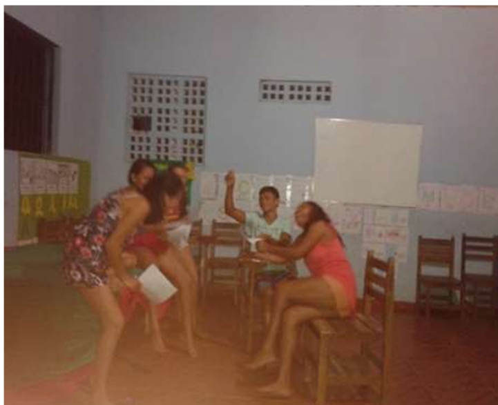
Imagem do grupo divertindo-se no ensaio.

Penso que seja importante ressaltar o momento de diversão, porque os encontros são eventos de saída da rotina dos participantes, por não terem essa oportunidade em outros momentos. Em Bom Jesus tem um estilo de vida rotineiro, a igreja é um dos poucos elementos que faz com que as pessoas se encontrem à noite, e no ensaio iam outras pessoas que não fazem parte da cena, pois ali se tornou um ponto de encontro.