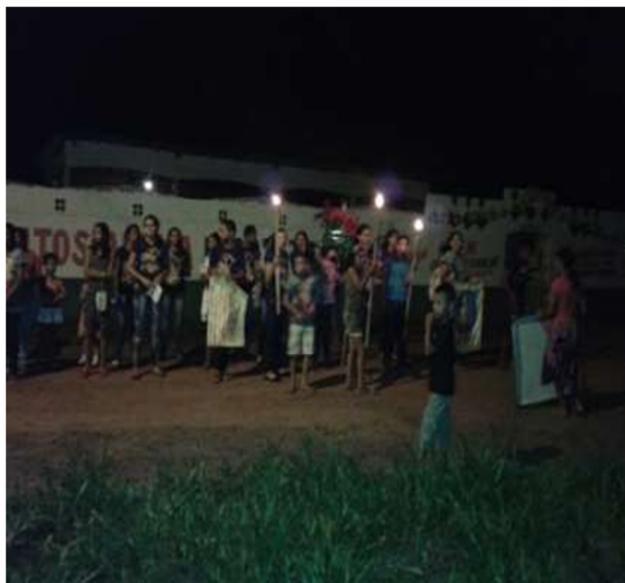
Homenagem a São Sebastião em frente à sede do Floresta Esporte Clube .

Assim, as crenças iam juntando-se, por meio da fé, toda essa movimentação da comunidade se dá porque a devoção a São Sebastião é muito forte, é nele que se encontram refúgios espirituais e materiais. É pela intercessão do Santo que são pedidas bênçãos para as famílias, saúde para os enfermos, um bom rendimento financeiro na festa e na festividade, é união de religiosidades, pois se acredita que a manifestação é promovida pela igreja católica, mas há pessoas que, mesmo às escondidas, veneram o Santo através de outros meios, até porque não é novidade a relação com a pajelança em Bom Jesus. É nessa diversidade de acontecimentos e crenças que se estabelece a junção de fragmentos que tornam a caminhada além da fé, ultrapassam barreiras, pois: