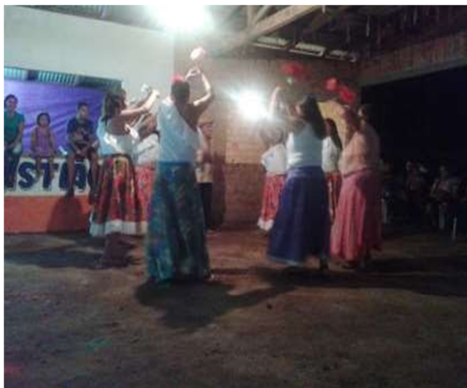
Apresentação do carimbó com o grupo das mulheres.

Assim, nas outras noites foram acontecendo outras manifestações que rechearam a festividade. Todas as noites aconteceram a celebração da palavra e depois acontecia uma apresentação para abrilhantar a noite. Dezoito de janeiro aconteceu a apresentação do louvor católico, com o grupo de canto da comunidade do Edém. Já no dia dezenove, a apresentação de paródias e carimbó com grupos regionais. Foram momentos muito importantes, porque são valorizados os grupos existentes no setor, ajudando aos jovens, crianças e idosos a participarem da cultura do lugar. Abaixo, a imagem da apresentação do carimbó com a associação das mulheres do local: