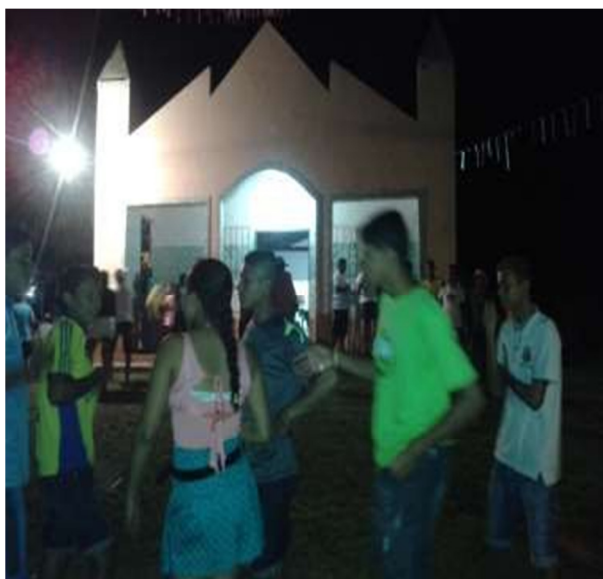
Capela de São Sebastião em Bom Jesus.

Festividade significa festa, uma solenidade que atinge um número grande de pessoas, se diversifica por vários significados, inclusive a religiosa, quando resulta de procissões ou romarias que podem ou não estar diretamente ligado com os santos padroeiros. As festividades religiosas se elevam por fazer parte de um cunho cultural e social de um determinado lugar, dando ênfase a fatos, personalidades emistérios.