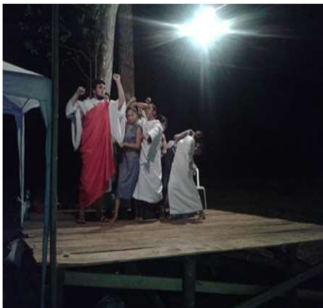
Apresentação do teatro no terreiro da igreja.