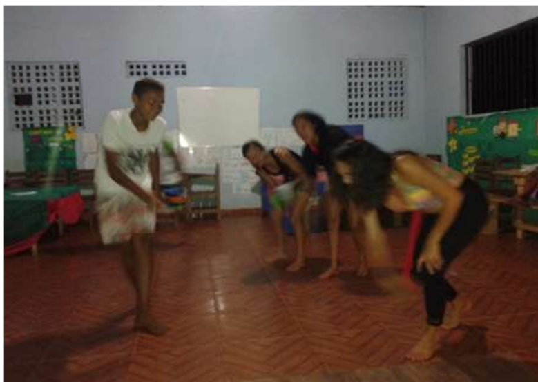
Ensaio da cena da festividade.