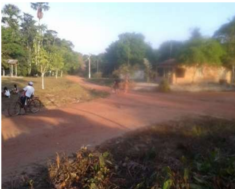
Imagem de Bom Jesus 3.