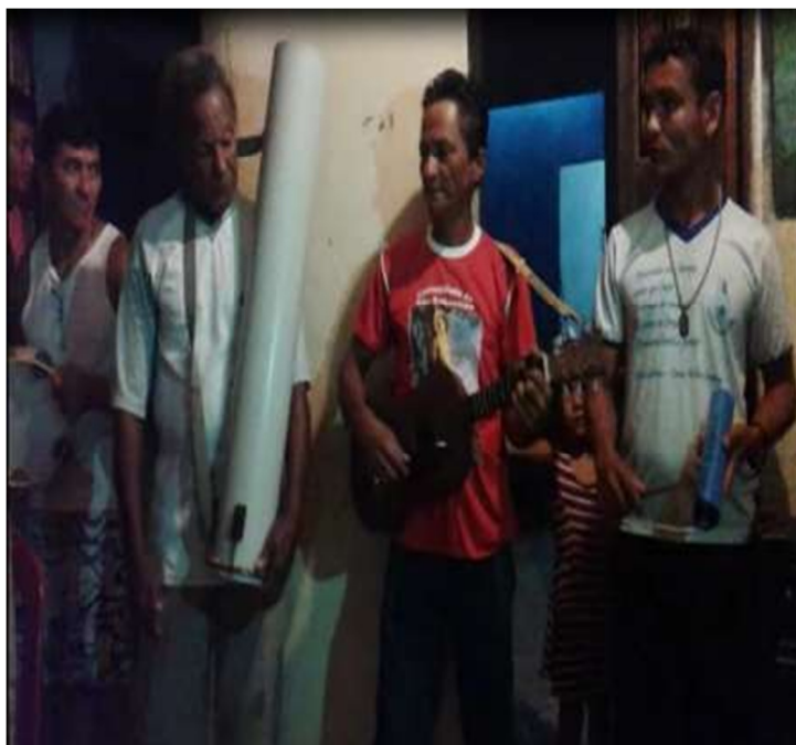
Foliões apresentando as folias (2016).

Os momentos acompanhados foram muito importantes, para fortalecer as minhas observações sobre os paralelos existentes, no que ouvi nas vozes que ativaram a memória para representar o que foram as ladainhas, e as folias no passado e a concretude dessas falas sendo apresentadas outra vez em um novo tempo com velhos e novos manifestantes. Antes, os foliões seguiam viagem nas outras localidades, com intuito de anunciar a chegada da comemoração de São Sebastião e de receberem donativos, que ajudaria na grande festa do dia vinte.