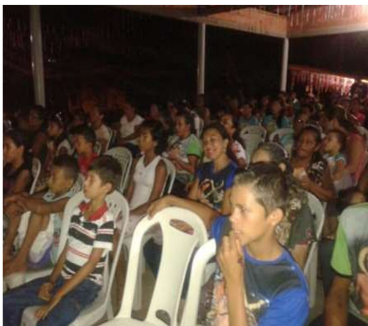
Apresentação do cinema.

Mas, para concluir a manifestação cultural, ainda aconteceu o cinema, há dois anos esse ato vem dando certo no cenário da festa, é onde as pessoas tem oportunidade de distrair e passar mais uma noite para celebrar o evento. O filme é uma maneira de comemorar o acontecido, lá as pessoas compram pipocas, enquanto alguns assistem ao filme conversam, consomem outras comidas etc. Abaixo a representação desse momento.