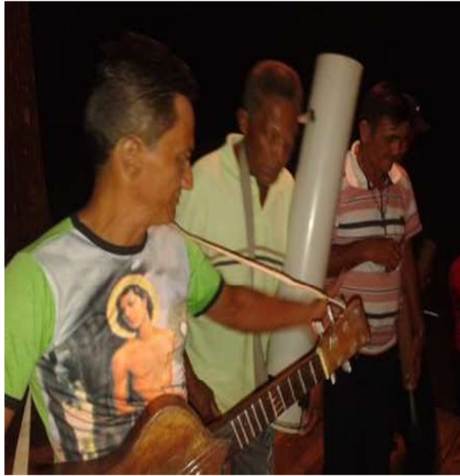
Grupo de foliões ensaiando antes de começar a apresentação das folias.

Também cabe enfatizar o comportamento da comunidade perante tudo que acontecia inclusive minhas observações em relação ao grupo. Posso começar com a maneira que os indivíduos se colocavam em relação ao momento: cantada a folia, primeiro o ritmo, a batida do tambor com os outros instrumentos foi priorizada. Em seguida, em sequência lenta e no instante que a voz entra o ritmo é modificado, ficando dessa vez mais acelerado. A voz, conseqüentemente, segue as linhas que Manoel de Belém disse: a grave, a média e aguda.