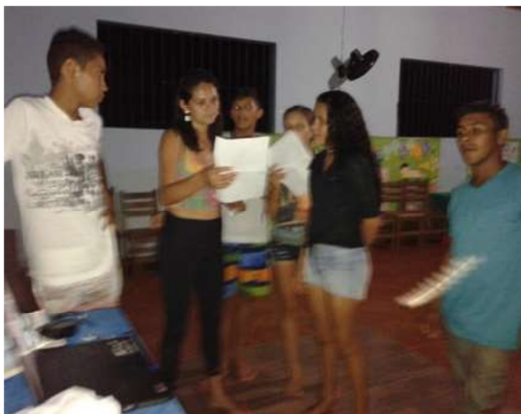
Atuantes ensaiando o ponto.