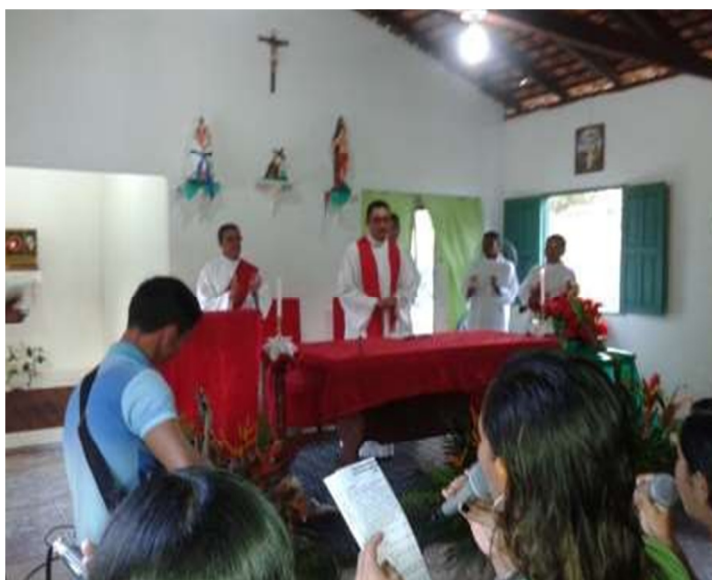
Celebração da Santa Missa.