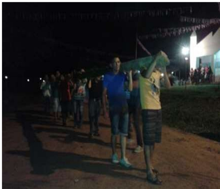
Homens carregando mastro na abertura da Festividade 2016