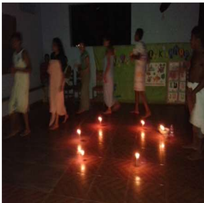
Ensaio utilizando figurino e adereços.

Os objetos foram inseridos no ensaio, para percebermos se o que utilizávamos serviria em cena. Os materiais utilizados na encenação têm a ligação direta com o contexto que vem sendo trabalhado em Bom Jesus. Ao escolher o cenário escuro para a cena, significa que lembra os caminhos de Bom Jesus, a vela é um símbolo que está diretamente ligado com a crença voltado aos santos, ao espírito santo, representa luz. O cetim com suas tonalidades vem refletir, a devoção a São Sebastião devido as suas fitas, assim como reproduzir o símbolo de entidades referente a mata verde. O terço simboliza a crença no catolicismo.