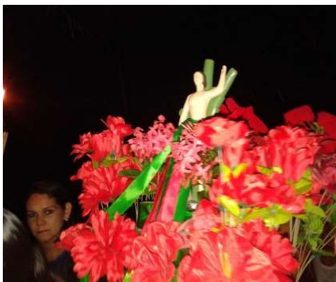
Imagem de São Sebastião na procissão da festividade 2016.