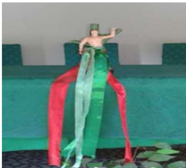
Imagem de São Sebastião doada para a igreja.