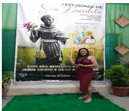
Figura 40 – Banner da festividade de 2022.