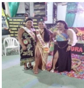
Figura 30 – Miss e Princesa Quilombola 2023.