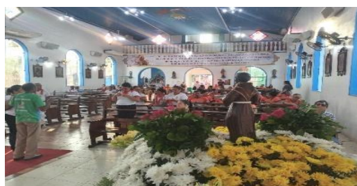
Figura 16 – Imagem no interior da Igreja de Nossa Senhora do Carmo.