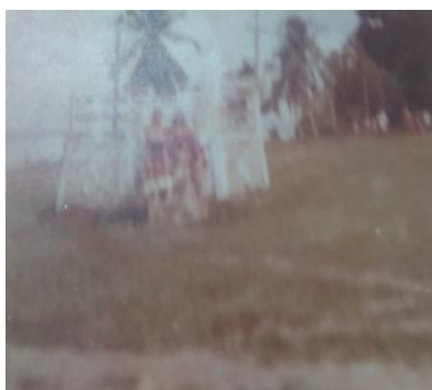
Figura 8 – Antigo coreto da Vila Moiraba.