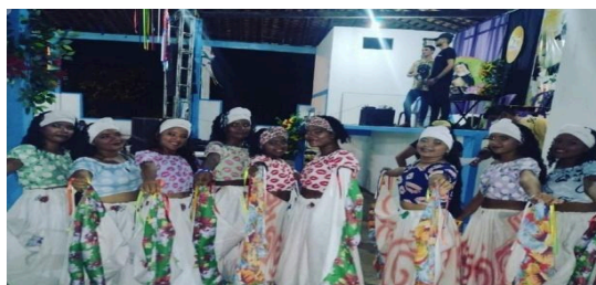
Figura 33 – Ministério de dança. (Essência de Deus).