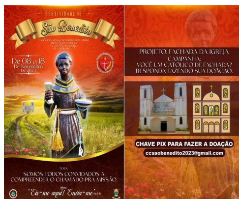
Figura 13 – Cartaz da festividade do ano de 2023.