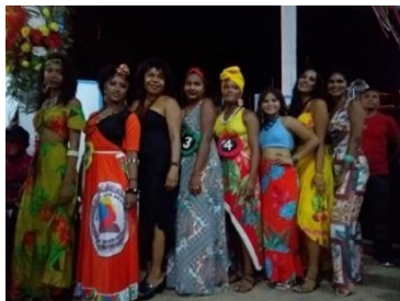
Figura 28 – Miss Quilombola 2021.

comunidade quilombola, com o objetivo de promover o reconhecimento das mulheres na nossa historicidade.