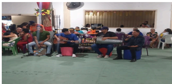
Figura 32 – Mensageiros de Deus “Santa Rosa de Lima”.