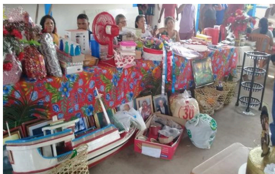
Figura 23 – Donativos para o leilão de oferendas de 2022.