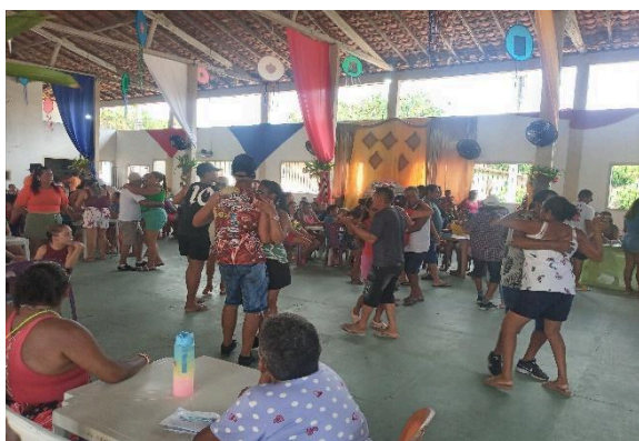
Figura 24 – O povo dançando no leilão de oferendas.

Observa-se que essas práticas se assemelham ao festejo de outrora, uma vez que as comemorações ainda mesclam, de forma discreta, o profano e o religioso. Isso é evidente nos momentos religiosos nas igrejas, mas também nos salões sociais, onde as grandes aparelhagens atuais tocam músicas mundanas e dançantes. Além disso, durante os intervalos do bingão e do leilão, que ocorrem nos encerramentos das festividades, bem como no encerramento do tradicional Siriá e no deslocamento final do santo em procissão pelas ruas da comunidade até seu retorno à igreja matriz, dá-se por concluída a programação religiosa do ano vigente. As figuras 24, 25, 26 e 27 ilustram essa narrativa.