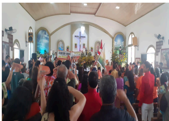
Figura 37 – Início da celebração da Missa.