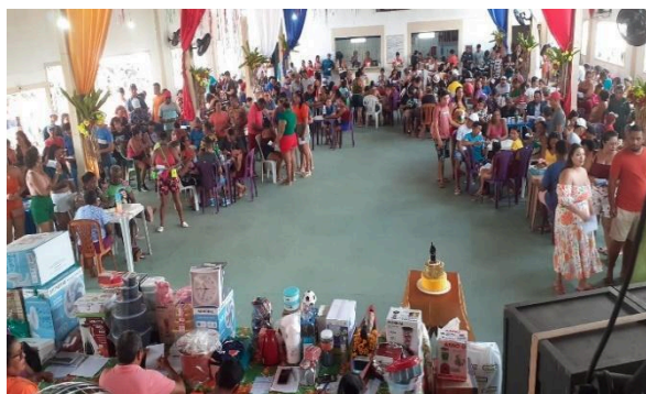
Figura 22 – Encontro de parentes e amigos no leilão de oferendas de 2023.