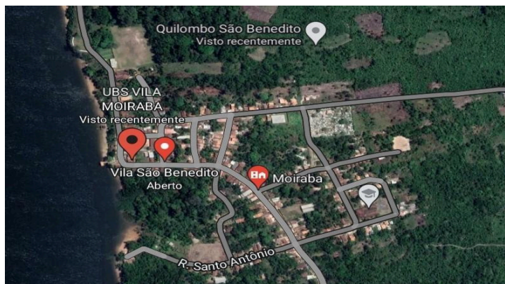
Figura 2 – Distrito de Vila Moiraba e o Quilombo São Benedito.