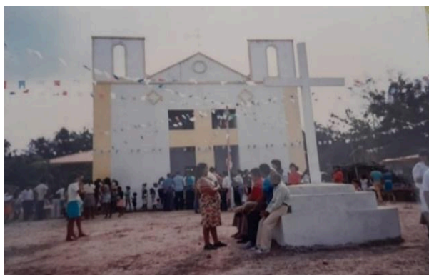
Figura 10 – Frente da Igreja com o antigo cruzeiro.