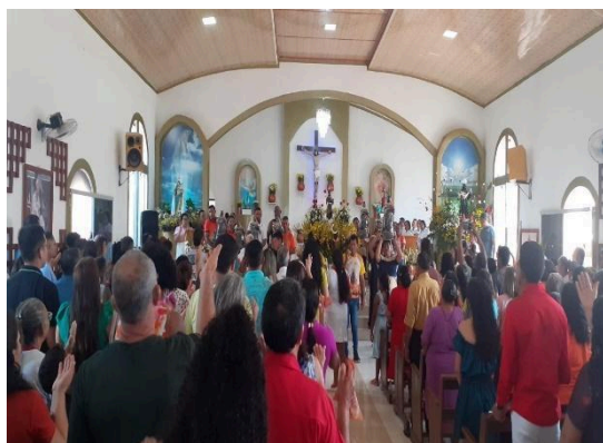
Figura 38 – Sorteio de 10 São Beneditos (promessa).