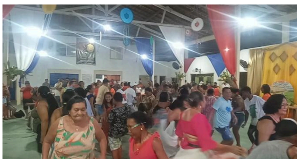
Figura 26 – Encerramento com o tradicional Siriá.