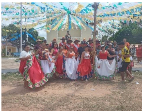
Figura 42 – Grupo de mulheres ao redor do mastro.

Ao término das programações religiosas, no dia seguinte ocorre o encerramento da festa com a derrubada do mastro, para a qual todos são convidados. Esse momento cultural, juntamente com a nova proposta, leva aos moradores concepções de resgate histórico e de continuidade dos elementos religiosos para as futuras gerações. As figuras 42 e 43 demonstram essas perspectivas.