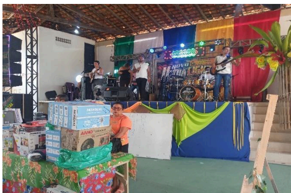
Figura 25 – A banda musical “Só Marcantes” animando o leilão.