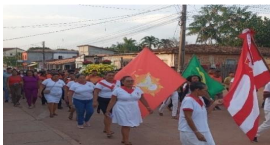
Figura 20 – Fiéis e a imagem do padroeiro.