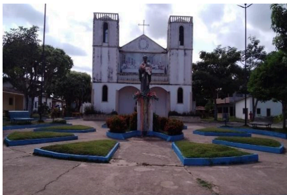
Figura 11 – O antigo cruzeiro sendo substituído pela imagem de São Benedito.