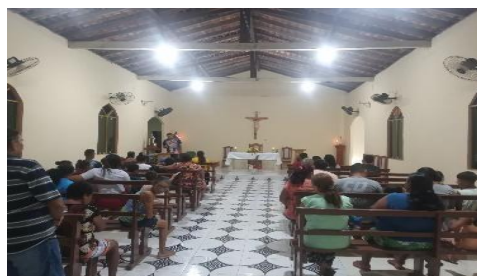
Figura 34 – Comunidade Cristã de Santa Rosa de Lima.