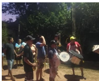
Figura 36 – Banda Sinfônica.