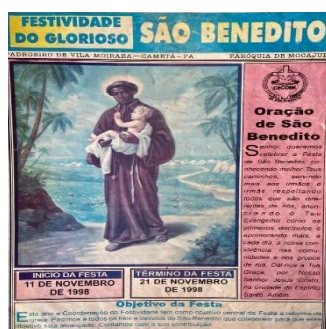
Figura 1 – Imagem do programa da Festividade de São Benedito de 1998, realizada no Quilombo São Benedito, localizado na Vila Moiraba.

da imagem do santo padroeiro para outros locais, onde ele encontra os fiéis. Esse festejo transcende o tempo e reforça a visibilidade e a confirmação da existência e resistência dos negros em nossa comunidade, cuja presença se perpetua por gerações. Na Figura 1 , destaca-se a imagem de São Benedito no encarte da Festividade de 1998, que ajuda a contextualizar o evento de outrora.