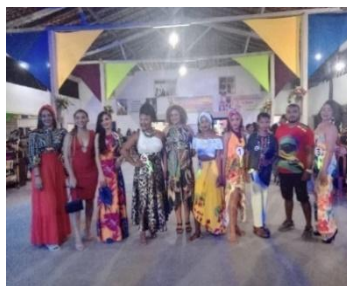
Figura 29 – Miss Quilombola 2022.