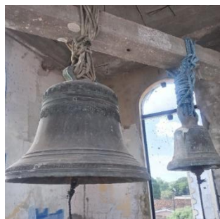
Figura 4 – Sino de bronze.