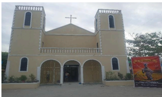
Figura 21 – Imagem atual da igreja em processo de reforma.