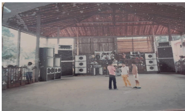
Figura 12 – Aparelhagem no antigo salão comunitário.