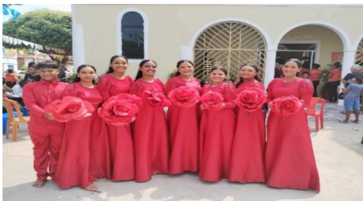
Figura 39 – Ministério de Dança “Art`Vidance São Benedito”.