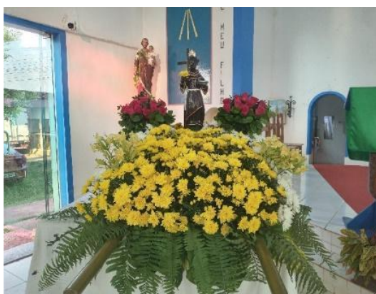
Figura 14 – Imagem do Padroeiro São Benedito.