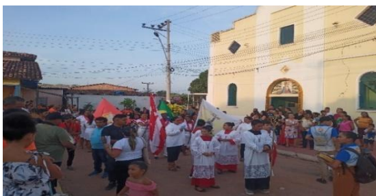
Figura 17 – Saída do Círio da Igreja de Nossa Senhora do Carmo.

Percebe-se, em meio às transformações contemporâneas, a padronização das vestimentas dos guardas que protegem o santo durante seu deslocamento para a comunidade vizinha, bem como a receptividade dos fiéis para as orações que antecedem o alvorecer do festejo, marcadas pelo badalar dos sinos, destacando-se o uso exclusivo do sino menor remanescente da igreja, que ressoa durante os dias da festividade, simbolizando os preparativos para a tradicional alvorada, entre outros rituais. Além disso, mantém-se a distribuição dos tradicionais chocolates com farinha de tapioca, mingau de milho, entre outros. Nas figuras 17 e 18 , ressalta-se o modelo da procissão contemporânea.