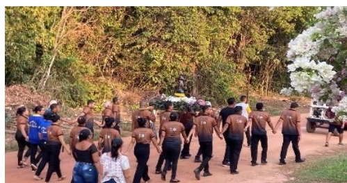
Figura 15 – Translado da imagem para a Vila do Carmo.

No contexto do festejo, de forma fragmentada e adaptada, a descrição da festividade contemporânea do Santo Padroeiro se dá pela continuidade da transladação, que marca o início do evento, com a condução da imagem de São Benedito para a igreja de Nossa Senhora do Carmo, na localidade vizinha de Vila do Carmo, conduzida pelos fiéis. O santo permanece três dias na comunidade receptora para os preparativos do início da festividade, que inclui a novena e o terço, como enfatizado nas figuras 15 e 16 .