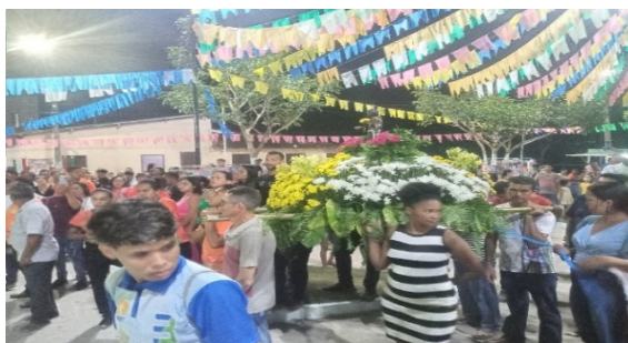
Figura 19 – Chegada da imagem em sua igreja.