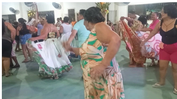
Figura 27 – Os fiéis devotos dançando o Siriá.