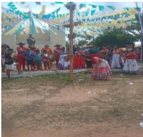
Figura 43 – Derrubada do mastro.