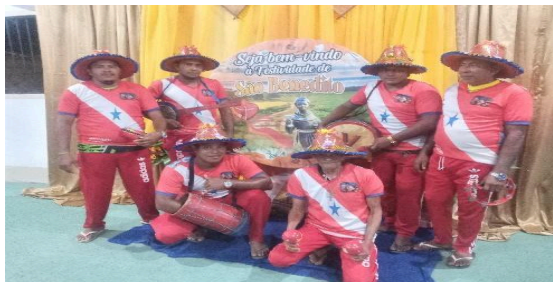
Figura 31 – Grupo de Banguê “Vermelhão”.