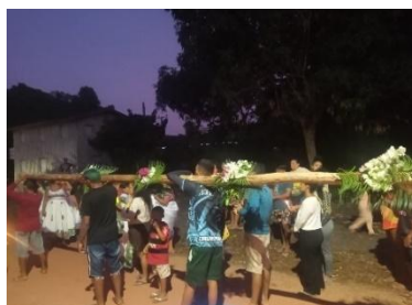
Figura 35 – Mastro.