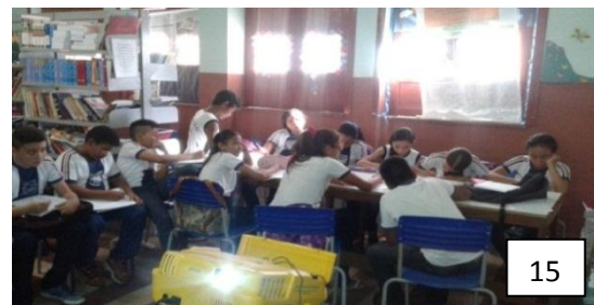
Figuras 14 e 15: Alunos na oficina: Como organizar um trabalho escolar.