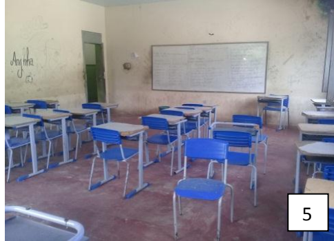
Figura 5: Sala de aula com riscos nas paredes.