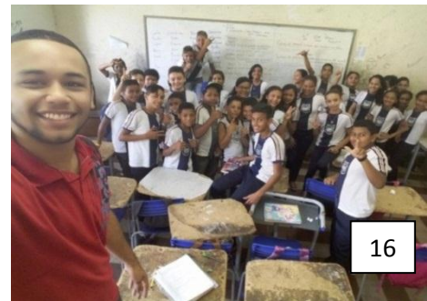
Figura 16: Bolsista e a turma após a última oficina do ano.

Os alunos deveriam flexionar os verbos na pessoa e no tempo solicitado, marcando a resposta correspondente em suas cartelas. Todos os alunos participaram da atividade e ficaram muito animados com as premiações, a turma compreendeu um pouco os tempos verbais e suas conjugações, destaca-se na atividade a utilização de verbos do cotidiano ribeirinho como pescar, lancear, remar, debulhar, nadar, apanhar e outros.