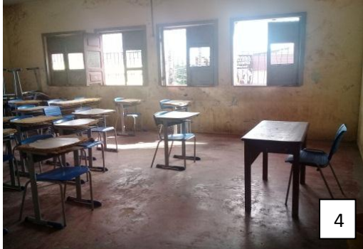
Figura 4: Sala de aula com janelas danificadas.

caminhões, motos e outros veículos, dificultando o andamento da explicação de conteúdo, além de chamar a atenção dos alunos.