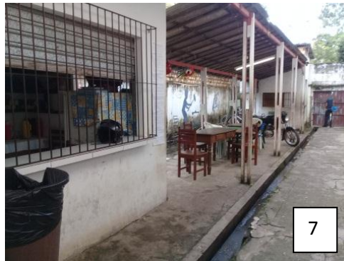
Figura 7: Pátio de Entrada da escola.

No último IDEB de 2015, ano em que o PIBID já atuava na escola, a mesma obteve como resultado 5 3,1 recebendo um sinal de atenção 6 , entretanto avançou em relação ao IDEB anterior 7 do ano de 2013 em que esteve com 3.0, resultado obtido através da Prova Brasil e outras atividades como olimpíadas de língua portuguesa e matemática para o ensino fundamental II. No ensino médio é avaliado por meio dos resultados da Avaliação Nacional da Educação Básica (Aneb).