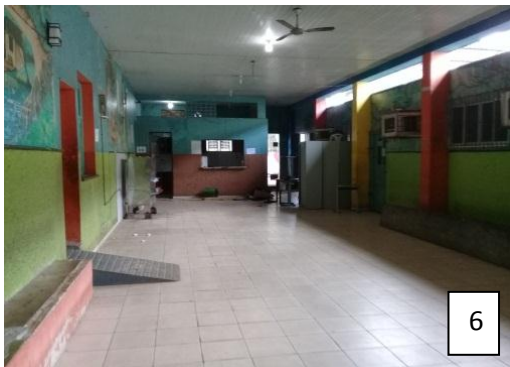
Figura 6: Espaço interno