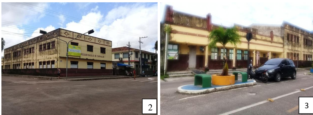
Figura 2: Visão frontal da escola e entrada principal. Figura 3: Visão lateral da escola já em reforma.

O prédio da escola sede passou por várias adaptações, devido localizar-se no centro da cidade e não existir possibilidades de expandi-lo para os lados, conta com 14 salas de aulas, sala dos professores, biblioteca, secretaria, diretoria, sala de coordenação pedagógica, copa, banheiros, laboratório de informática, laboratório de ciências, quadra de esportes. Em 2017, a escola foi contemplada com o projeto de reforma e ampliação do prédio no valor de R$ 2.537.139,42 (dois milhões quinhentos e trinta e sete mil cento e trinta e nove reais e quarenta e dois centavos).