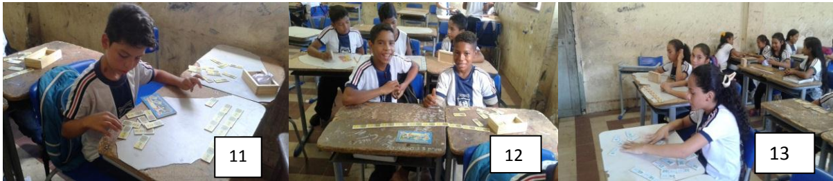
Figuras 11, 12 e 13: Alunos em atividade com o dominó.

bolsista estivesse acompanhando os alunos nas continhas, um por um para melhor entendimento, alguns afirmavam que não pediam ajuda a professora de matemática por medo ou por não terem uma boa relação com ela, a partir dessa problemática foi levado para a sala de aula o dominó das operações que estava disponível em um armário da escola, sem utilização.