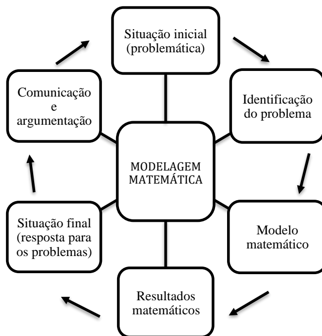
Figura 01: Desenvolvimento de Modelagem Matemática