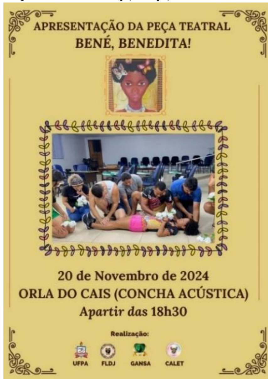
Figura 2 – Cartaz de divulgação da peça teatral Bené, Benedita!

negra no Brasil, unidas pela resistência e pela denúncia das desigualdades sociais. No cartaz de divulgação da peça, conforme a Figura 2, observa-se, ao centro, a imagem de um ensaio do espetáculo e, acima, a ilustração de uma mulher negra. Por questões de direitos de imagem, optou-se pela utilização de uma obra do artista visual Alex Lima, cuja pintura evoca ancestralidade, resistência e protagonismo feminino negro, reforçando as temáticas centrais da encenação.