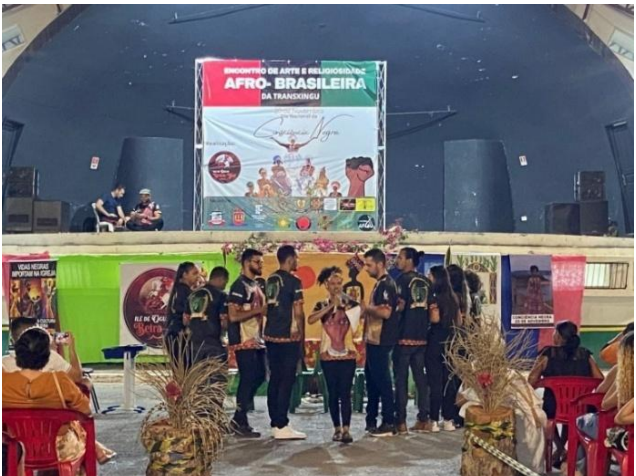
Figura 3 – Apresentação da peça teatral Bené, Benedita!

passagem significativa da infância da protagonista, marcada pelo trabalho precoce no campo (Farias, 2014). Essa experiência é transfigurada na peça teatral por meio da inserção do poema Me gritaram negra , de Victoria Santa Cruz (2020), no qual a voz poética relata a experiência da racialização desde a infância. A menina trabalhadora da crônica é, assim, ressignificada como a menina racializada do poema, ampliando o alcance simbólico da narrativa no espaço cênico. Essa transfiguração ganha materialidade na cena em que a personagem performa o poema cercada por integrantes do elenco que representam as vozes sociais opressoras, das quais ela se liberta simbolicamente, conforme a Figura 3.