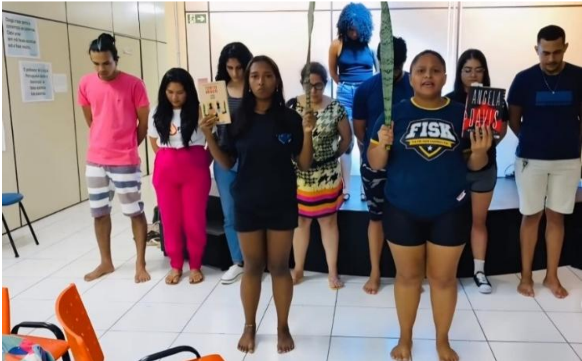
Figura 4 – Ensaio da peça teatral Bené, Benedita!

Outro momento significativo da adaptação ocorre no uso do poema Alfanje , de Almeida (2018), que abre e encerra a peça. Na crônica, a memória de Benedita é marcada pelo relato direto da violência; na adaptação, essa memória é convertida em representação coletiva da resistência feminina negra. O recurso de duas atrizes recitando o poema remete simbolicamente às duas irmãs da narrativa, reforçando a duplicidade feminina presente tanto na crônica quanto na encenação, conforme a Figura 4.