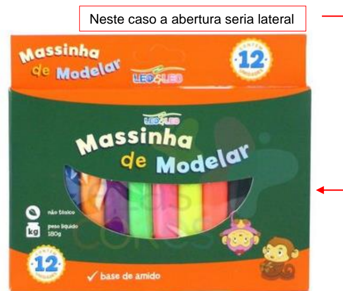
Figura 1 - Caixa de massinha de modelar Leo&Leo