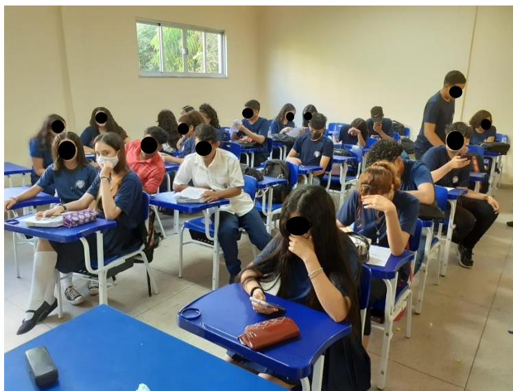
Figura 4: Alunos jogando RPG solo