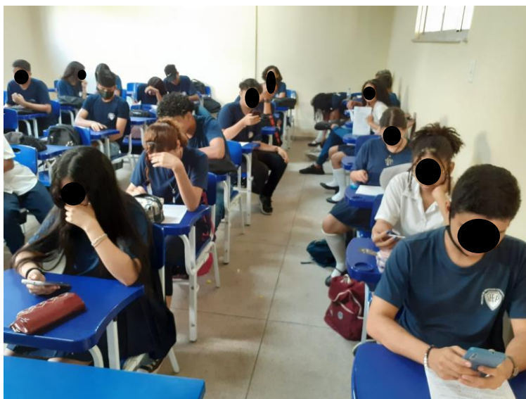
Figura 3: Alunos jogando o RPG solo