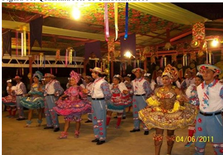
Figura 11: Quadrilha Flor do Candorina 2011