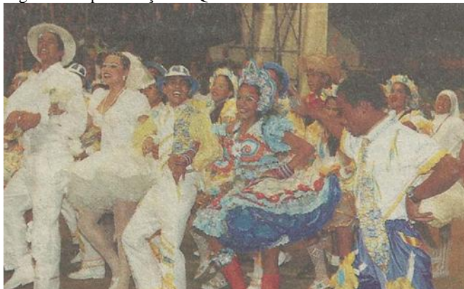
Figura 10: Apresentação da Quadrilha Flor do Candorina 2010

Fonte: Cristiano Martins – O Liberal Belém - 5/7/2010