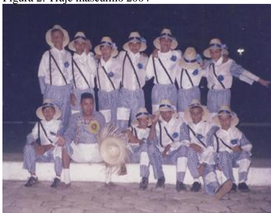
Figura 2: Traje masculino 2004

Em 2004 já foi modificado né? já foi pra xadrezinho azul, chapéu, melissa, passamos aderir a meia de crochê, devido a meia de crochê fazer parte da... ditamente assim, da roça, quadrilha roceira, então nós aderimos a meia de crochê como nosso referencial também, nos nossos trajes.