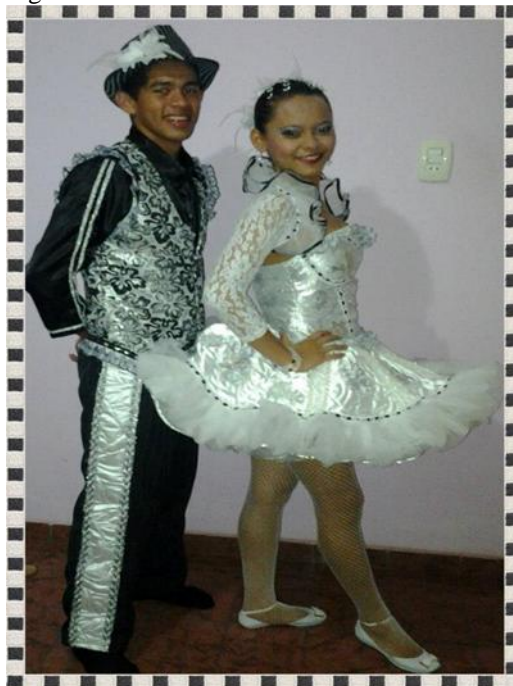
Figura 12: Casal Flor do Candorina – 2012