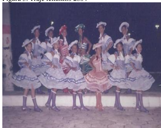
Figura 3: Traje feminino 2004