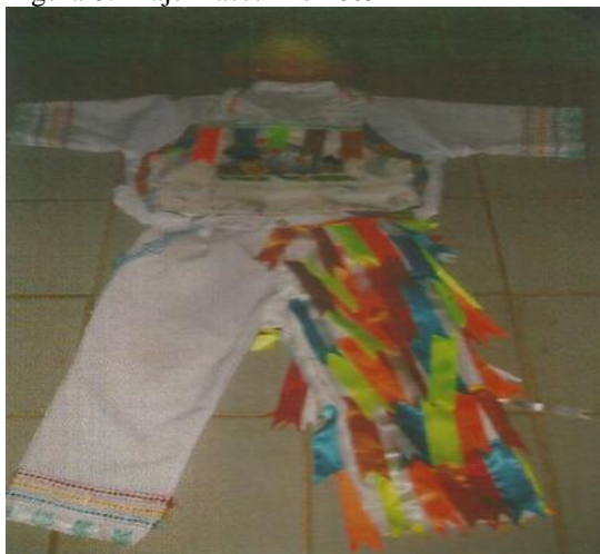
Figura 8: Traje masculino 2009