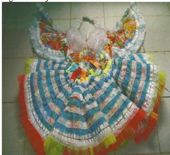
Figura 9: Traje feminino 2009