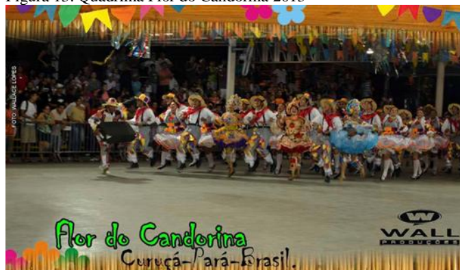
Figura 13: Quadrilha Flor do Candorina 2013

Neste mesmo ano a Flor do Candorina ficou em 1º lugar no Concurso Intermunicipal de quadrilhas de Curuçá, tendo também, como ganhadoras suas misses simpatia, mulata e caipira 21 . Se classificando entre as três melhores no Concurso Intermunicipal de Marituba, entre as três melhores do Concurso Intermunicipal de Marapanim, e entre as cinco melhores no Concurso Intermunicipal de Capanema.