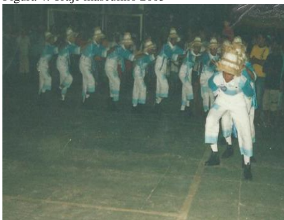
Figura 4: Traje masculino 2005