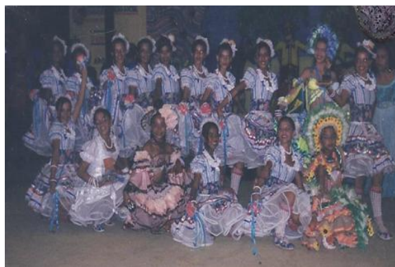
Figura 7: Traje feminino 2006