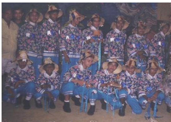
Figura 6: Traje masculino 2006

Foi então que o sonho se realizou, alimentando cada vez mais o gosto de ser campeã. O trabalho aumentou e a dedicação dos brincantes foi dobrada, estimulada pelas premiações alcançadas, um reconhecimento merecido pelo trabalho dedicado da professora e dos componentes da Quadrilha Flor do Candorina.