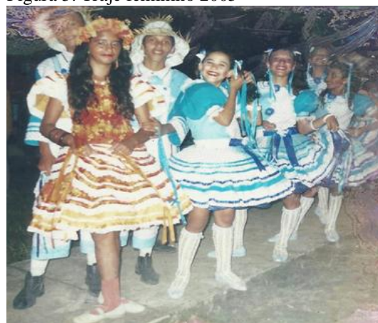
Figura 5: Traje feminino 2005