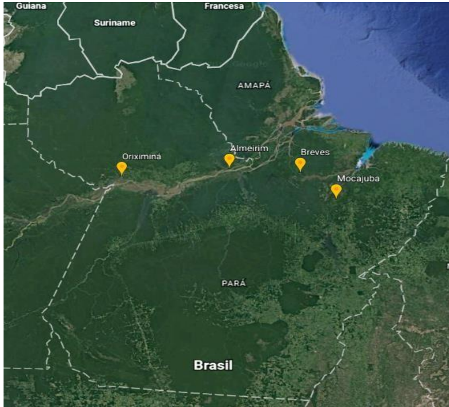
Figura 1: Mapa demonstrando os locais de onde as amostras de Filhote ( B. filamentosum ) do presente estudo são provenientes