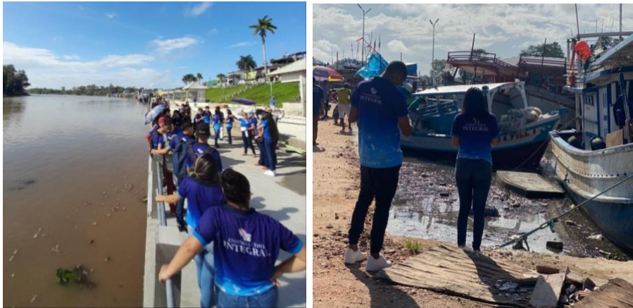
Figura 2: Observação e análise da Orla Rio Caeté pelos estudantes à cerca dos resíduos sólidos.

conseguimos responder os questionamentos dos alunos acerca do tema e introduzi-los em uma discussão ambiental e social.