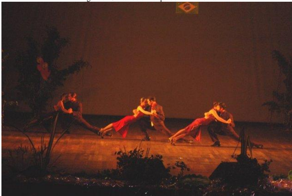
Figura 7: Cantando e Dançando a Amazônia