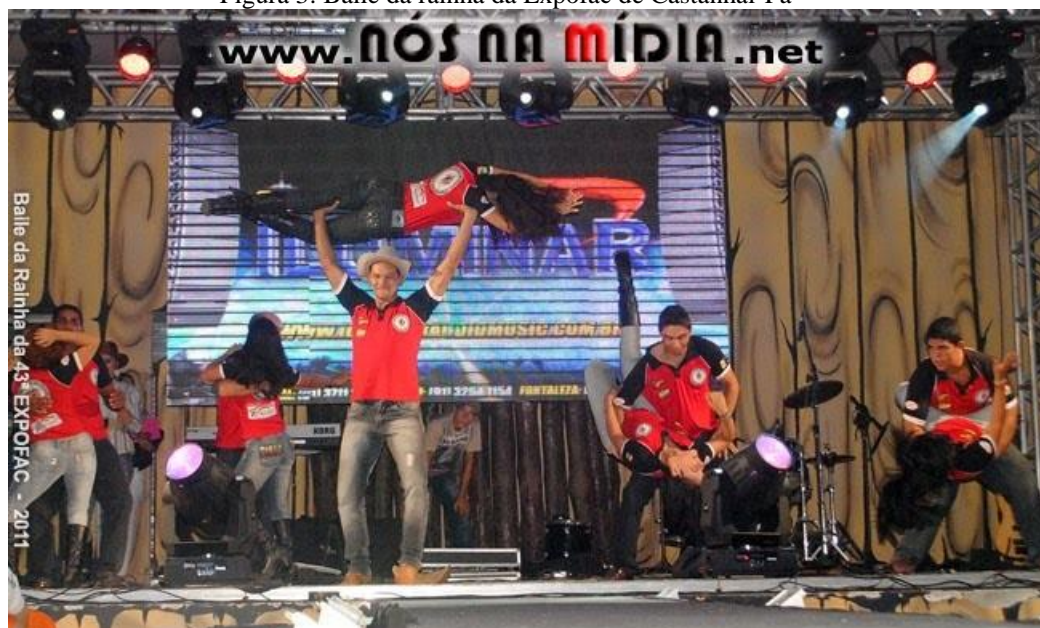
Figura 3: Baile da rainha da Expofac de Castanhal-Pa