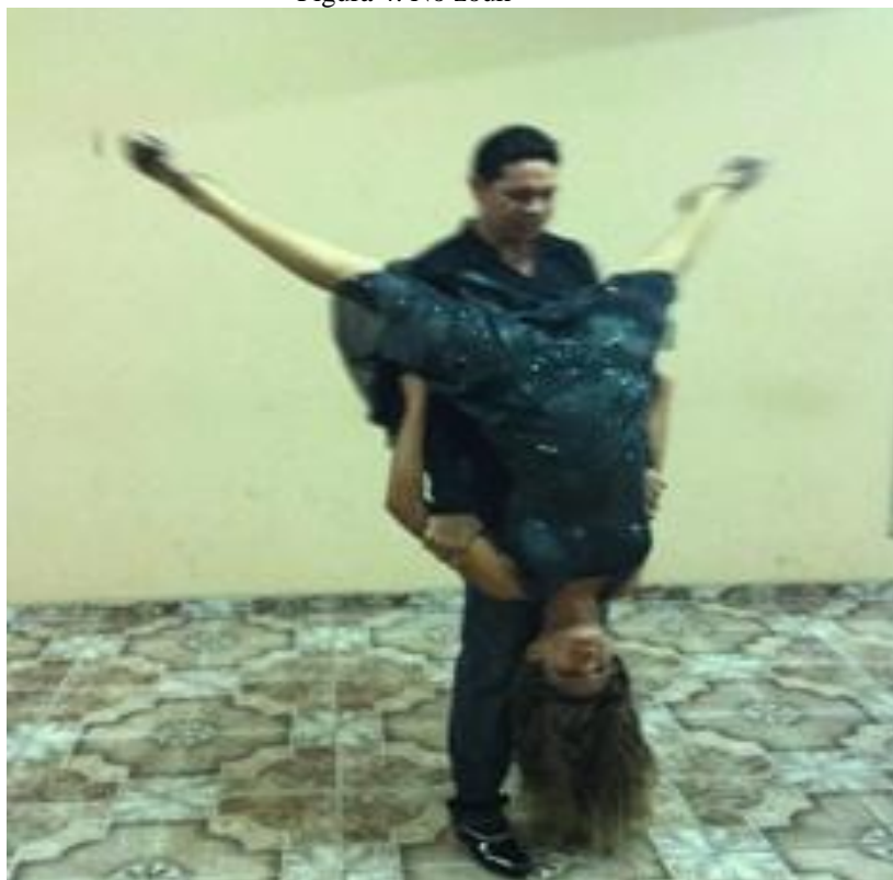
Figura 4: No zouk