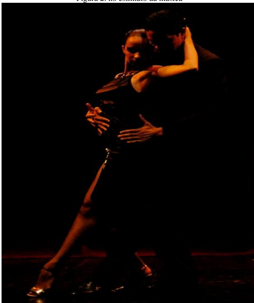
Figura 2: no estímulo da música