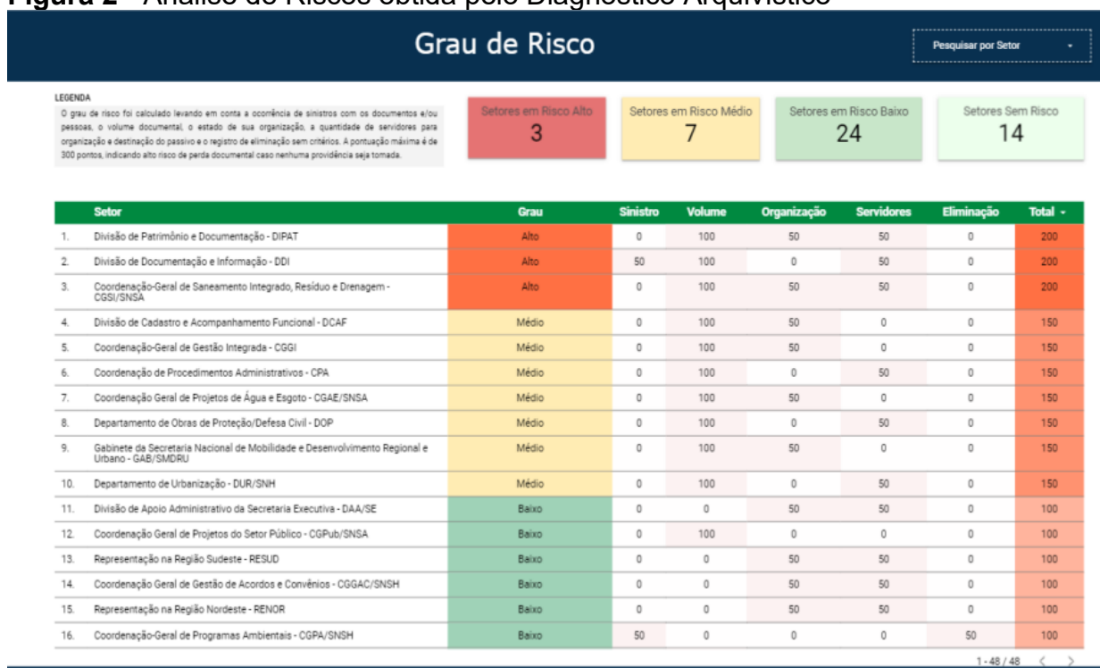
Figura 2 - Análise de Riscos obtida pelo Diagnóstico Arquivístico