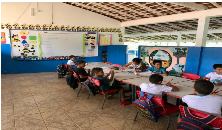
Figura 12 - Alunos da EMEF do Povoado do Céu