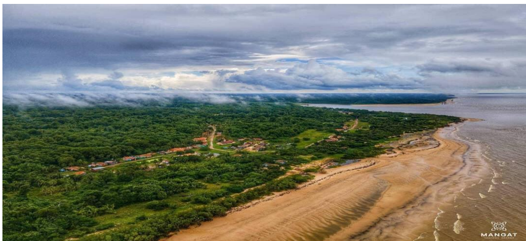
Figura 2 - Vista aérea da Comunidade do Povoado do Céu.

A Comunidade do Povoado do Céu sofre com a erosão em períodos de grandes chuvas, principalmente nas águas de março. Em decorrência desses fenômenos, as casas são em estilo “palafitas suspensas” devido à variação da tábua da maré.