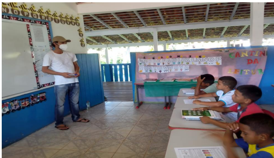
Figura 11 - Estágio Gestão.