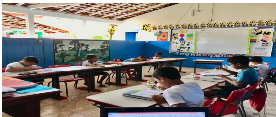
Figura 8 - Alunos da EMEF do Povoado do Céu