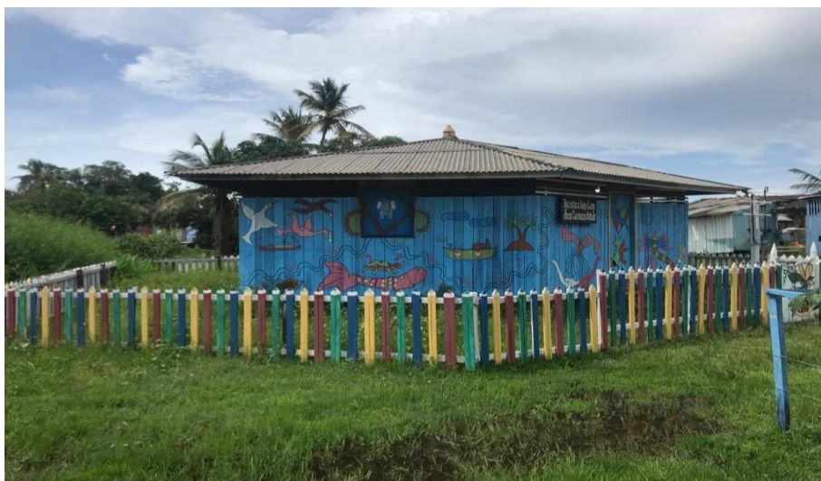
Figura 10 - Biblioteca Comunitária Vagalume