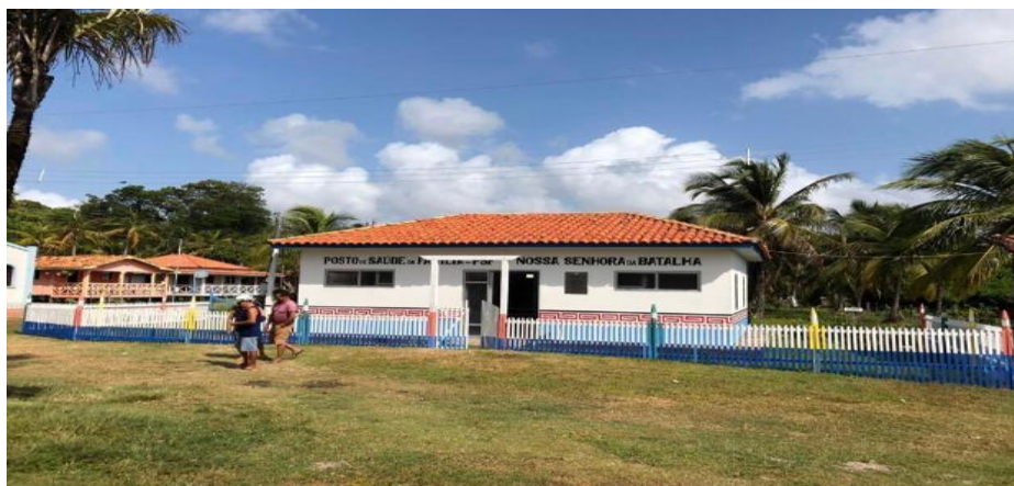
Figura 6 - Posto de Saúde Nossa Senhora da Batalha