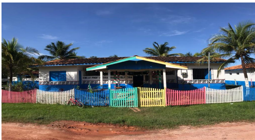
Figura 7- EMEF Alzira Araújo de Oliveira