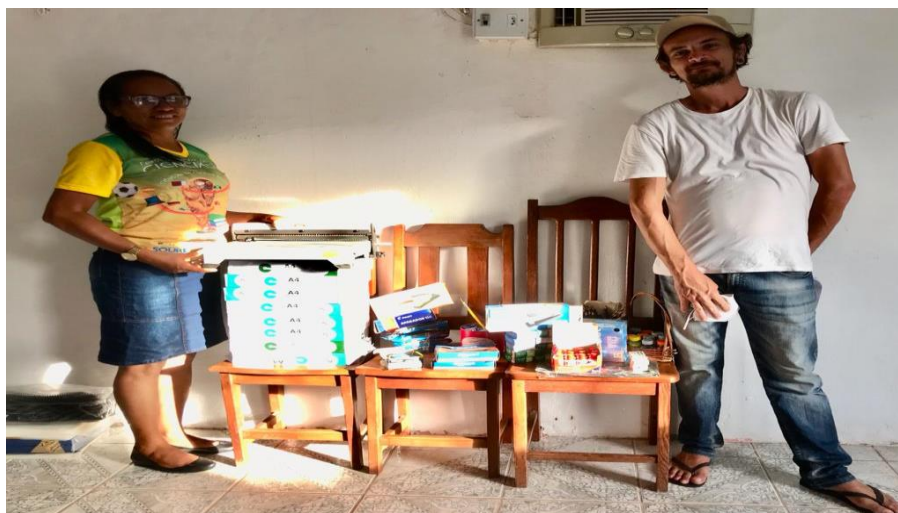
Figura 9 - Doações para a EMEF do Povoado do Céu