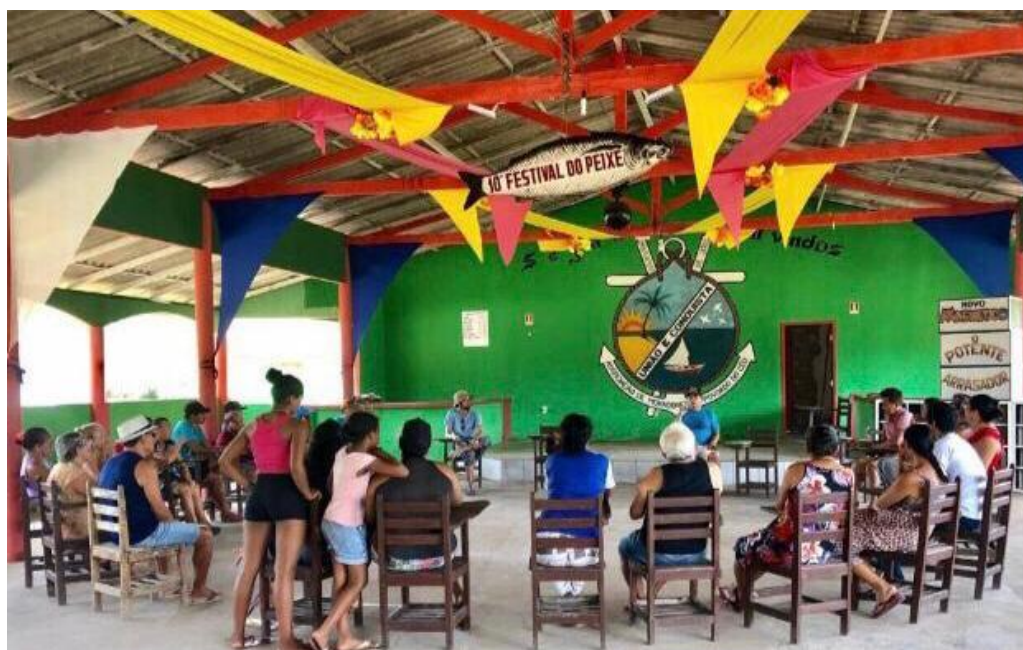
Figura 5 - Reunião na sede da AMPOC