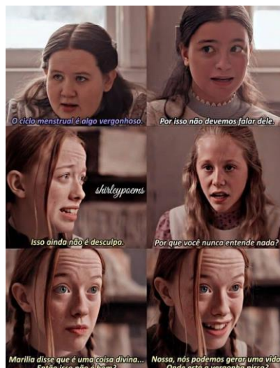
Figura 3- Frames da série “Anne with an E”

O debate sobre essas questões novamente retomou a discussão sobre como a menstruação ainda é tratada como um tabu e a necessidade de reverter esse quadro. Para auxiliar na compreensão desse tema tomamos como base dois materiais que estão fora do currículo da escola, mas que podem ser empregados como elementos que facilitam o aprendizado tornando-o mais dinâmico e prazeroso. Com o tempo da aula restrito, e por esse motivo ser impossível a incluir uma exibição, optamos por recomendar aos alunos que assistissem em casa o episódio “um laço de amizade” da série “Anne with an E” 4 .