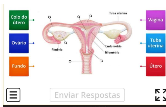
Figura 5- Imagens do jogo online

Devido a aula ser online e muitos alunos não condições de acessar o link, o jogo foi apresentado no google meet para os alunos e eles discutiam juntos a localização dos órgãos e seus nomes. Os alunos foram bem participativos, debateram entre si, se empolgavam em cada acerto e obtiveram um ótimo resultado, acertando quase todas as identificações. Foi possível observar que, durante a realização dos jogos, os alunos foram mais participativos do que durante a discussão das questões sociais, isso, provavelmente, ocorre devido os temas sociais causarem certo desconforto nos alunos que não estão acostumados com tais questionamentos em sala de aula e também porque os jogos são estimulantes e permitem maior interação dos alunos. O caráter lúdico dos jogos é frequentemente associado a uma possibilidade de motivar os estudantes a aprender ciências de modo menos formal e mais prazeroso (CUNHA, 2012). Os jogos são também defendidos como geradores de um ambiente favorável ao trabalho em equipe e à manifestação da criatividade (SOARES, 2004). Além disso, destacamos que devido ao pouco tempo que tivemos não foi possível incluir outros jogos de revisão para abordar os temas sociais.