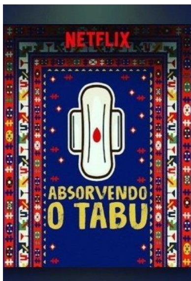
Figura 4 – Divulgação do Documentário Absorvendo o Tabu

No documentário, os homens se referem à menstruação como “ um tipo de doença que afeta principalmente as mulheres ” ou como “ um problema feminino ”. Tais falas, entre tantos outros momentos mostrados no documentário, podem ser problematizadas para discutir que esse evento natural não é uma doença e muito menos pode ser classificado como um problema.