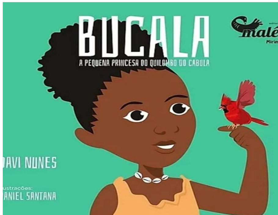
Figura 2- Capa do livro Bucala: a Pequena princesa do Quilombo Cabula