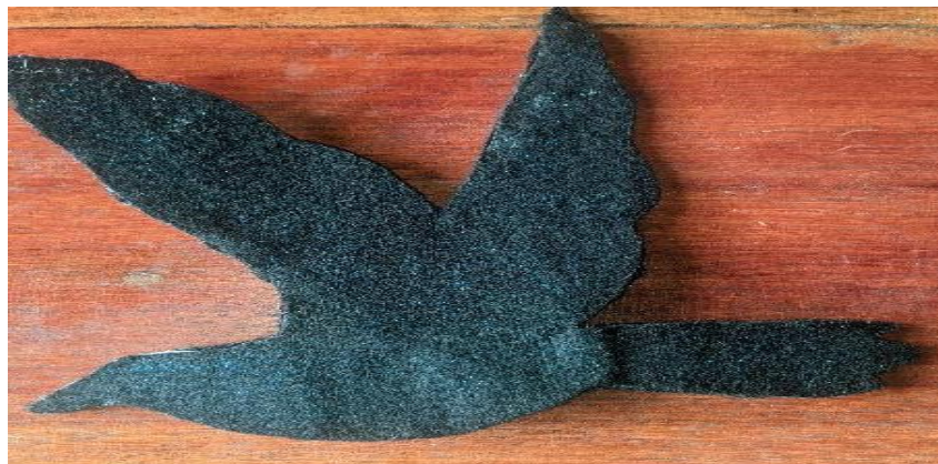
Figura 6- Pássaro Preto