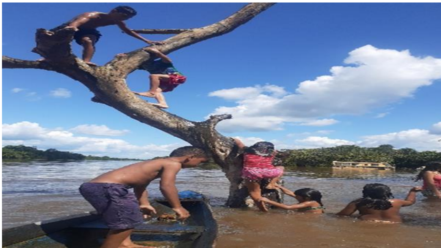
Imagem 1- Criança subindo na árvore no rio Gurupi

Na convivência diária, as crianças transitam livremente por todas as partes do quilombo, onde brincam uns com os outros, de diversas brincadeiras como: pira pega, futebol, sobem nas árvores, pulam das árvores no rio, pulam nas poças de lama, fazem briga de galo dentro do rio, a beira do rio é o ambiente mais utilizados para as brincadeiras, e acaba se tornando um espaço de encontro entre as crianças. As imagens a seguir mostram justamente uma das ações que demonstra o significado para as crianças de “viver livre”.