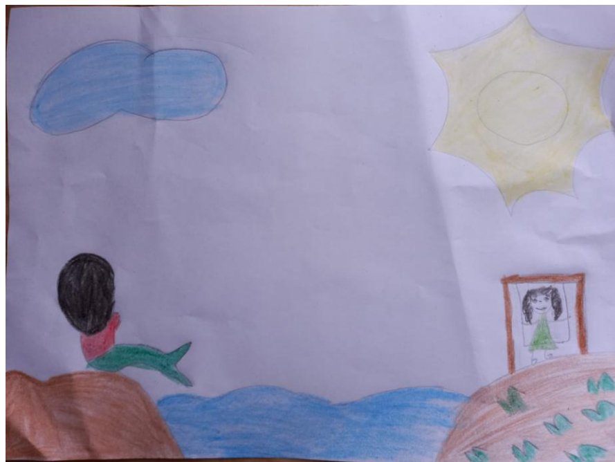
Figura 9- Mãe d'água

Ana, 7 anos diz: sempre que eu vou no vovô ele conta história de bichos, de curupira de visagem até da mãe d'água que vive no igarapé ou no rio, ele fala que eu não posso banhar meio-dia no igarapé porque é nessa hora que ele tá lá e pode pegar eu.