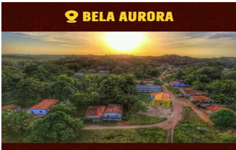
Figura 1 - Localização do quilombo Bela Aurora

A religião predominante é a católica, tendo como padroeiro do quilombo São Domingos Gusmão, que sempre é festejado nos dias de 31 de julho a 8 de agosto, o festejo conta com levantação do mastro, rezas nas casas dos moradores do quilombo, assim como na igreja. O quilombo sendo formado, em sua maioria, por pessoas escravizadas do estado do Maranhão a sua cultura carrega resquício do estado, onde trazem como uma das práticas culturais o Bumba Meu Boi ou de preferência como é chamado pelos moradores do quilombo de “Boiada”, além disso o Carimbó também é outra prática cultural presente no quilombo.