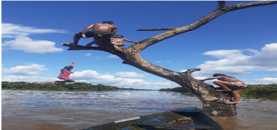
Imagem 2- Criança no pulando da árvore no rio Gurupi