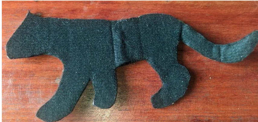
Figura 7- Onça Suçuarana