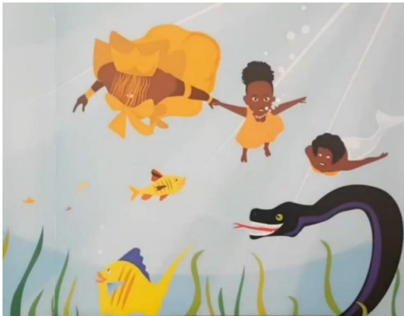
Imagem 4-Deusa Celeste