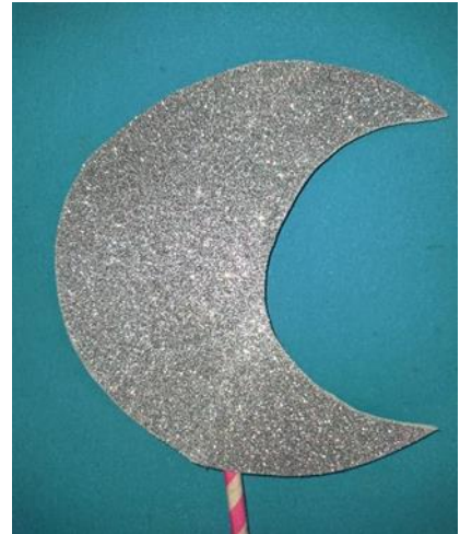
Figura 5- Lua prateada