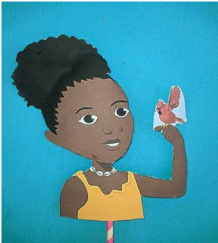
Figura 4- Princesa Bucala

A história Bucala: a pequena princesa do Quilombo Cabula, aborda a literatura africana e conta a história de uma princesa quilombola que tenta proteger seu quilombo dos capitães do mato. A árvore Sumaúma foi escolhida para a cotação dessa história, por ser uma referência na história de Bucala, sendo um local apropriado para esse momento e sem dúvida ganhou mais sentido para as crianças. As figuras a seguir mostram os recursos utilizados para contar a história, no qual mostra na figura 4 a Princesa Bucala, na figura 5 a Lua Prateada, na figura 6 o Pássaro Preto e por último na figura 7 Onças Suçuarana.