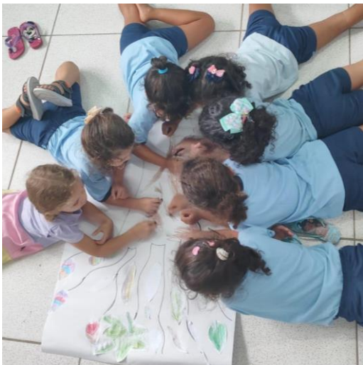
Figura 3 - Criação da árvore com folhas caindo