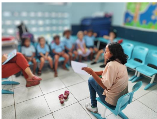
Figura 1 - Contação de História

Dessa forma, as crianças, por meio dos campos de experiência da Base Nacional Comum Curricular (BNCC), como o “corpo, gestos e movimentos”, produziram conhecimentos a partir do que observavam ao seu redor. Por isso, é essencial essa relação ampliada com a natureza. Além disso, através da história, a criança, ao usar sua “escuta, fala, pensamento e imaginação”, entende e visualiza o que está sendo lido de acordo com sua própria forma de imaginar. Quando observam os diferentes formatos das folhas, elas conseguem reproduzi-las em seus desenhos, utilizando as cores que imaginam, o que se encaixa nos campos de experiência de “traços, sons, cores e formas”. Esses elementos contribuem de forma significativa para o seu ensino e aprendizagem, promovendo o desenvolvimento integral da criança.