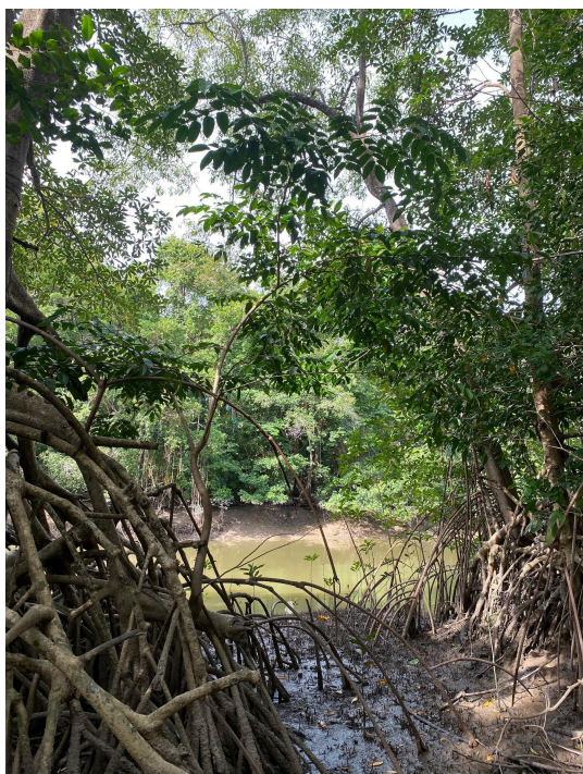
Figura V - O Igarapé do Jubim.