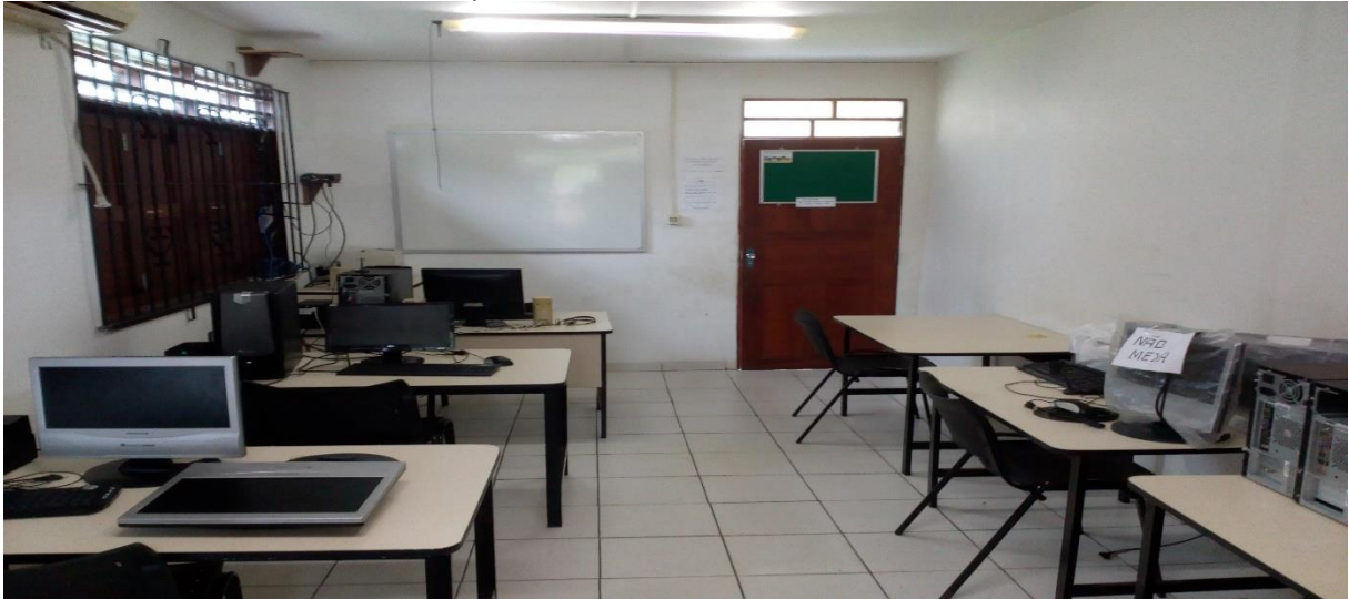
Foto 4 - Info Centro do Instituto Ampliar

Abaixo foto do espaço onde funciona o info centro utilizado para pesquisas escolares: