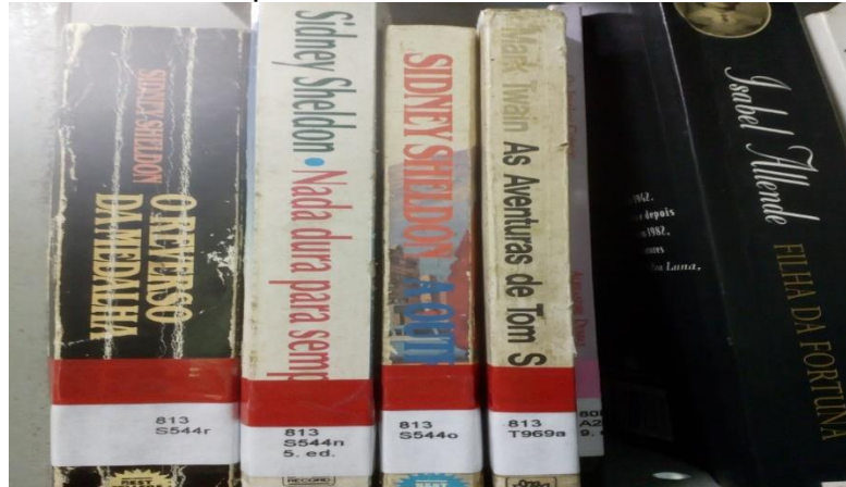
Foto 11 - Exemplares inseridos no Biblivre

Para melhor facilitar a localização o acervo está classificado de acordo com a Classificação Decimal de Dewey (CDD), porém, a maioria das obras não estão catalogados ainda e com a recente implantação do sistema de automação, o Biblivre, parte do acervo está sendo inserido no sistema.