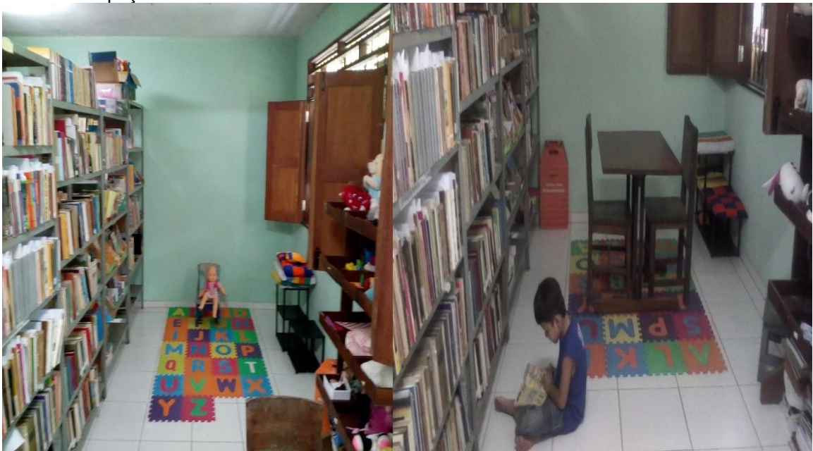
Foto 10 - Espaço infantil da Biblioteca Comunitária Bruno Fenzl