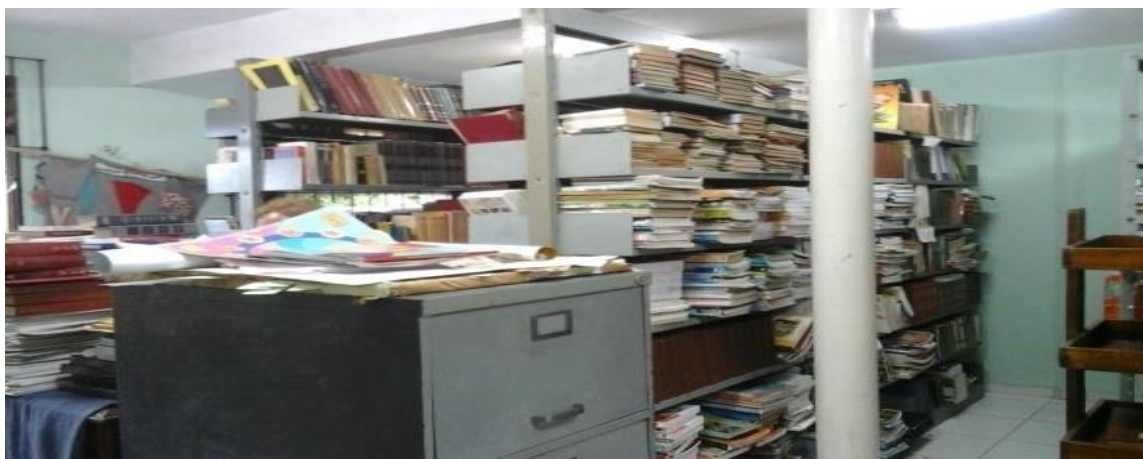
Foto 8 - Biblioteca Comunitária Bruno Fenzl antes da intervenção do projeto de extensão do Curso de Biblioteconomia

Atualmente o grupo de extensão vem realizando a manutenção, disposição do espaço físico, tratamento técnico do acervo da Biblioteca Comunitária Bruno Fenzl o qual não recebia essa intervenção desde sua implantação, sendo, recentemente instalado sistema de automação gratuito de bibliotecas, o Bibliivre , que visa assim, facilitar no serviço de empréstimo, cadastramento de usuários e controle do acervo. Fotos a seguir da organização do espaço físico e acervo da biblioteca pelos alunos da extensão do curso de Biblioteconomia/ UFPA.