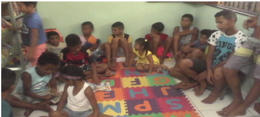
Foto 12 - Atividade com os usuários da Biblioteca Comunitária Bruno Fenzl

Os colaboradores e voluntários do Ampliar buscam atrair o público com baixo rendimento escolar, desprovidos do hábito da leitura e que vivem distante do centro urbano, então, aos sábados são realizadas atividades como: dinâmicas em grupo de leitura, pintura, colagem, futebol com as crianças, auxiliam nas tarefas escolares, e acima de tudo buscam conscientizar os jovens, adolescentes e crianças que frequentam o Instituto sobre a importância de preservar e cuidar do meio ambiente. Na foto abaixo podemos visualizar atividades desenvolvidas no sábado acima mencionadas pelos estudantes extensionistas do Curso de Biblioteconomia/UFPA e voluntários do Instituto Ampliar: