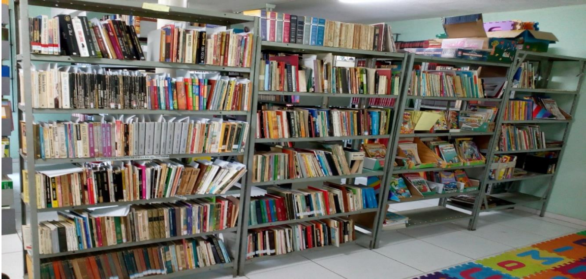
Foto 9 - Espaço da biblioteca após ação do Projeto de extensão do Curso de Biblioteconomia.