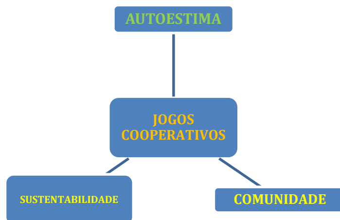
Figura 1: Esquema dos jogos cooperativos

Fonte: Pesquisador /2020 (Esquema teórico de TERRY ORLICK)