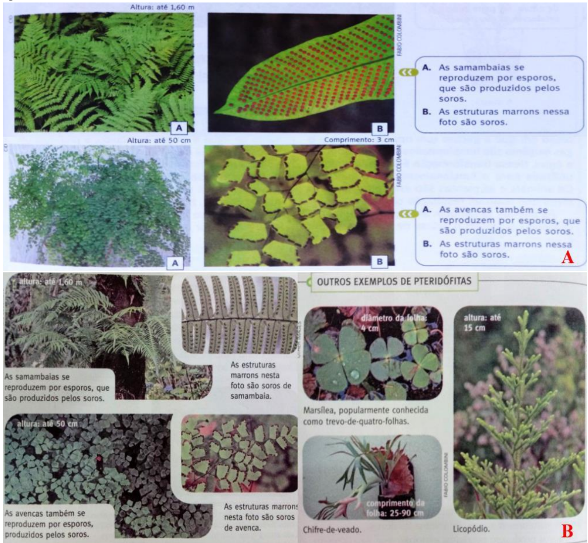
Figura 1: Representantes do grupo Pteridófitas. A. Exemplos apresentados no LD1. B. Exemplos apresentados no LD2.