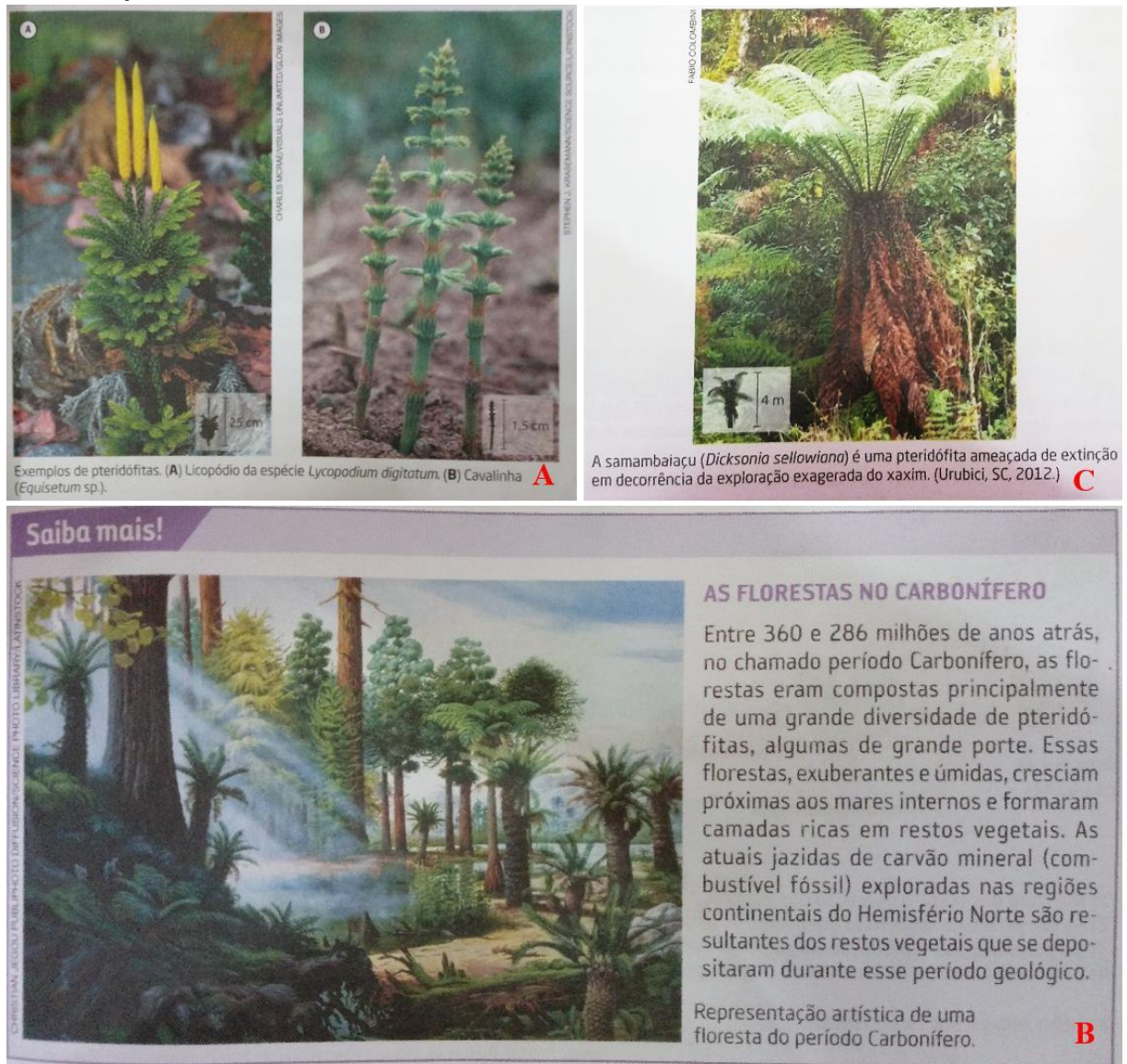
Figura 2: Representantes do grupo Pteridófitas apresentados no LD4. A. Licopódio e Cavalinha como representantes do grupo Pteridófitas. B. Representação artística de uma floresta do período carbonífero. C. Samambaiçu ( Dicksonia sellowiana Hook).

Fonte: SALES; LANDIM, 2009; SCHULTZ, 2015