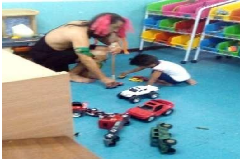
Figura 17 – Curupira te ensino a brincar comigo.

Após catarem a música do bambu para brincarem, o personagem foi convidado a brincar com os meninos, que ensinavam suas brincadeiras, como se o personagem não conhecesse, assim ele era ensinado pelas crianças a brincar de carro, super-herói entre outros. No final a turma se despediu do personagem, que disse que em outra ocasião, voltaria para visitá-los.