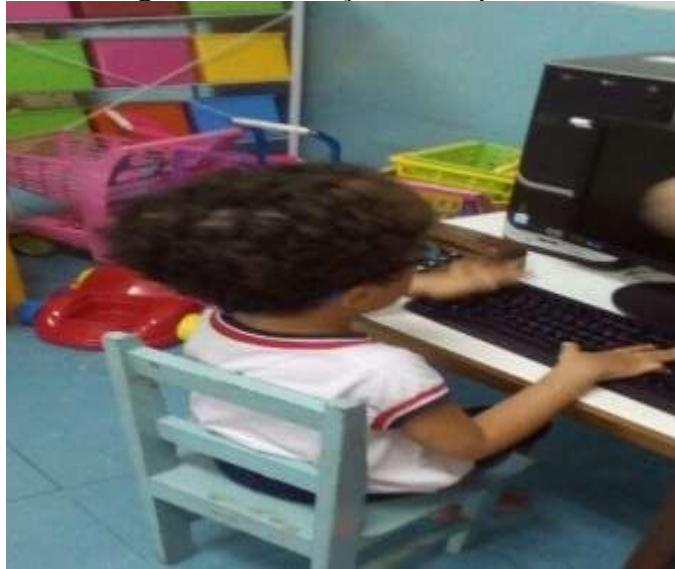
Figura 4 - A criança e o computador.

A esquerda tem uma mesinha com cinco lugares, uma pequena estante de PVC para jogos e brinquedos, uma casinha de madeira para bonecas, uma estante para os carros maiores, uma mesinha do construtor, os contêineres coloridos com fotos indicativas dos brinquedos, caixas organizadoras com lego, peças grande de encaixar, a feirinha com cestinha e carrinho para compras, a mesinha da informática, a tenda com tatame de EVA, carro de madeira com a boneca grande e casinhas de bonecas.