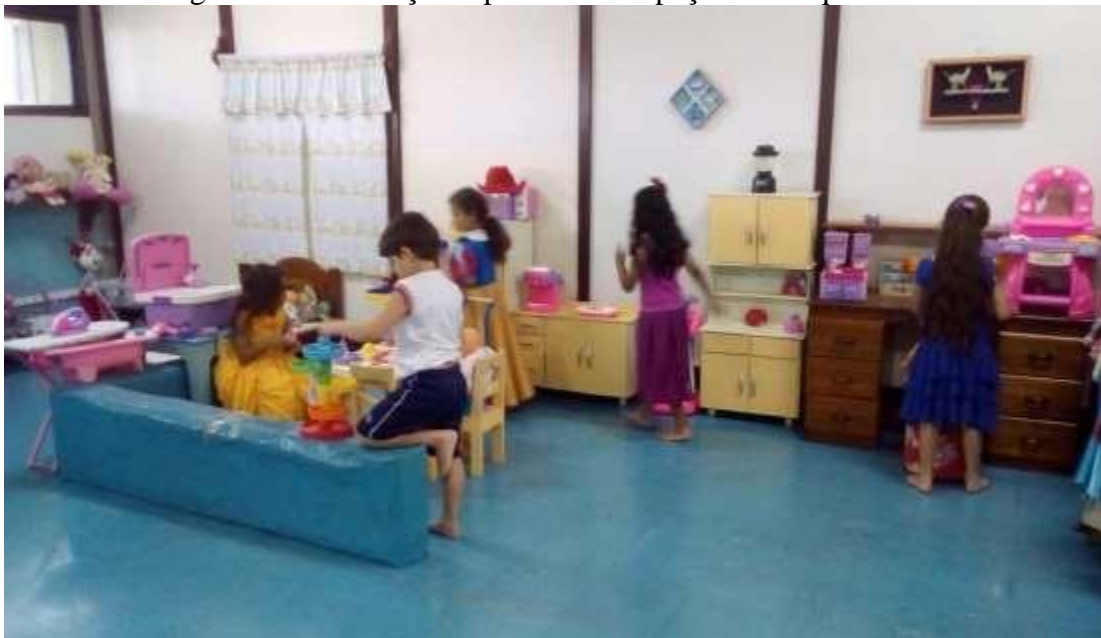
Figura 3 - As crianças explorando o espaço da brinquedoteca.

Com isso, os alunos aprendem não somente a explorar todos os elementos e materiais disponibilizados, aprendem inclusive a cuidar desse lugar que temos móveis e objetos da sala adaptados para o tamanho e idade deles, facilitando o manejo na hora das brincadeiras.