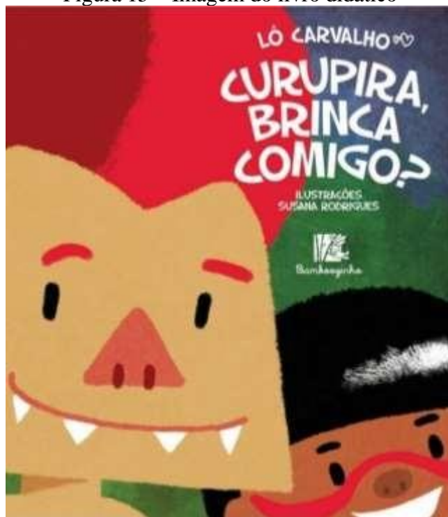
Figura 15 – Imagem do livro didático

Como rotina do espaço, a professora pediu para que todos sentassem em frente à casa amarela onde um livro de título, CURUPIRA BRINCA COMIGO? Do autor Lô Carvalho 2014, estava à espera dos alunos, que se mostraram interessado, em instantes a professora tratou de apresentar a obra literária, a qual conta a história de um indiozinho que chama as lendas para brincar, convidando uma por uma, e quando todos se juntam, chamam pela criançada para brincar também.