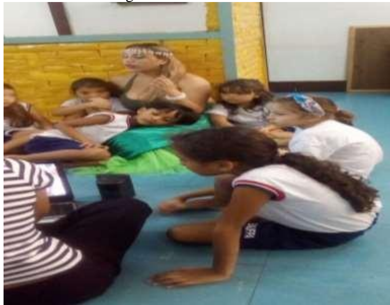
Figura 14 - Iara e os ritmos

Na roda de finalização, a personagem falou sobre quatro ritmos para apresentar para a turma, com auxílio de um computador usado como recurso, para que pudéssemos tocar os ritmos do lundu, síria, xote e carimbó 5 para as crianças ouvirem. A professora demonstrou cada música tendo o cuidado de explicar as mudanças de um ritmo para o outro, para que todos conhecessem e ao som do ritmo do carimbo todos foram calçando os sapatos para saírem.