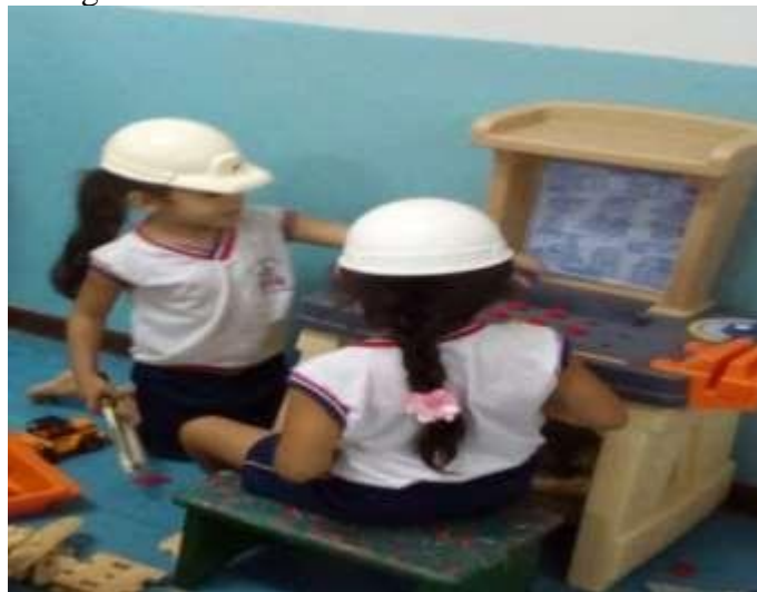
Figura 5 - Duas meninas na mesa do construtor.