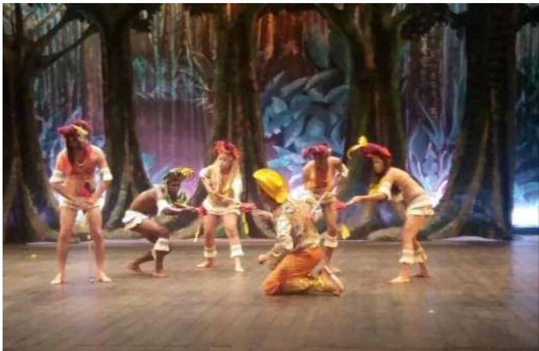
Figura 1- Teatro Margarida Schivasappa (2016)

Tive oportunidade de demonstrar um pouco do que estava aprendendo nas disciplinas práticas quando conheci o grupo TEM (Teatro experimental de Mosqueiro) um grupo de teatro popular que vem a mais de seis décadas fazendo alegria do público com espetáculos como o Pássaro Junino Tangará, realizado durante a quadra junina e a Pastorinha, encenada no Auto de Natal, em paralelo com a graduação, participei dos espetáculos anuais do Pássaro, fazendo parte da maloca, um pequeno núcleo de cinco pessoas personificados de indígenas que desenvolvem as ações teatrais seguindo um roteiro, contribuindo com o desfecho da trama.