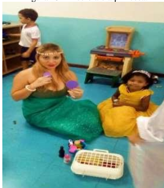
Figura 13 - A sereia e a princesa.

A turma cantou a música do bambu para a Iara aprender a cantar e logo foram brincar com os brinquedos, jogos e fantasias do espaço, alguns meninos escolheram se fantasiaram com jaleco e chapéu branco, dizendo que eram os botos, já as meninas ficavam com a Iara na cozinha servido comidinha e cuidando dos seus cabelos.