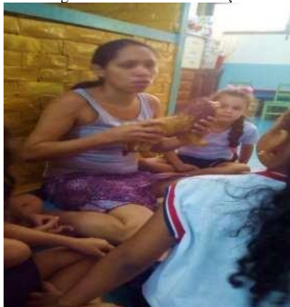
Figura 8 - Troca e socialização.

Acrescento essas vivências à brinquedoteca da EAUFPA, onde descrevo minha participação na primeira semana do mês de agosto, onde houve o acolhimento das turmas relembrando as regras existentes de cuidado e organização dos brinquedos e do espaço, apresentando os brinquedos que foram consertados no por mim e em alguns momentos com a equipe da brinquedoteca no período das férias, ressaltando os cuidados que se deve ter ao brincar com eles por estarem fragilizados e com os outros brinquedos que foram higienizados para esperar pelas turmas após as férias.