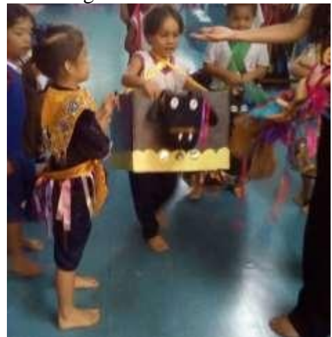
Figura 7 – Boi bumbá.