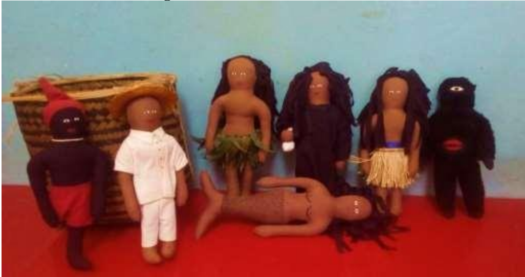
Figura 10 - O cesto dos encantados