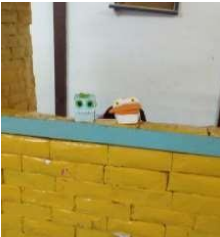
Figura 6 - Fantoques de caixinhas.

O que caracteriza a brincadeira é que ela pode fabricar seus objetos, em especial, desviando de seu uso habitual que cercam a criança; além do mais é uma atividade livre, e não pode ser delimitada (...) no brinquedo o valor simbólico é a função (BROUGÈRE, 1995, p.13-14, Apud, Vieira)