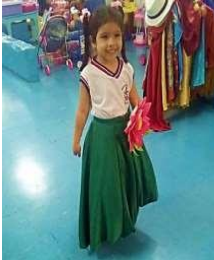
Figura 9 - A menina e a criação cênica.

Houve algo interessante com uma aluna da turma do Pré I A, quando estava brincando, pediu para a professora que pudesse emprestar uma saia para ela ser a Vitória Régia, e disponibilizamos outra saia, que tinha sido confeccionada para servir de reserva, quando ela se vestiu, veio mostrar como ela estava bonita, disse que naquela hora ela se transformou em Vitória Régia.