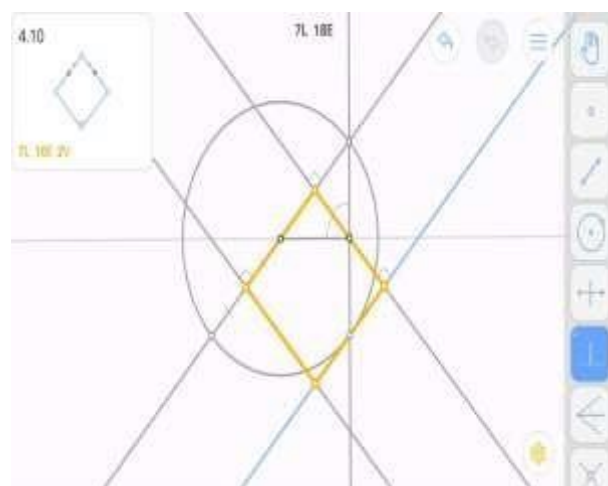
Figura 2 – Fase do Euclidea