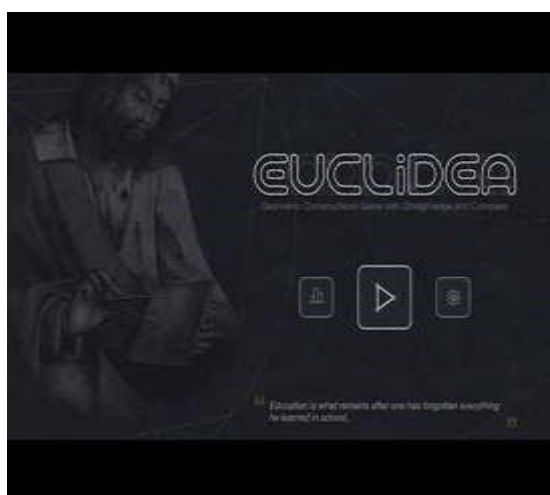
Figura 1 – Capa do Euclidea

O jogo Euclidea (imagem 1) se apresenta como um método singular para aprender, explorar e desfrutar das fundações da geometria euclidiana. Nele, o desafio se desenha na resolução de questões intrigantes através da execução de construções geométricas com régua e compasso. A excelência está na capacidade de projetar as soluções mais simples e elegantes, servindo-se do menor número de movimentos, o que culminará na obtenção das pontuações mais elevadas. Tais soluções são avaliadas tanto em relação às linhas (L) quanto às construções elementares euclidianas (E) (imagem 2).