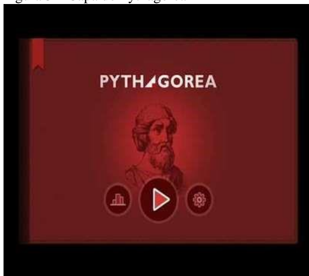
Figura 3 – Capa do Pythagorea

Expressando a singularidade dessas experiências, um estudante assim se manifestou: "Dentre todos os jogos matemáticos que eu já joguei, esse é certamente o mais desafiador. Até nos tópicos mais simples, como comprimento e distância, vai ser preciso bastante criatividade para resolver os desafios" (Estudante A). Esse estudante parece estar mergulhado em um mundo de desafios matemáticos, ele está explorando um jogo que vai além do comum, exigindo habilidades e pensamento criativo mesmo nas áreas mais básicas, como comprimento e distância. Essa combinação de desafio e criatividade pode ser uma jornada incrível para ele, expandindo sua mente e habilidades matemáticas. É fascinante como um jogo pode proporcionar tanto aprendizado e diversão ao mesmo tempo, desafiando-o a encontrar soluções inovadoras para problemas simples e complexos.