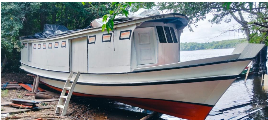
Fig. 1 – Barco Rosinete Quaresma da Silva, em reforma para o ano letivo de 2026.