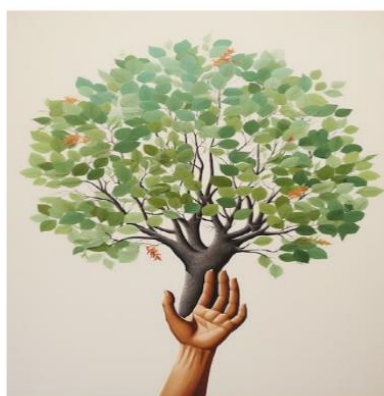
Tracuateua-Pará Ano 2025

Nessa conversa, serão feitos os seguintes questionamentos: “você sabem o que é canteiro? Conhecem algum quintal que tenha canteiro?” “Que tipos de plantas são cultivados neles?” “Vocês sabem dizer porque o projeto tem esse nome?”. Diante dessas respostas será explicado que o intuito do projeto foi mostrar e valorizar o fato de que muitas pessoas mais velhas do município de Tracuateua sabem usar as plantas para tratar dores, gripe, machucados e até para fortalecer o corpo. E que, no entanto, esse conhecimento está se perdendo com o tempo. E para saber a noção deles sobre o gênero entrevista será utilizado um jogo bem simples, composto de cartas com perguntas sérias e outras engraçadas. Será necessário dividir a turma em dois grupos: GP 1 – entrevistadores / GP 2 – entrevistados. Um representante de cada grupo se posiciona à frente, o do GP1 tira uma carta e faz a pergunta, e o do GP2 deve respondê-la. Com o intuito de levar os alunos a refletir sobre tipos de perguntas e a função delas na entrevista, depois que forem lidas todas as cartas, será discutido com a turma: quais perguntas pareceram mais adequadas para uma entrevista? Houve perguntas curiosas, pessoais, objetivas?