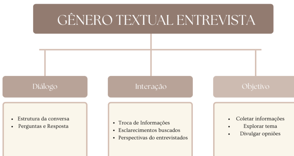
Figura 1- esquema do gênero

Tendo em vista que a entrevista pode ser marcada por uma sequência narrativa, argumentativa ou descritiva, no quadro abaixo podemos visualizar melhor a sua estrutura: