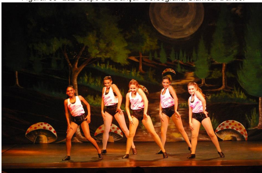
Figura. 05- Luz Grupo De Dança. Coreografia Glamour Dance .

Glamour é uma palavra de origem escocesa, pois nos tempos medievais, somente poucos clérigos sabiam ler e escrever e tinham conhecimento de gramática, e para todos os outros, a gramática era associada a práticas ocultas e misteriosas. Naquela época, a palavra "Grammar", em inglês, significava encantamento; feitiço, e em escocês, a palavra era escrita com a letra L, em vez de R, o que acabou tornando-se o termo Glamour conhecido atualmente. ( http://www.significados.com.br/glamour/ Último acesso em 13/06/2014)