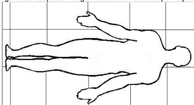
Figura. 06- Suposta imagem do contorno do corpo no jornal com o aluno em decúbito dorsal

Os materiais necessários para esta aula são: jornais, fita crepe e pincel de escrever em quadro branco. Em sala de aula o professor irá dividir a turma em grupos. Depois dará o comando aos grupos para que cada um destes cole os jornais lado a lado, a quantidade de colagem de jornais será em função da altura e largura definida através de um aluno selecionado em cada grupo, pois este será contornado posteriormente no jornal, como se fosse um mapa do contorno do corpo. O aluno escolhido pelo grupo deverá deitar-se em cima da colagem em decúbito dorsal 52 para que os demais do grupo contornem o corpo deste aluno na colagem de jornal.