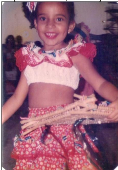
Figura. 02- Dançando Carimbó, na festa junina da escola.