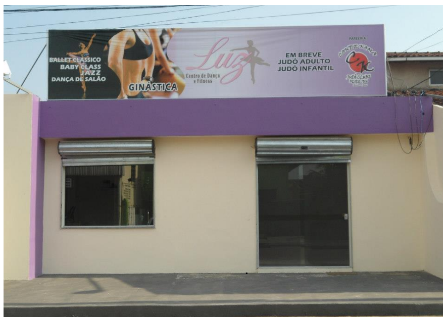
Figura. 04- Luz Centro De Dança. Ananindeua-PA